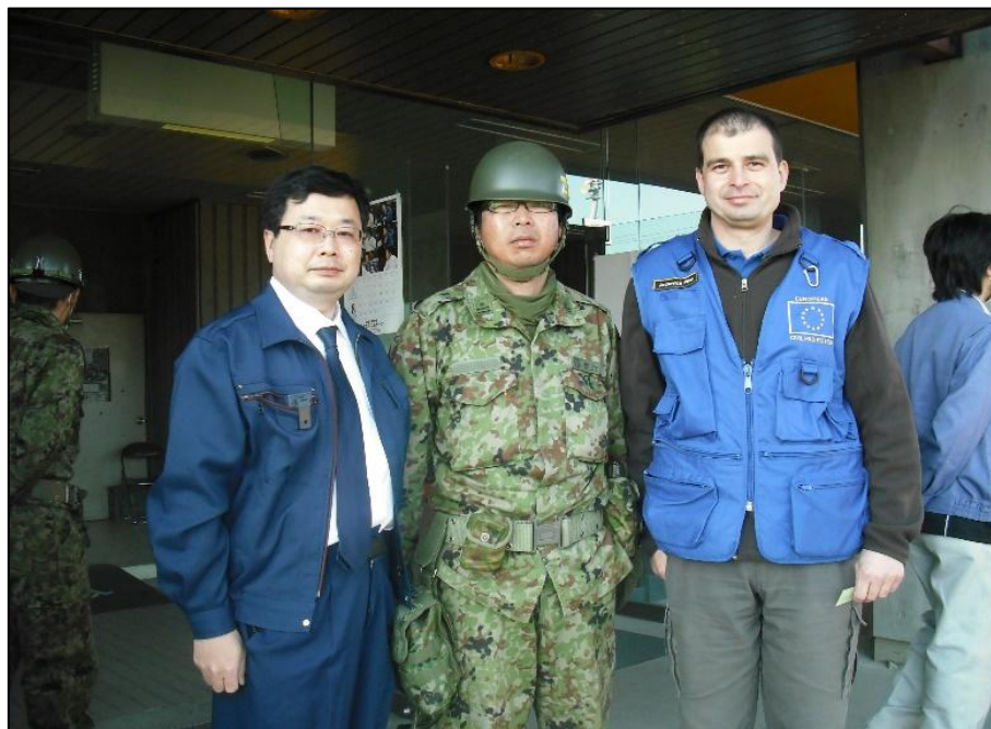
1. kép Magyar szakértő Japánban, mint az EU Polgári Védelmi Csapat tagja, a fukushimai katasztrófa idején 2011. április 6-án, Miyagi Prefektúrában, a magyar kormányzati segélyszállítmány átadásán

A magyar kormány egy 8 fős kutató-mentő csapatot és egy polgári védelmi tisztet ajánlott fel [1]. Magyarország nemcsak szakértői szinten, hanem jelentős anyagi támogatással is képviseltette magát. A magyar segélyszállítmány 26 tonnát (73 raklapot) tett ki, amely több mint 28 000 almasziromot, 8 000 őszibarackkonzervet és 27 000 szelet csokoládét és konzervet tartalmazott a károsultak számára (3. táblázat) [1]. Az EU Polgári Védelmi Mechanizmus keretében közel 350 tonna humanitárius segélyt sikerült az uniós polgári védelmi szakértői csapatnak fogadnia és eljuttatnia Japán öt legjobban károsodott prefektúrájába (1. kép). Az EU és az EU tagállamok szolidaritásuk keretében, összesen 16 millió eurós támogatást adtak a földrengés, a szökőár és a nukleáris baleset által sújtott Japánnak [1].