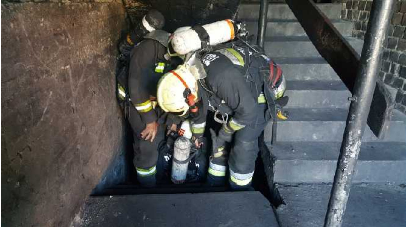
3. számú Disaster Medic felkészítés kárhelyszíni körülmények között