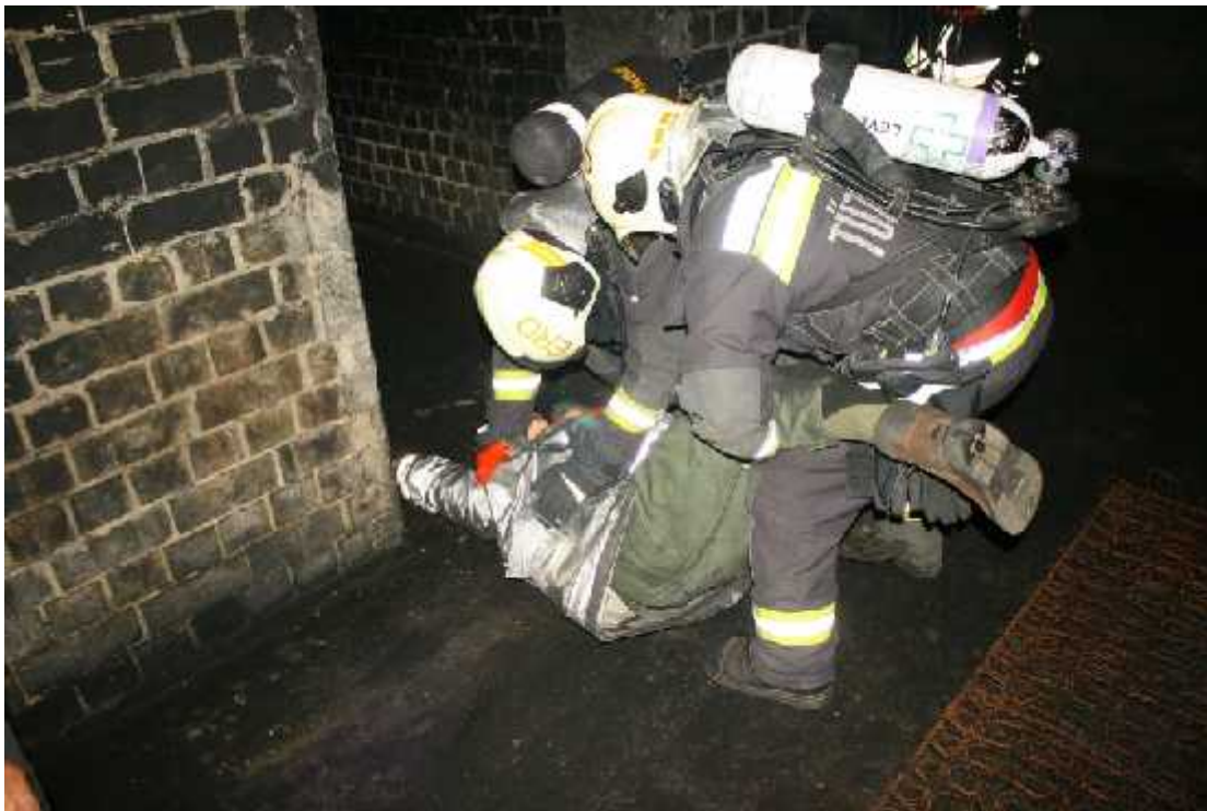
2. számú Mentés a kárhelyszínen