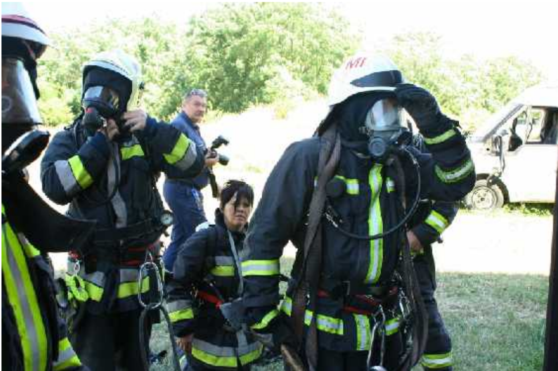
4. számú Disaster Medic felkészítés