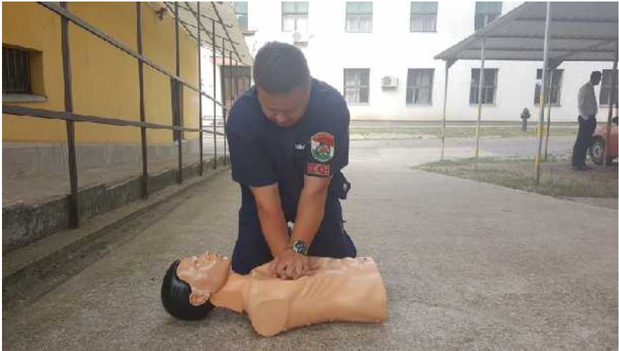
1. számú Újraélesztési gyakorlat