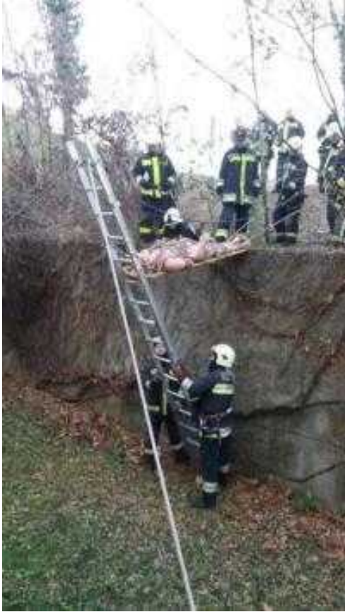
5. számú Kárhelyszíni taktikai képzés