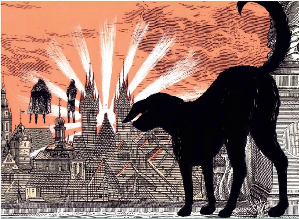
4. kép. Az ember tragédiája – X. szín: Több fényt

Marcell mindig a nagy elbeszélésre támaszkodott, még ha ez az elbeszéléske- ret (világnézet) nehezen körvonalazható is.