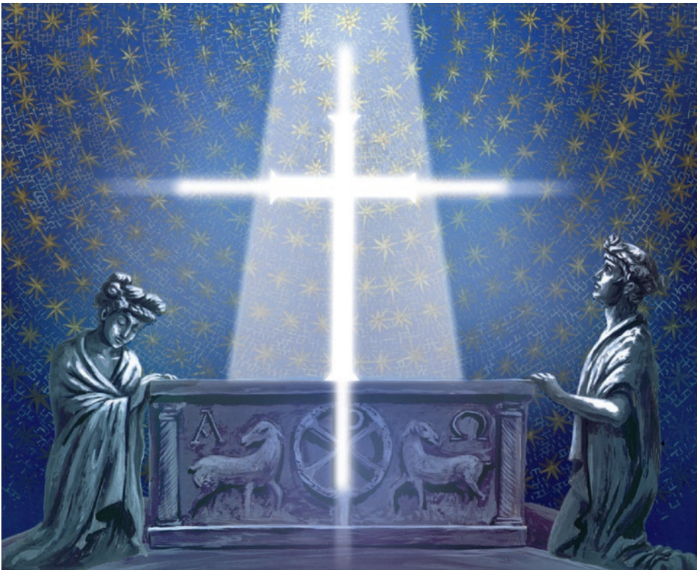
2. kép. Az ember tragédiája – VI. szín: Hercules a válaszüton

dám György festőművész így emlékszik erre: „1968-ban következett a nagy váltás. Az Air India. (...) Jankovics úgy kapta meg ezt a megrendelést, hogy a légitársaság művészeti vezetője Kovásznai György Átváltozások című filmjét látva, ebben a stílusban akarta elkészíttetni a reklámot, de Kovásznai nemet mondott. A stúdió vezetése – ismerve Jankovics szorgalmát, gyorsaságát, s azt a képességét, hogy a rábízott feladatot szinte bármilyen grafikai stílusban képes megoldani – rábízta a munkát” (Szemadám 1987, 9). ( Kiemelés tőlem – L. Gy. ) Ez a bármilyen természetesen elismerő jelző, ugyanakkor szándéka ellenére is kifejezi Jankovicsnak a saját stílusra vonatkozó hiányérzetét is. Közismert, hogy Jankovics Marcell első egész estés animációs filmje, a János vitéz (1973) is egy kortárs rajzfilm és zenei klip vizuális világát idézi. Jankovics Marcell a Sárga tengeralattjáró című Beatles-klip és egész estés animációs film képi megfogalmazását emeli át Petőfi Sándor elbeszélőkölteményének animá-