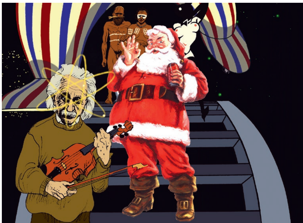
5. kép. Az ember tragédiája – XI. szín: Ó Fortuna!

A Magyar népmesék sorozattól a János vitézen át a Fehérlófiáig olyan figurákat alkot, akiknek érzései, szándékai nemcsak kivetülnek, hanem a mozgás