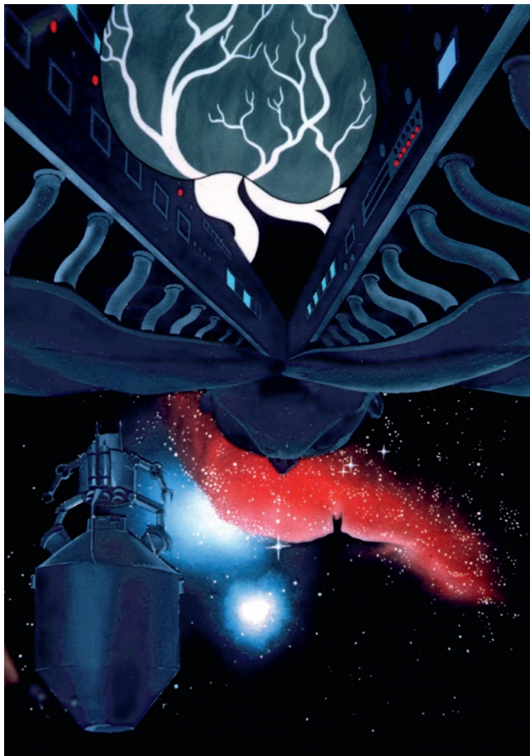
6. kép. Az ember tragédiája – XIII. szín: Az űr

a küldetésben. Életvégi megnyilatkozásai alapján mintha maga Jankovics Marcell is elbizonytalanodott volna, érdemes volt-e ennyi szerepet eljátszania. Így győzködte magát: „Ha mindazt megcsináltam volna, amit nem csináltam meg, akkor nem tudtam volna megcsinálni, amit megcsináltam” (Fejérvári 2009, 9). A tettei helyette és a mi javunkra is beszélnek – és az Ő nagyobb dicsőségére.