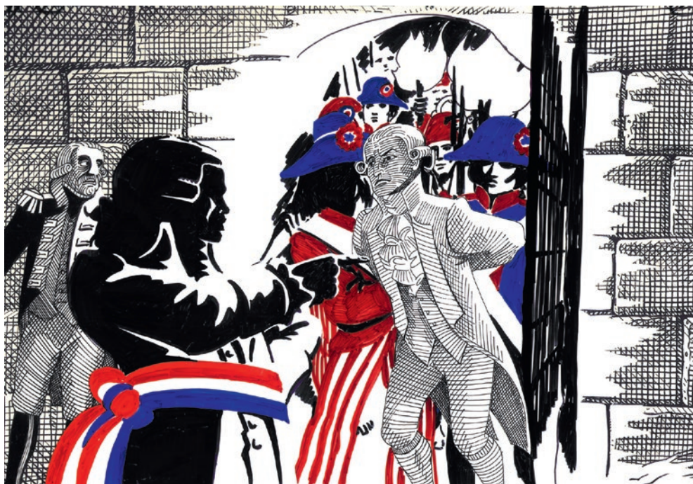
3. kép. Az ember tragédiája – IX. szín: Forradalom

A hasonló idézetek sora szinte vég nélkül folytatható a Jankovics-életműből. A harminc éven át készített, Az ember tragédiája című opusz például vállaltan ezeknek az idézeteknek, motívumoknak a seregszemléje. „Az Édenkert ábrázolásában Henri Rousseau-hatás érvényesül, míg hangszerhasználatban kiváltképpen az impresszionista zene (Debussy, Ravel) alkalmazása markáns” (Varga 2019, 48–49). Ádám és Éva a Paradicsomból való kiűzetésük után Desmond Morris szürrealista megfogalmazás módjához hasonlóan amolyan fénytükör, amelynek torz képén látható az őket körülvevő valóság. A londoni szín viszont már egyértelműen ezeknek a motívumoknak a haláltánca. Puskás Ferenc, Bar-