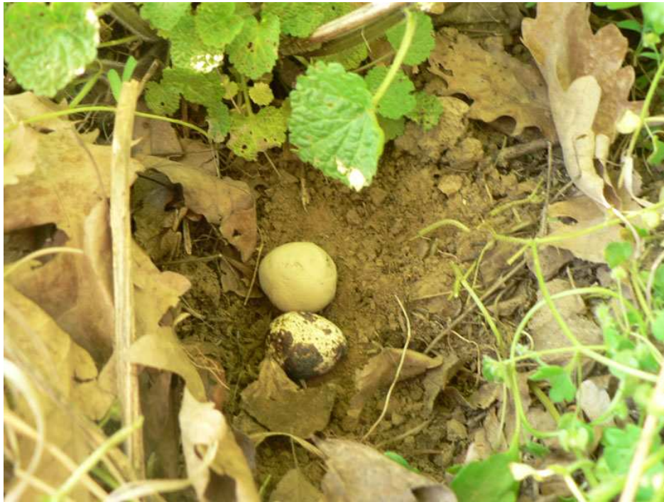
2. függelék: Műfészek. Műfészek egy fűrj és egy gyurmatojással.