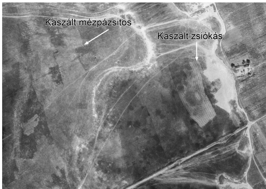
Függelék 2. ábra. Kaszált zsiókás és mézpázsitos a Büdös-szék északi részén 1971-ben

Zsiókások és nádas foltok egyaránt voltak: Ilyen kis nádbukrok voltak, ilyen kis csatak bukrok, amik képződtek (AK14). A környező tanyákon tartott állatok takarmányozásában fontos szerepet töltött be a zsióka, de a gyors öregedése miatt csak rövid időszakokban volt használható: addig lehet legeltetni, míg gyöngye, míg nincs kinn a bugája, addig le lehet vágni takarmánynak is (AK2), de gyakran ebben az időszakban még vízben áll, ezért vízben kaszálták a csatakat és akkor, szánkóval, a lovakkal kihordták a partjára, a szélire, ahol partosabb [szárazabb, magasabb] rész volt. Szétterítették és akkor, amíg gyöngye volt, azt igen szerették a jószágok. És akkor, mikor mögszáradt ott kinn a partján, akkor összerakták és akkor bevitték a tanyához közelebb, vagy a tanyatelekre; A víz tetején kaszálták [a zsiókát], aki tudott kaszálni, az le tudta kaszálni a víz tetején a növényt, aki nem tudott kaszálni, annak belebújt mindjárt a vízbe a kasza (AK2).