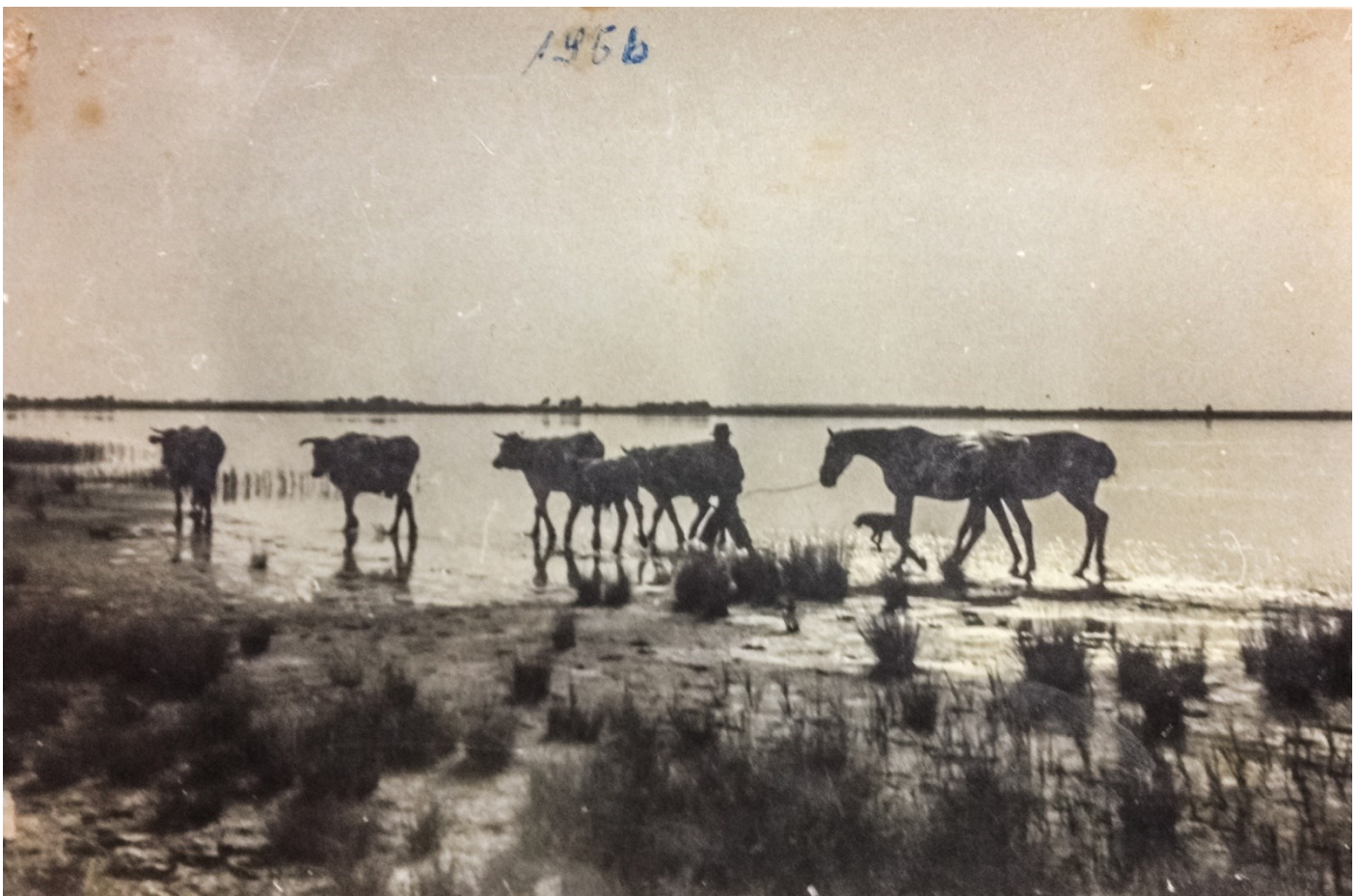
Függelék 6. ábra. Marhák és lovak a Zab-szék parti zónájában. Előtérben felnyílt zsiókás (Somogyi László felvétele, 1956)

A déli részen csak a partokon volt csatakos. Ritkás volt, meg azt majd má' ugye [ahol] nem járták az állatok besűrűsödött, ahun meg járták, ott csak ritka volt (AK1).