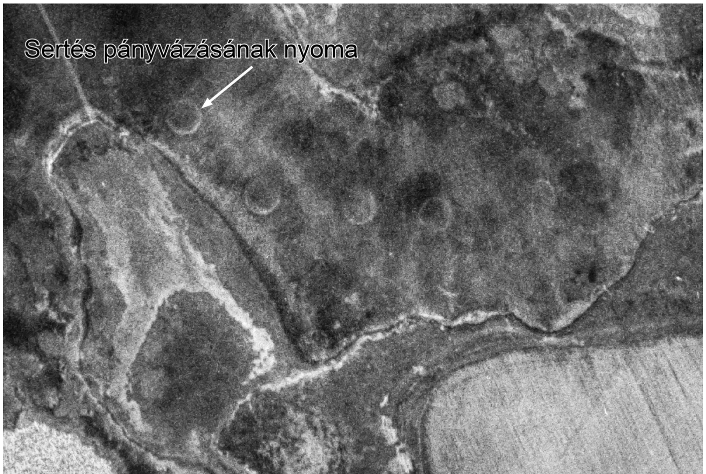
Függelék 5. ábra. Sertések pányvás legeltetésének nyomai a Szujkó-szék zsiókásában 1966-ban. „A disznók ki is túrták a csatakot, ahova ki voltak pányvázva” (AK1) (Forrás: www.fentrol.hu , 1966_0708_2312.tif)

A Szujkó-szék legmélyebb részei ma sűrű nádasok, szegélyükben zsiókások és mézpázsitosok vannak. Az 1970-es években behúzott csatorna és a használat felhagyása vezethetett a növényzet záródásához: Ott se volt csatakos része néki, csak nagyon kicsi, most meg má' az egész csatakos. Régen annak is csak a legszélén volt egy kevés. Errül, amerrül a tanyák voltak, nem is volt csatakos része, csak a túloldalon (AK1).