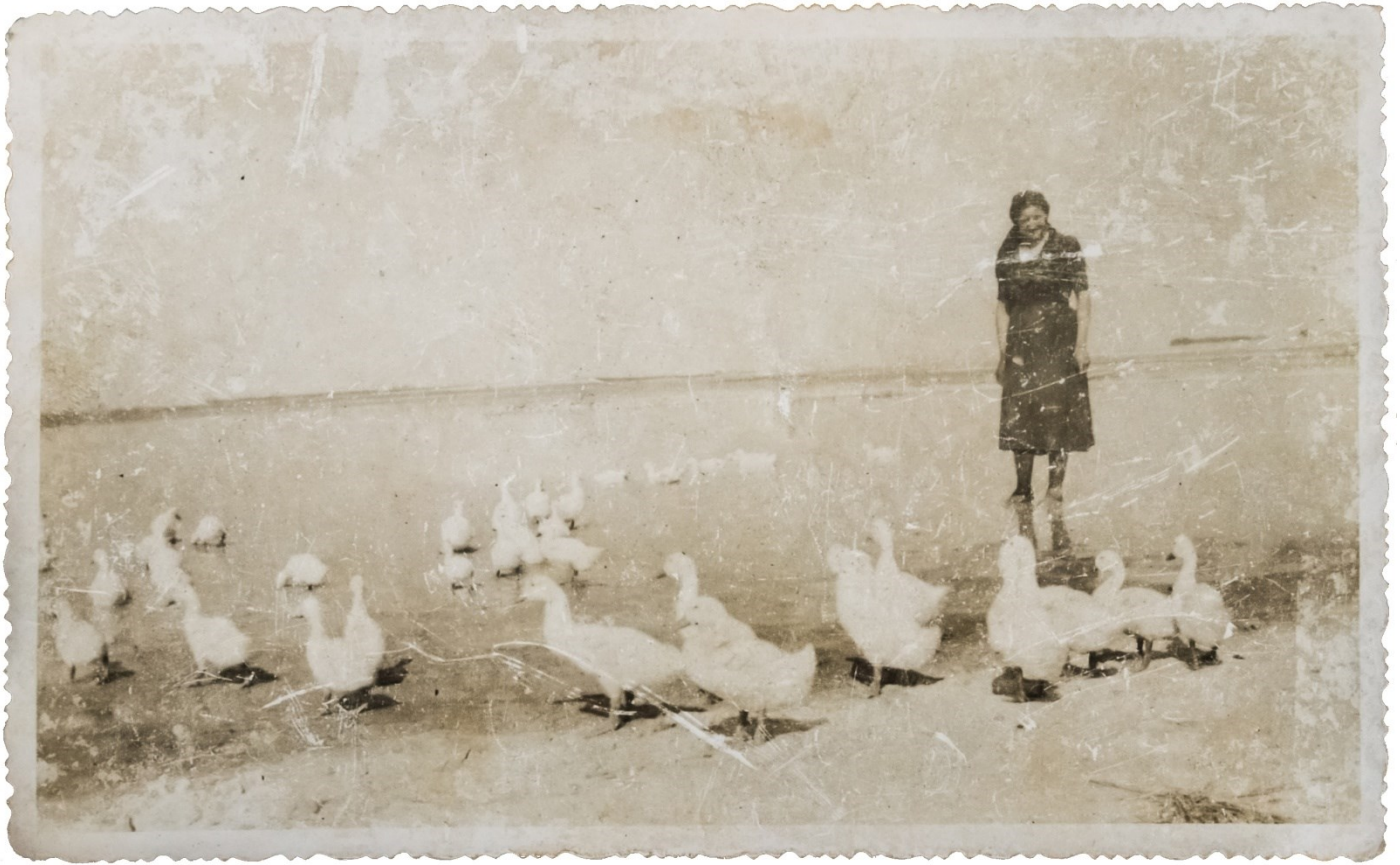
Függelék 4. ábra. Libalegeltetés a szikes tóban (Somogyi László felvétele, 1930-as évek)