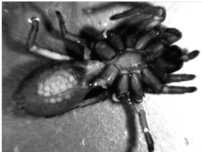
5. ábra. A N. pannonica nőtény példánya petékkel.

során egy másik nőtényt is sikerült begyűjteni a Sár-hegy egyik déli élőhelyéről (5. ábra).