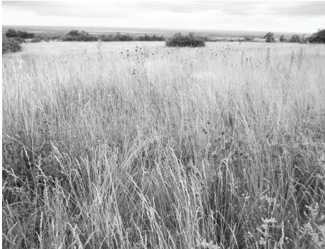
1. ábra. Kaszált élőhely a Sár-hegyen késő nyáron a kaszálás előtt.

A Sár-hegy kaszált (1–2. ábra) és kontroll sztyepprétején 2007–2010 között