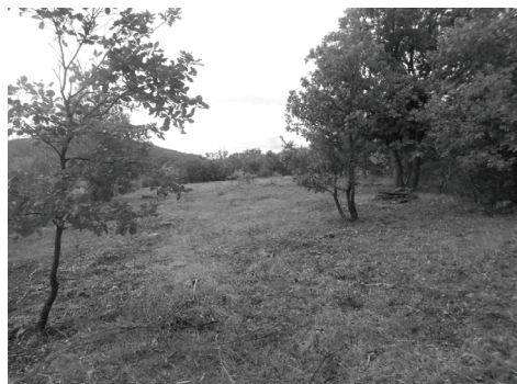
3. ábra. Cserjeirtott élőhely 2013-as évi őszi aspektusa Gyöngyössolymoson.

és 2012-ben vizsgáltuk a kaszálás hatását a faj abundanciájára. A kaszálás és a talajzoológiai monitoring a Bükk Nemzeti Park Igazgatóság koordinálásával és támogatásával valósult meg. A kezelés javarészt gépi kaszálással, évente egy alkalommal, az időjárási viszonyok függvényében ősszel vagy késő nyáron történt. A kezeléseket forgó módszert alkalmazták menedékhelyek és táplálékforrás fenntartása érdekében. 2012–2015 között a Sár-hegyen és Gyöngyössolymoson cserjeirtott (3. ábra), kontroll cserjés, illetve kontroll réteken (lásd. 1–2. ábra)