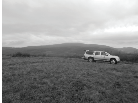
2. ábra. Kaszált élőhely a Sár-hegyen ősszel a kaszálás után.

és 2012-ben vizsgáltuk a kaszálás hatását a faj abundanciájára. A kaszálás és a talajzoológiai monitoring a Bükk Nemzeti Park Igazgatóság koordinálásával és támogatásával valósult meg. A kezelés javarészt gépi kaszálással, évente egy alkalommal, az időjárási viszonyok függvényében ősszel vagy késő nyáron történt. A kezeléseket forgó módszert alkalmazták menedékhelyek és táplálékforrás fenntartása érdekében. 2012–2015 között a Sár-hegyen és Gyöngyössolymoson cserjeirtott (3. ábra), kontroll cserjés, illetve kontroll réteken (lásd. 1–2. ábra)