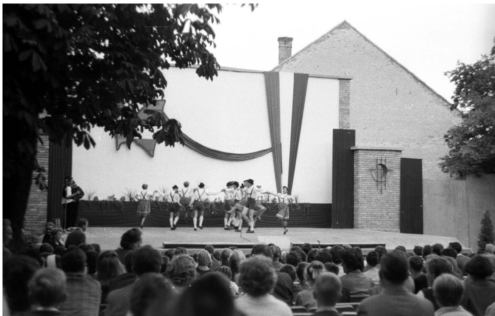
2. kép: Fortepan képkód: 79249

A század első felében különösen erős volt a nemzeti öntudat építése. A nemzeti viselet pedig mind inkább jelképezte az összetartozást és a haza iránti szeretetet. A zászló eredeti jelentősége és rendeltetése, hogy tömegben mindenki lássa hová tartozik. Valahová tartozni, összetartozni a lélek mélységeiben élő szükséglet. S éppen ezért az összetartozás külső kifejezése, a zászló a lélek mélységeiből fakadó szimbólum. A zászló az iskola szellemét szimbolizálja. A zászlótartó kötelessége őrizni a nemzet szellemi alkotásait. Testtartásuk egyenes, tiszteletet sugárzó. Az ehhez hasonló ünnepek nagyon fontosak voltak az iskola életében, mert erősítették a nemzeti öntudatot, valamint a közösséghez való tartozás, az iskolába, mint családba való tartozás érzését. Az iskolai ünnepeken gyakran láthatunk versmondást, drámajátékot, színi előadásokat, táncokat, amelyek illeszkednek az alkalom tematikájához. A következő kép egy ilyen iskolai ünnepet ábrázol.