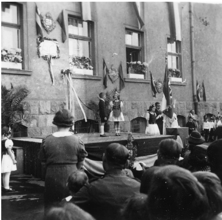
1. kép:

rendezvényként kezelik, azaz a gyerekek számára kijelölik teendőiket. A tartalom zárt, elavult formáságokon alapuló, unalmas, nem veszi kellőképpen figyelembe a gyermek életkori jellemzőit. Ezért is válthat ki ellenérzést, passzivitást a gyermekek körében. A túl lenni rajta szemléletmód, az ünnepi hangulat hiánya miatt a gyerek, a szülők, a pedagógusok talán inkább elszenvedik, mint megélik az ünnepélyeket. A megújulás igénye itt éppen olyan fontos, és szükséges (Baracsi, Hagymásy & Márton, 2009). Az ünnepekkel kapcsolatos társadalmi megítélés folyamatosan változik. Kialakulását nem könnyíti meg, hogy egyes ünnepek az aktuálpolitika színterévé válhatnak. Így az ünneplések jelentősége nagy, hiszen nyílt terepet biztosítanak a politikai tényezők, szimbólumok biztosításának (Szabó, 2006). Az iskolai ünnepélyek azt a nevelőcélt szolgálták, hogy a növendékek összetartását erősítsék, egymás munkájának megbecsülésére szoktassák. Jellemzően a vizsgált időszakban legtöbbször keresztény ünnepek, naptári ünnepek, évfordulóhoz, kiemelt személyek születésnapjához, halálához, névnapjához kapcsolódó ünnepek, politikai eseményekhez és történelmi évfordulókhoz kapcsolódó ünnepek voltak megtartva.