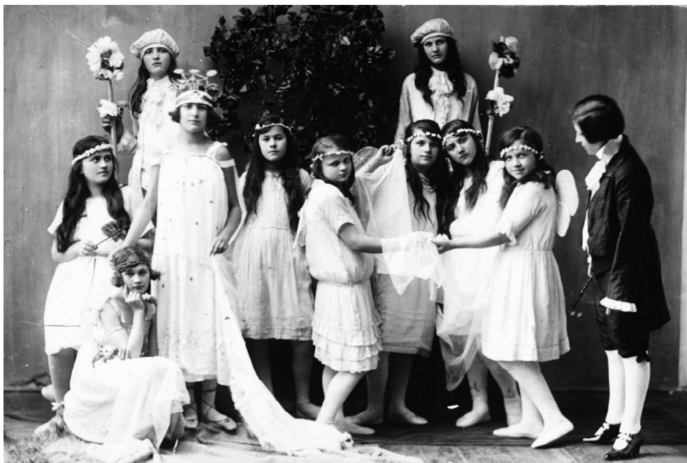
4. kép: Fortepan képkód: 85044

A hagyományos néptáncok mellett a modernebb táncok kitörést jelentettek a kötött táncformákból (Németh, 2013; Boreczky, 2013; Boreczky & Fenyves, 2015; Fenyves, 2016). Az ősiség, a tisztaság és az eredetiség itt is életreform motívumként tekinthető, amely magában foglalja a tánc, a viselet és a szokások romlatlan formáját. A természetben, ez esetben az iskola udvarán eltáncolt jelenetek pedig testesítik a visszavágyódást a természetbe. A kötetlenebb táncformát jól mutatja a fenti kép, amely 1938-ban készült Budapesten a 12. kerületi Új Iskola udvarán. Az iskolai ünnepségen népes közönség vett részt. A táncbemutató fiatal lányok csoportjából áll, akik világos színű, könnyű anyagú ruhát viselnek, fejükön virágkoszorúval. A ruha anyaga és szabása lehetővé teszi a könnyed mozgást. A gyerekek gyakran maguk találták ki az előadás részleteit, a táncokat, mozdulatokat, történetet. Itt is hasonlóra láthatunk példát.