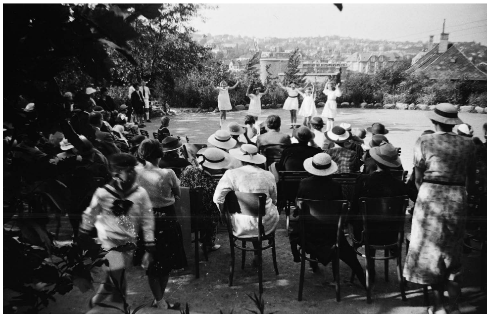
3. kép: képkód: 83949

A tánc tanításának célja, hogy a növendékek könnyed, szép, finom mozdulataikat kifejezésre juttathassák. Az alapállások, tánclépések, karmozdulatok, ritmikus táncmozdulatok után kiemelten fontos a klasszikus és a modern táncok ismerete, elsajátítása. Sokszor saját tervezésű tánckompozíciók előadásával mutatják be a növendékek ügyességüket. A mozdulatokban helyet kap az öröm, a fájdalom, a szabadság, a rabság kifejezése, így a gyermekek kedélyviláguknak és lelki fejlettségüknek megfelelő tartalmat kapnak. A néptánc elsődleges célja a jellemformálás, a kötött táncformák során az utánczásnak fontos szerepe van, ezáltal tartotta életben a test a testtől tanult, testen keresztül átadott tudást. A test mozgása, a testen elhelyezett szimbólumok (jelképek, népi viseletek hímzése) testesítette meg az adott kultúra szimbólumait (Németh, 2013; Boreczky, 2013; Boreczky & Fenyves, 2015; Fenyves, 2016).