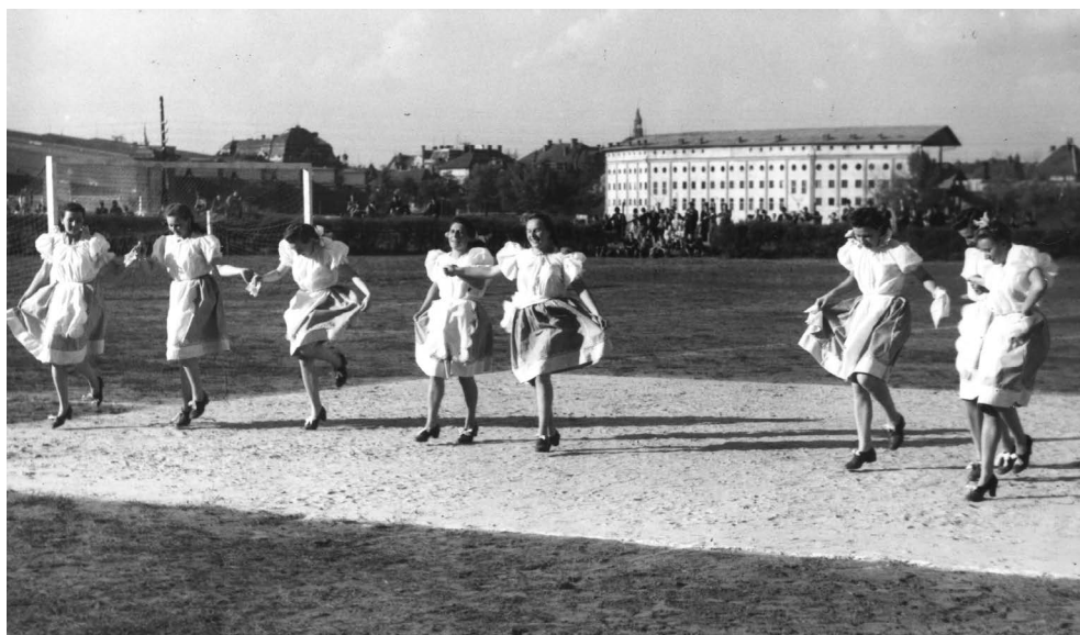
5. kép:

kilépni a konvenciókból, és szabadon mozogni, táncolni, kötetlenebbül játszani. A 20-as években a nők helyzete sokat változott, az emancipációs törekvések elértek az iskola intézményének falain belülre is, és ennek hatását legjobban a táncokban, színdarabokban figyelhetjük meg a fényképek által. Mindez abból látható, hogy az 1900-as évek elején sokkal több hagyományos táncot bemutató kép jelent meg, míg később, a 30-as években egyre több színdarabról, modern, reform táncról készült fénykép is bekerült az iskolai értesítőkbe, iskolai albumokba. A táncok tartást és kifinomult mozgást adtak a leányoknak, amely elősegítette a kor vonzó testképének alakulását. A táncos alkalmak rituális események voltak a leányok életében, ekkor léphettek ki az addigi szerepükből és válhattak hölgyekké, akik párjukat keresik.