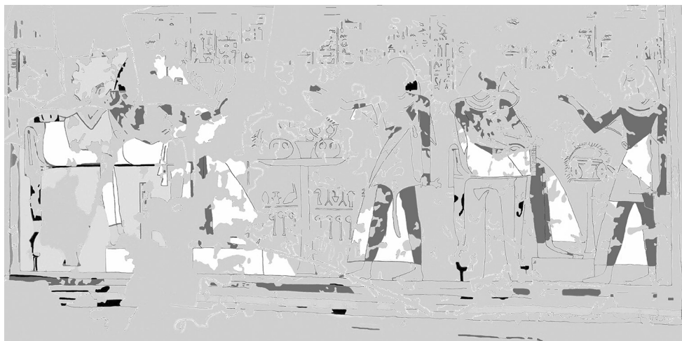
2. kép. A Dzseshutimeszt áldozó személyként ábrázoló jelenetek rajza

és részletmegoldásokat tartalmaz, ám mégsem azonos. Azt feltételezhetjük, hogy a művész több vázlatot is készített, és ezek egyike lehetett az osztrakonon látható rajz. Mégsem ezt a vázlatot dolgozta ki végül a sziklás falának festményén, hanem egy másikat. Ezt a változatot, az ásás során a közelben megtalált osztrakont pedig, mivel nem volt rá további szükség, eldobták.