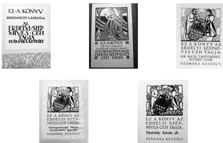
1. ábra. Az ESZC ex librisei

Az ESZC három különböző típusú ex librist tervezett amatőr könyveihez. (1. ábra). Az első két sorozatban egyszerű, kisméretű fehér 9×9, majd 6,5×6,5 cm-es lapon olvasható a pártolótag neve. A III. sorozat ex librisét Debreczeni László (1903–1986) grafikusművész szép szecessziós rajza díszíti. Méreténél fogva (16×10 cm) kisgrafikának is tekinthető. A IV. sorozattól Kós Károly kétalakos, színes ex librise került a könyvekbe. Színe kezdetben okkersárga, a VIII. sorozattól kék színű. A pártolótag nevét rányomtatták az ex librisre, de néhány esetben írógéppel készült, elsősorban az ajándékba adott, tagsággal nem rendelkezők számára.