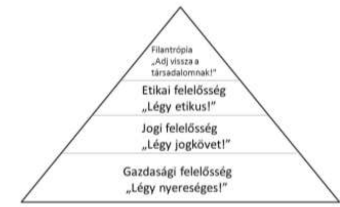
1. ábra. CSR piramis

A CSR-piramis (1. ábra) szemlélteti a felelősség különböző rétegeit. Az alapot a gazdasági felelősség jelenti. Ezzel egy időben a vállalatoknak meg kell felelniük a jogi normáknak. Az etikai felelősség alapvető szintje a helyes, igazságos, tisztességes viselkedés kötelezettsége, és túlmutat a jogszabályoknak való megfelelésen. Ezeken felül jelenhet meg a diszkrecionális vagy jótekonysági felelősség (Carroll, 1991).