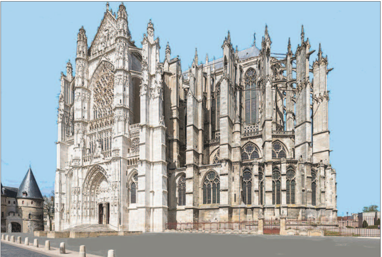
3. ábra. A székesegyház délről