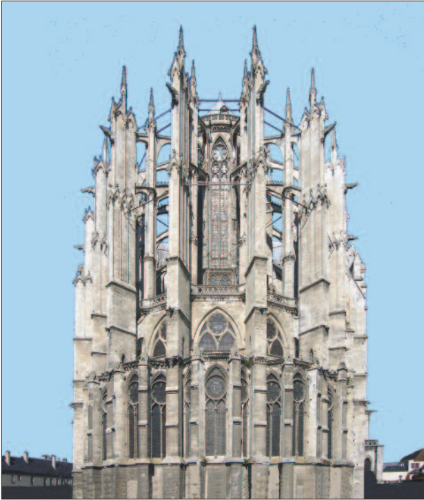
2. ábra. A támpillérekkel övezett szentély