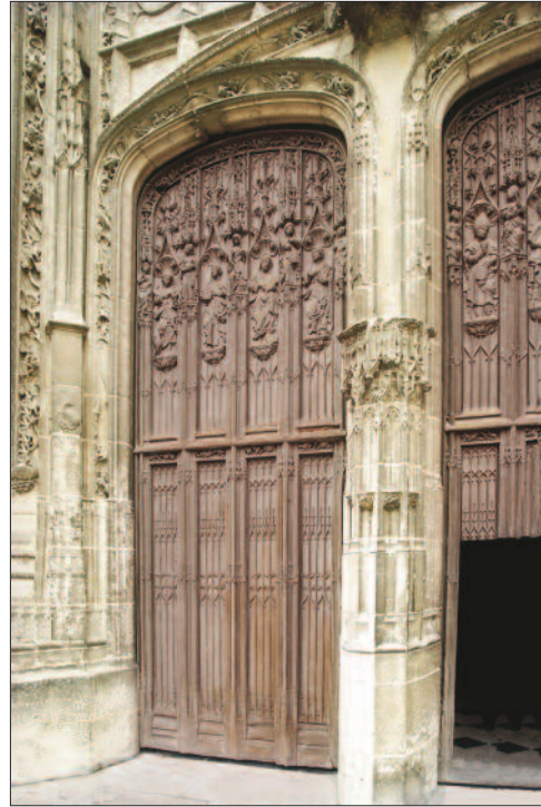
4. ábra. A déli kapu