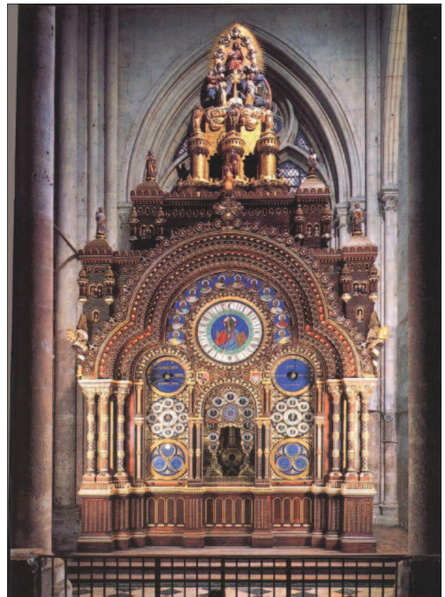
8. ábra. Az asztronómiai óra