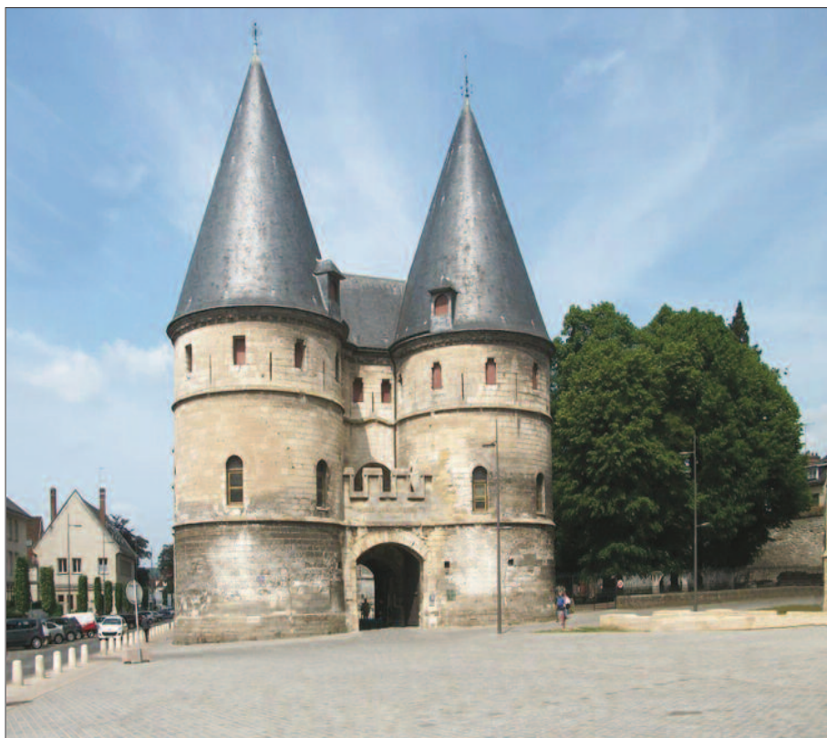
9. ábra. A püspöki palota bejárata