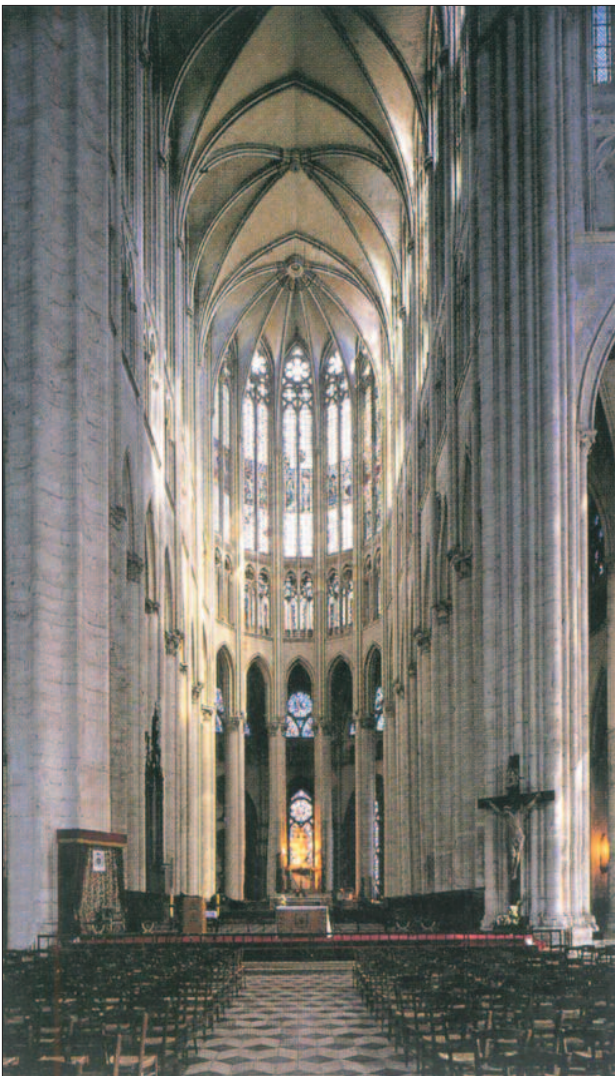
6. ábra. A székesegyház belseje