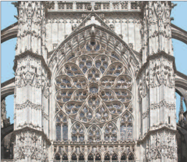
5. ábra. A déli oldalhomlokzat rózsablaka