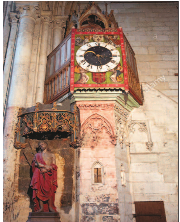
7. ábra. A középkori óra