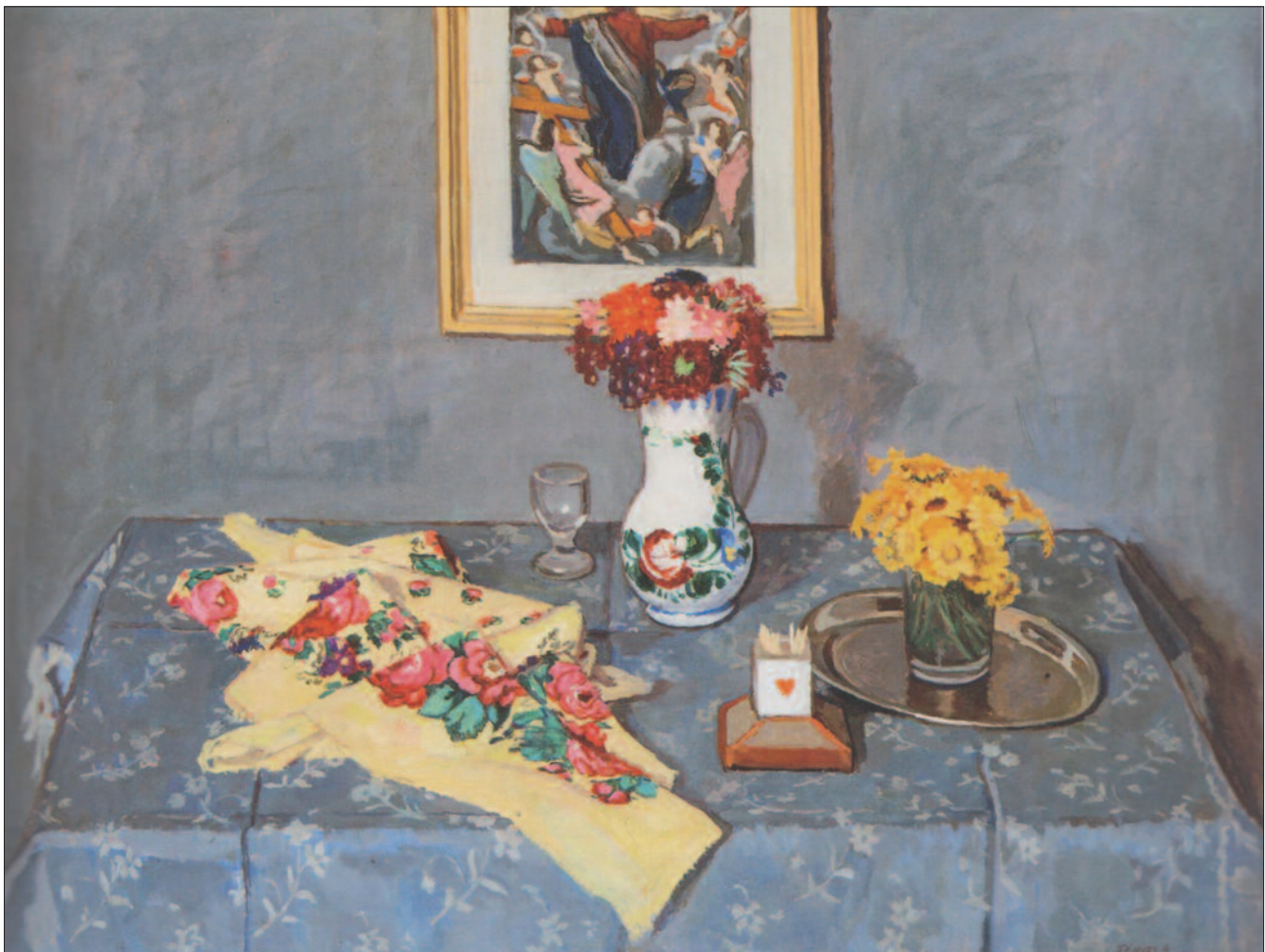
29. kép. Virágos kendő, 1910 körül