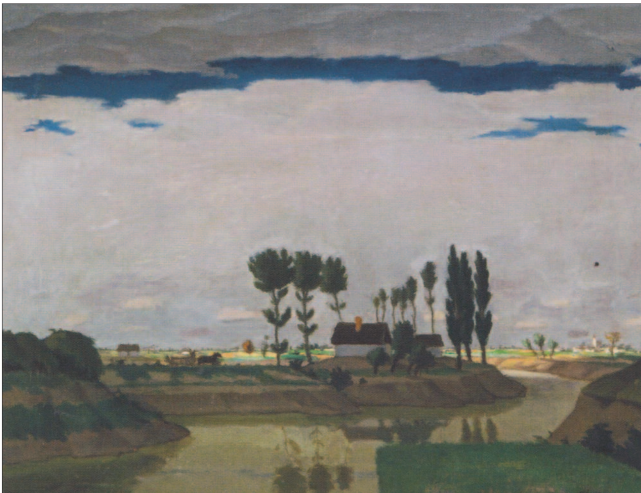
43. kép. Magányos tanya, 1920

szebb, mint a valóság, mert a természet sok elszórt szépsége egy-egy alig négyzetméteres vászonra van koncentrálnva, amint azokat megkonstruálta egy teremtő fantáziával megáldott poétalélek, aki az élet benyomásai fölött szuverén rendelkezik, formálja, alakítja, fokozza, egyszerűsíti őket, úgy, ahogy azt képzelete eljátszatja véle. Micsoda báj lebeg ez álmovilág felett” (14) (43. kép).