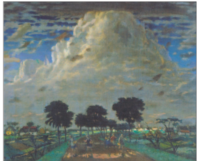
41. kép. Mesebeli táj, 1920-as évek

„Képeinek szimmetriába szerveződő kimért geometrikus formavilága hol az új tárgyiassághoz közelítő neoklasszicista megfogalmazással párosul, hol pedig a naív művészet leegyszerűsítő gesztusai jellemzik. Óriási horizontú keskeny szántóföldjei fölé gyakorta barokkosan kavargó, olykor fenyegetően sötét égbolt nehezedik” (3). (41., 42. kép).