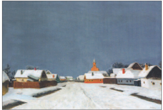
48. kép. Havas utcácskéslet, 1920-as évek