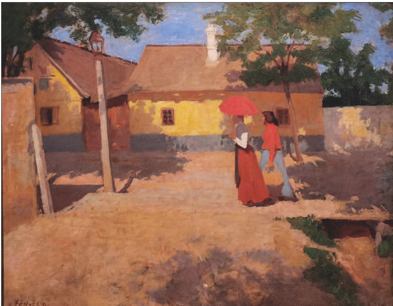
17. kép. Kisvárosi délelőtt, 1904

fényt visszaverő fehérek és sárgák intenzív ereje látványosan érvényesül.” (3).