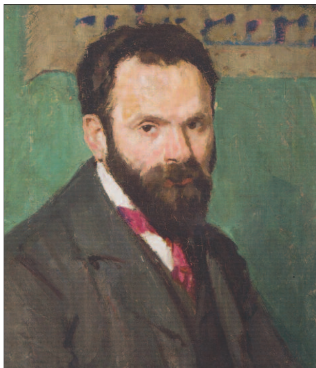
33. kép. Vedres Márk arcképe, 1907 körül