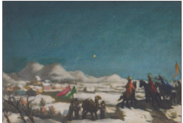
36. kép. Betlehemi csillag, 1915 körül

század első évtizedében születtek a templomokat, kastélyokat és múzeumi belső tereket ábrázoló festményei is (38., 39., 40. kép). A bibliai témákat és művészettörténeti előképeket is megidéző témaváltás „már előre-