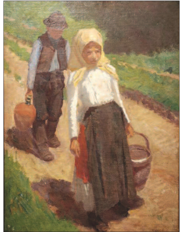
11. kép. Hazatérő testvérek, 1903