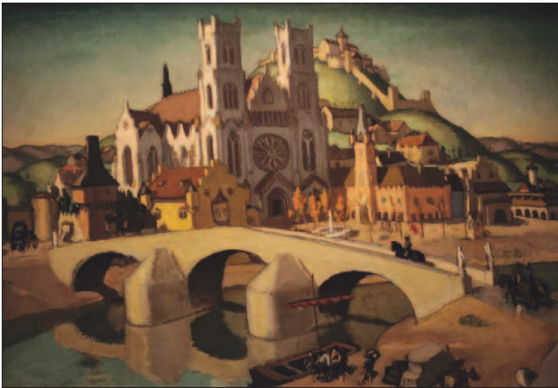
45. kép. Régi város, 1914