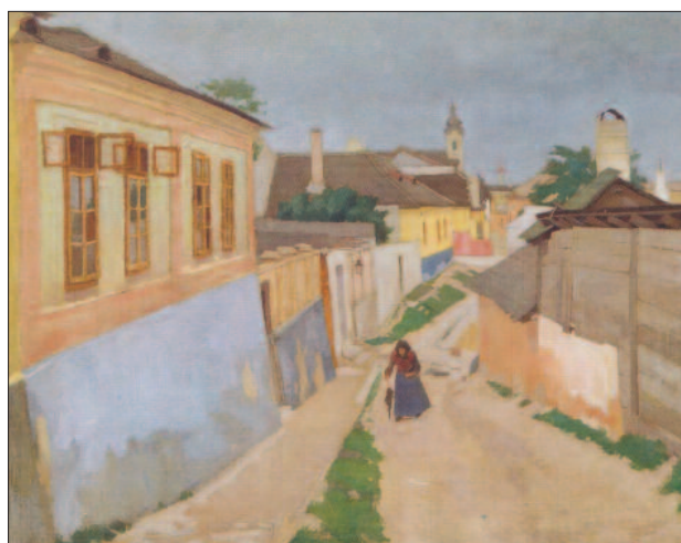
18. kép. Kisvárosi utca, 1904

„A szabadban készült széles ecsetvonásokkal összefüggő színfoltokkal fogalmazott életképi jeleneteken a tiszta, keveretlen színek sugárzása, az erős nap-