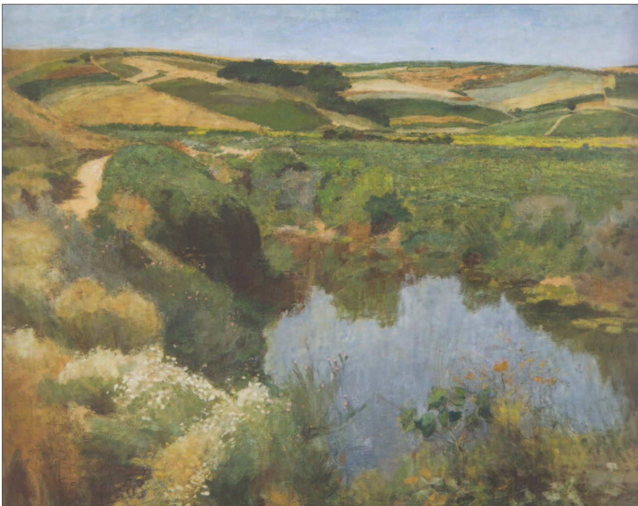
21. kép. Vasárnap csendje a földeken, 1902, Salgótarján

A napfényes korszak képeinek jellegzetessége a fény és az árnyék játéka. A napsütésben fürdő utcák, terek, udvarok fényét házak, fák árnyékolják. A falusi nyár légkörének ábrázolása elbűvölő (15., 16., 17. kép). A kisvárosi és falusi utcák csendje, varázsa különös erővel jelenik meg a Kisvárosi utca (18. kép) és a Napsütötte utca gyerekekkel (19. kép) című festményeken. A Téli verőfény (20. kép) vásznán a fehér és a barna szín uralkodik. A behavazott utcák, háztetők, a barna kerítés mellett álló, kucsmát viselő parasztember, a kisé elmosódott kontúrok, a bágyadt téli napfény igazi téli életérzést közvetítenek. A Vasárnap csendje a földeken című képén a táj növényzete változatos színekben jelenik meg, a zöldek különböző árnyalata, a sárgult bokrok, fehér virágok, a parányi tó kékjében tükröződő cserje, a távolban a szántóföldek és a felhőtlen kék ég ölelkezése csendet, nyugalmat, békét, a természet szépségeit sugározza (21. kép). Fényes gyakran