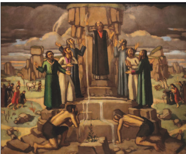
35. kép. Mózes vizet fakaszt a sziklából, 1914

Az 1918-ban megrendezett gyűjteményes kiállításra meglepte a látogatókat. A modern élet egykori krónikása összesen 12, nagyszabású jelenetet festett az Ó- és Újszövetségből. Ezek közé tartozik többek között a Mózes vizet fakaszt a sziklából (35. kép), a Betlehemi csillag (36. kép) és a Levétel a keresztről (37. kép). A