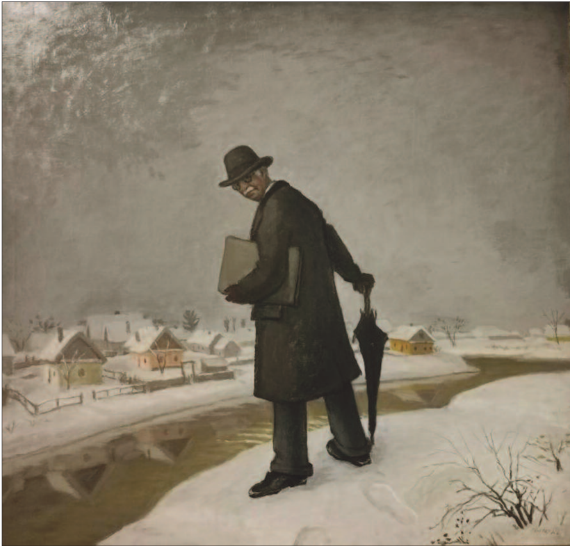
49. kép. Öreg festő téli tájban