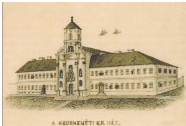
2. kép. A kecskeméti piarista épületegyüttes a régi gimnáziumi szárnyal, 1877

„Élénk figyelemmel kísérte a kortársi tendenciákat, de festészetében nyomot hagyott a művészettörténeti korszakok és a klasszikus mesterek beható ismerete is (1).”