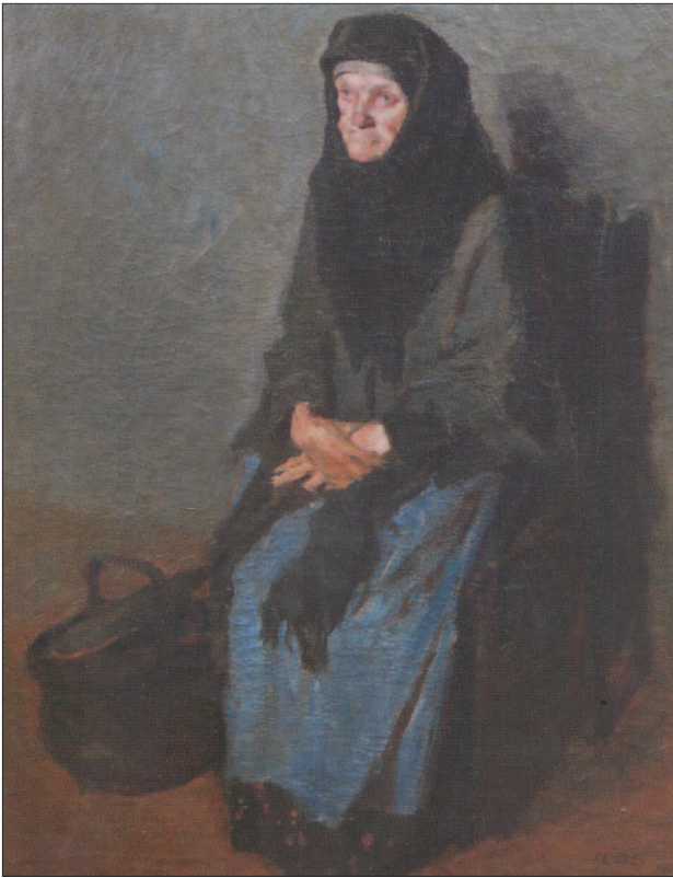
4. kép. Öregasszony, 1902