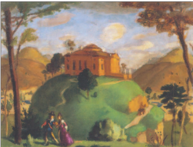
47. kép. A villa, 1918

egyaránt, a művész lelkéből fakad. „Hunyd be testi szemedet, hogy először lelki szemeddel lásd meg a képedet. Aztán hozd napvilágra, amit a sötétben láttál, hogy kívülről befelé, visszahasson másokra.” – idézi