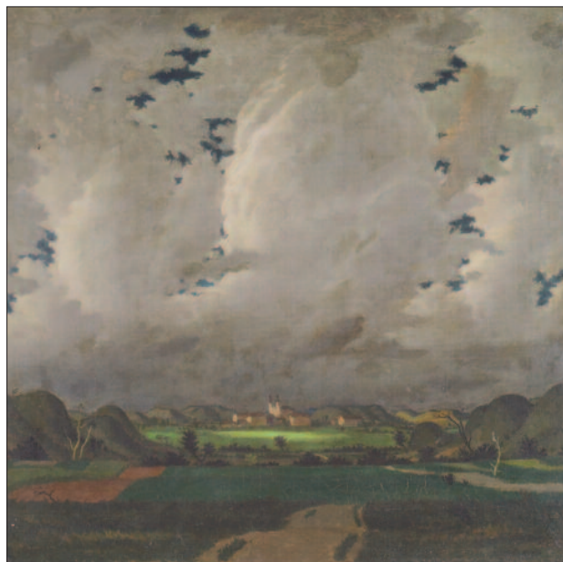
44. kép. Bujkáló nap, 1923

Fényes ebben a festői korszakában középkori életképeket, regyszerű jeleneteket is vászonra álmódott (45., 46., 47. kép). Képei a csöndes regeszövéés óráiban születtek, különböző hangulatok sugallatára. Meseszerűvé varázsolja a téli alföldi tájat, egymáshoz bűvő, behavazott kis házakkal, amelyekre sötétkék ég tekint (48. kép). A művészi alkotások festmény és költemény