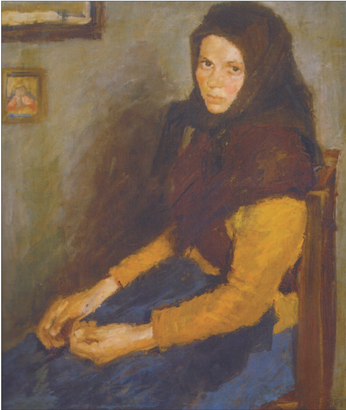
8. kép. Kendős kislány kötényben, 1905 körül

Az Anya és gyermek című 1901-ben készült festmény megrázó erővel fejezi ki a szegénység kiszolgáltatottságát (3. kép). A sötét háttérből alig emelkedik ki a feketeruhás, kendővel fedett mezítlbas anya, amint ölébe ültetve szorítja magához kisfiát. Az anya óvóvédő karja a mozdulatból áradó szeretet, félelem drámai hatását. A kép érzelmileg hat ránk, a fájdalom, a nyomor, a kilátástalanság művészi ábrázolásával.