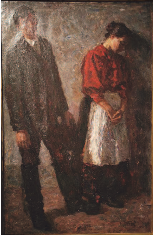
9. kép. Duzzogók, 1898