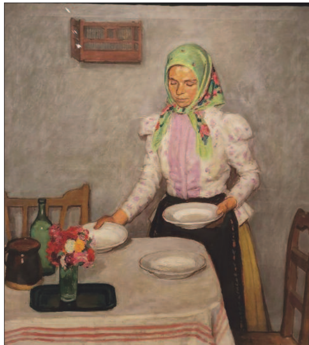
27. kép. Terítés, 1908

A Látogatás című képen az asztal körül, támlás karos padon két asszony beszélget. Egyikük jellegzetes szolnoki, hátulkötös vállkendőt visel (25. kép). A piros csíkkal díszített, házi szőttés terítővel letakart asztalon kancsó és a szép és okos arcú háziasszony kezében tányér, süteménnyel. A színek lágyak, finomak, a ho-