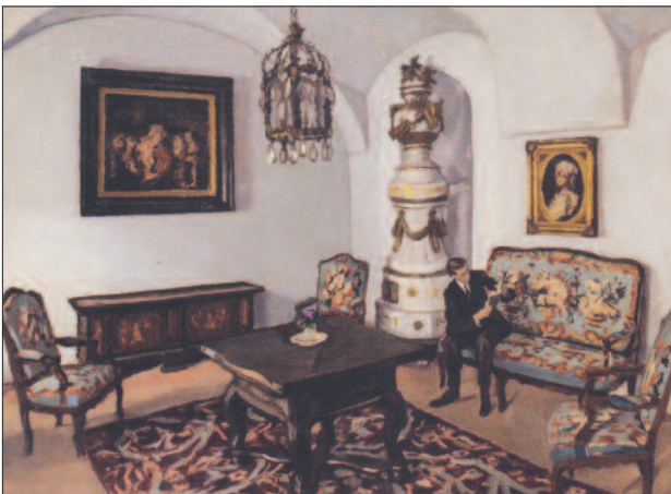
39. kép. A kiscelli kastély (Múzeumbelső), 1913