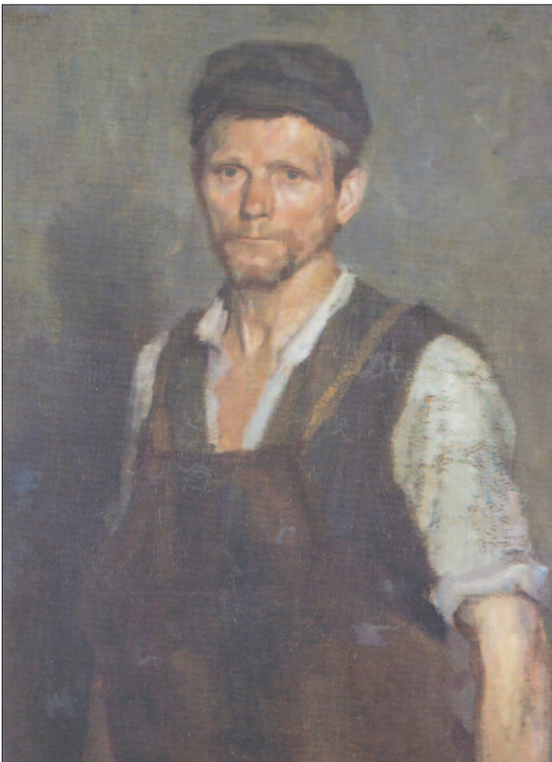
5. kép. Bőrkötényes munkás, 1901