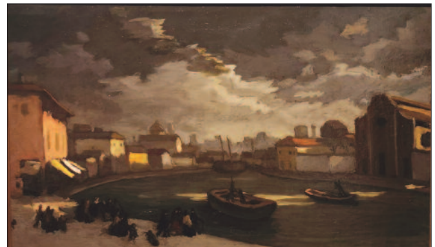
42. kép. Nyugtalan idő, 1919

Lázár Béla írta: „Egei a legszebb felhőalakulatok, melyeket megálmodott valaha természetkedvelő költő,