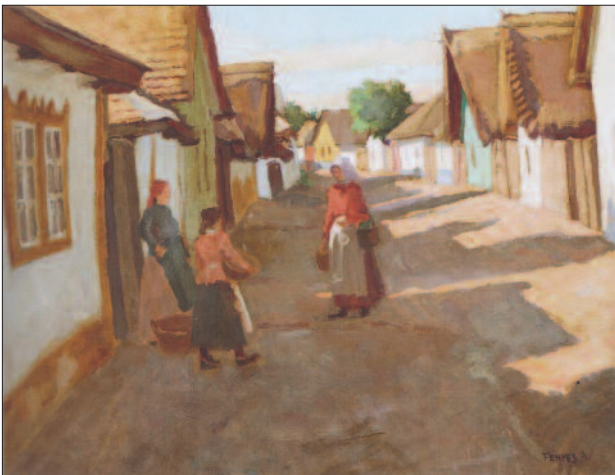
15. kép. Falusi utca, 1905

fel, képein sima felületekkel, erős színfoltokkal (3). Számos műve az alföldi táj varázsát tükrözi, rajzos elemekkel, fényekkel átítatott színekkel. A szabadban festett képein a plain air fényhatások érvényesültek, vilá-