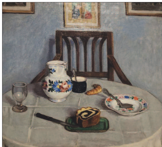
28. kép. Mákoskalács, 1910