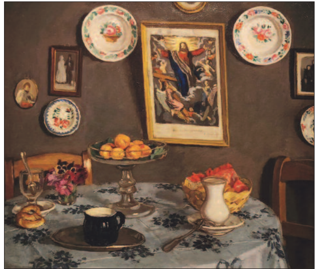
30. kép. Vasárnap délután, 1910 körül

hogyan olyan világ jelenik itt meg, amelyet tisztaság, rend és harmónia jellemez.” (11).