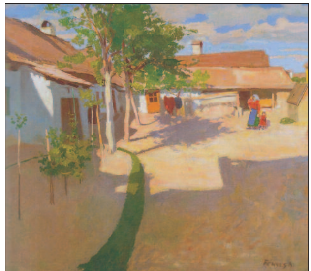
16. kép. Udvaron, 1905