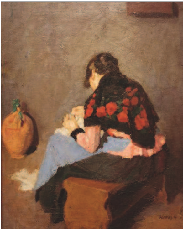
10. kép. Varró parasztlány, 1905 körül