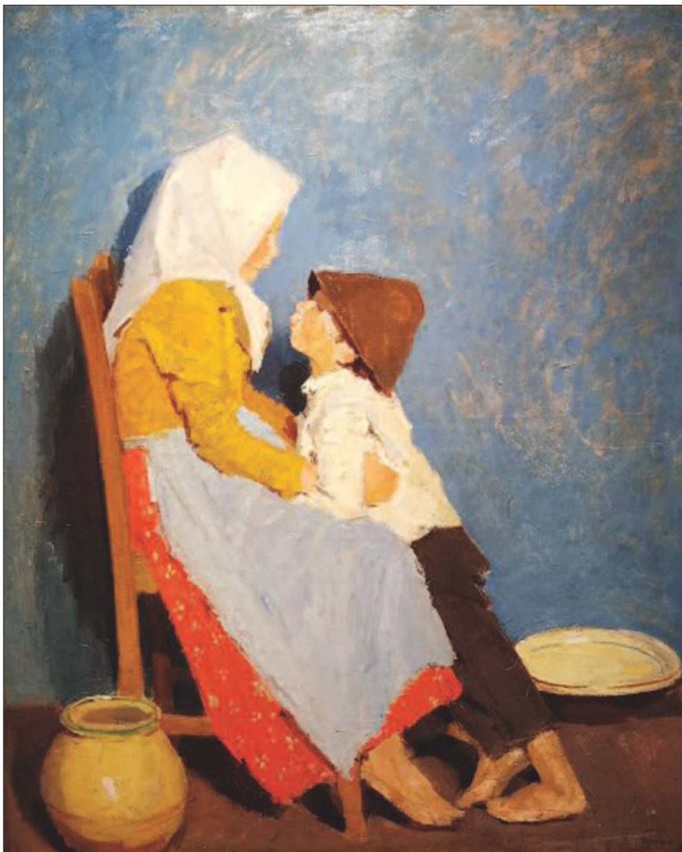
13. kép. Testvérek, 1906

A Kendős kislány kék kötényben döbbenetes erejű alkotás. Szép arcú, szomorú tekintetű kislány ül a széken, kezét ölében tartva néz ránk. Fejét fekete kendő fedi, amely mellkasán keresztbe fonva végződik. Talán a szép arc, a gyönyörű barna szemek, az azokból áradó finomság és melegség oldottá, nyugodttá teszi a képet. Ebben segít a világosabb háttér, a falon megjelenő két kép, a ruha szép sárga színe, és a kötény kékje. Megrázóan szép alkotás (8. kép). A Duzzogók a szegény emberek élete sorozat kivételes darabjai közé tartozik (9. kép). Fényes életképet fest, amelyen a megbántott leány elfordul a fiútól, aki tanácstalanul, arcán a megbánás szándékával kísérel meg a békesség helyreállítását. A kép háttere immár nem sötét, a leány piros blúza, kö-