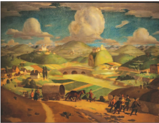
46. kép. Májusi táj (Vonuló katonák), 1919

egyaránt, a művész lelkéből fakad. „Hunyd be testi szemedet, hogy először lelki szemeddel lásd meg a képedet. Aztán hozd napvilágra, amit a sötétben láttál, hogy kívülről befelé, visszahasson másokra.” – idézi