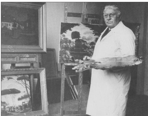
1. kép. Fényes Adolf a műtermében, 1929

A Nemzeti Galéria Fényes Adolf festőművész alkotásaiból kamarakiállítást rendezett „A csend képei” címmel a mester halálának 80. évfordulójára emlékezve. Fényes Adolf (születési nevén Fishmann Adolf) Kecskeméten született 1867-ben és Budapesten halt meg 1945-ben (1. kép).