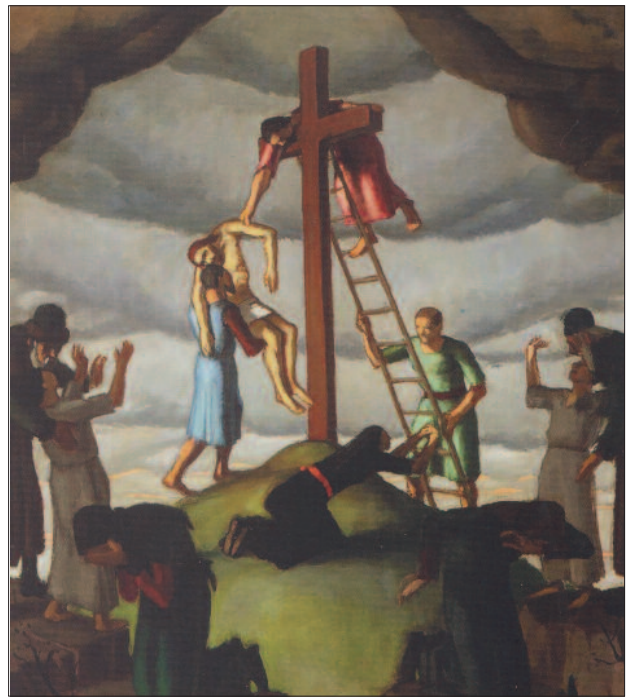
37. kép. Levétel a keresztről, 1916

század első évtizedében születtek a templomokat, kastélyokat és múzeumi belső tereket ábrázoló festményei is (38., 39., 40. kép). A bibliai témákat és művészettörténeti előképeket is megidéző témaváltás „már előre-