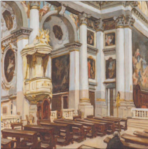
38. kép. Velencei barok-templom (San Pantaleone), 1909