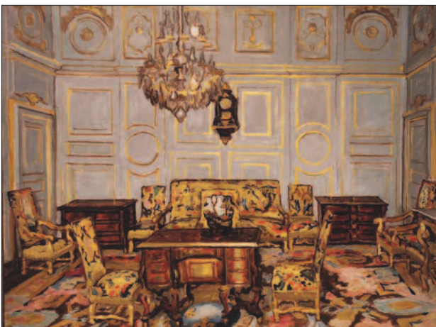
40. kép. Fontaineblau, 1911

jogához jut, minden megtalálja a maga ellentétjét, szín és forma sajátos kapcsolatokba kerül és különvált életet él... A szemlélő joga kijelenti, bele tudja-e magát élni a művész világláttatásába? A művész joga mindezenre kétségtelen ahhoz, hogy a maga álmainak formát teremtsen. Ezt tette Fényes Adolf. Ilyen az igazi, a szuverén művész élete.” (13).