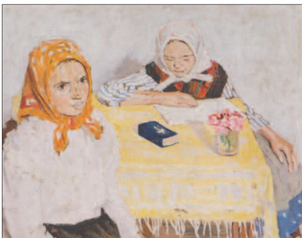
26. kép. Vasárnap délután, 1909 körül

Olyan világot tárt elénk, amelyből az egyszerűség békéje árad. A csendéletek varázsát a mindennapi környezet, az ismerős tárgyak, a falakon családi fényképek, terítővel letakart asztal, edények, virágok, gyümölcsök adják, amelyeket támlás karos pad, lécvázás keményfa székek vesznek körül. A világos színekkel megfestett szobabelsőkben az ünnepi pillanatok a szépen megterített asztal körül ülő asszonyok színes