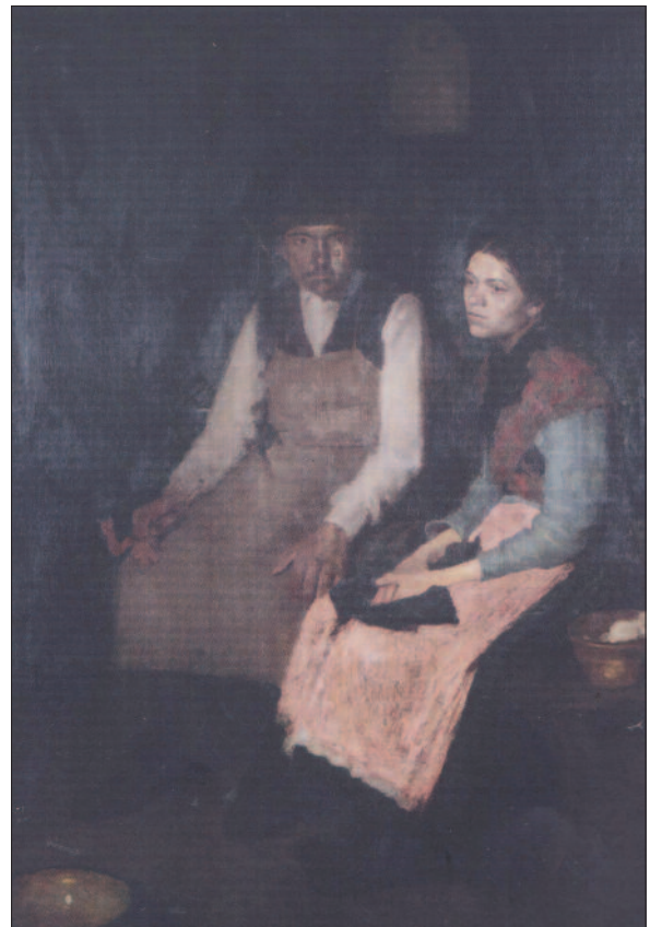
7. kép. Csendes boldogság, 1904