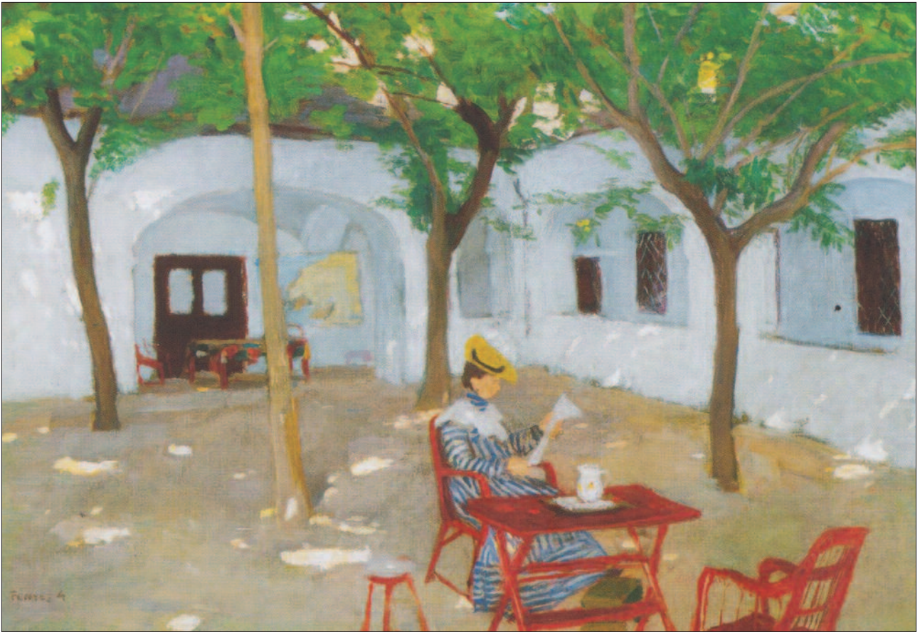
14. kép. Udvaron olvasó nő, 1907 körül

zelés már a festő új, a napfényes korszakának irányába mutat, impresszionista hangulati elemekkel (12. kép).