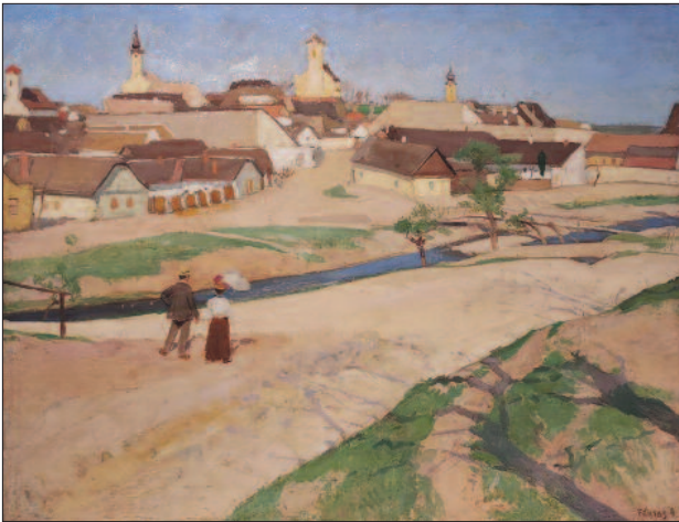
22. kép. Szentendrei táj, 1907-1908

megfordult Vácott és Szentendrén is. Szentendre hangulata különösen megragadta, idilli, világos, visszafogott képek festésére ihlette (22., 23. kép).