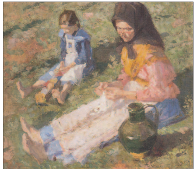
12. kép. Domboldal, 1903

összekulcsolva az ölében tartja, mintegy jelezve az elvégzett munka utáni várakozás feszültségét. A fehéringes, bőrkötényes, kalapos férfi is a távolba néz, várva a boldogulás lehetőségét. A csend és a nyugalom látszólagos, inkább a beletörődés, a feszültség feloldódása, és a sorsuk elfogadásának a kényszere sugárzik az alkotásból.