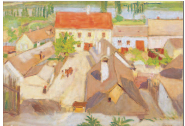
23. kép. Szentendrei háztetők, 1907-1908

megfordult Vácott és Szentendrén is. Szentendre hangulata különösen megragadta, idilli, világos, visszafogott képek festésére ihlette (22., 23. kép).