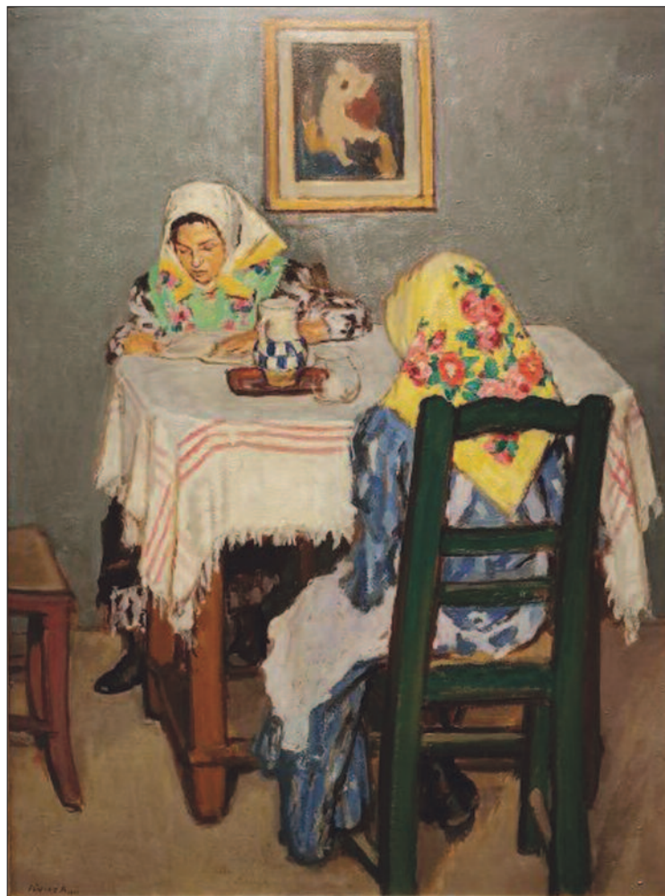
24. kép. Ünnepnep, 1909

Fényes napfényes korszakához sorolják azt az időszakot is, amelyben festményeinek témája jelentősen változott. A század első évtizedének második felében nem az alföldi táj, a kisvárosi utcák hangulata kötötte