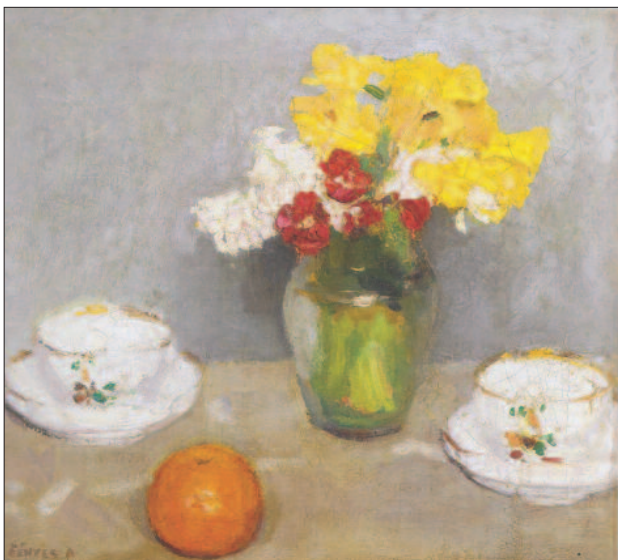
31. kép. Virágcsendélet csészékkel, 1907 körül

A Virágos kendő című képen valóságos színorgia jelenik meg (29. kép). A kék fehér virágmintás terítővel letakart asztalon sárga alapon színes rózsás kasmirkendő látható, amely visszaköszön a virágcsokor sárgájával. Az asztalon mázas, változatos színekben pompázó virágmintájú cserépkancsó. A kép színvilága megéjtően szép, hangulata békét, kiegyensúlyozottságot sugároz. A Vasárnap délután a paraszti enteriőrök szinte összes kellékét bemutatja. A tárgyak, a színek tobzódása, a vasárnapi ünnepi asztal dús terítése, a szobabelsők jellegzetességeit foglalja össze (30. kép). A Virágcsendélet csészékkel színei sugárzóak (31. kép). A zöld mázas vázában dús virágcsokor, amelyben a sárga szín uralja a képet, mellette a fehér és a vörös színű virágok finom kontrasztot adnak.