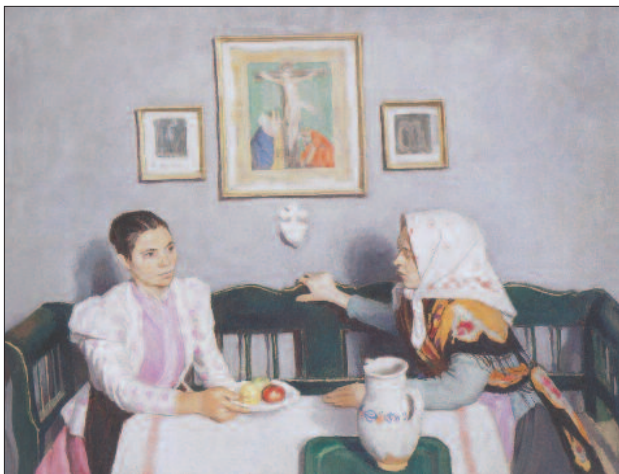
25. kép. Látogatás, 1907

„Csendéletei érdekesen mutatják, hogy miképpen dolgozta fel magában Cézanne hatásait. Az anyagot keresi; annak szilárdságát vagy lágyágát, pórusaiból kiáramló melegét majdnem erotikus túlzással érzékelteti. Az asztalra vetett terítő selyme, a porcelán keménysége, a játékló festett fájának szálkája meggyőző erővel, közvetlenséggel él vásznain. „ (10).