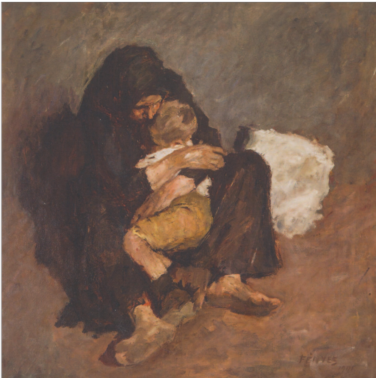
3. kép. Anya és gyermeke, 1901

nik meg, széles ecsetvonásokkal, indulatos, súlyos vastag festékréteggel. „Fényes szülőföldje paraszti és parasztpolgári életformájának mindennapjait, tárgyi emlékeit emelte művészi rangra (3).