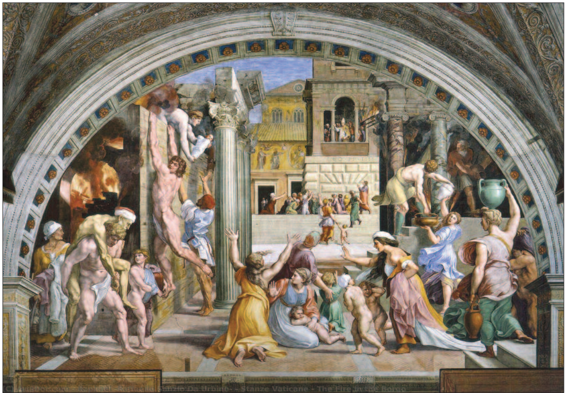
2. ábra. A Borgo égése