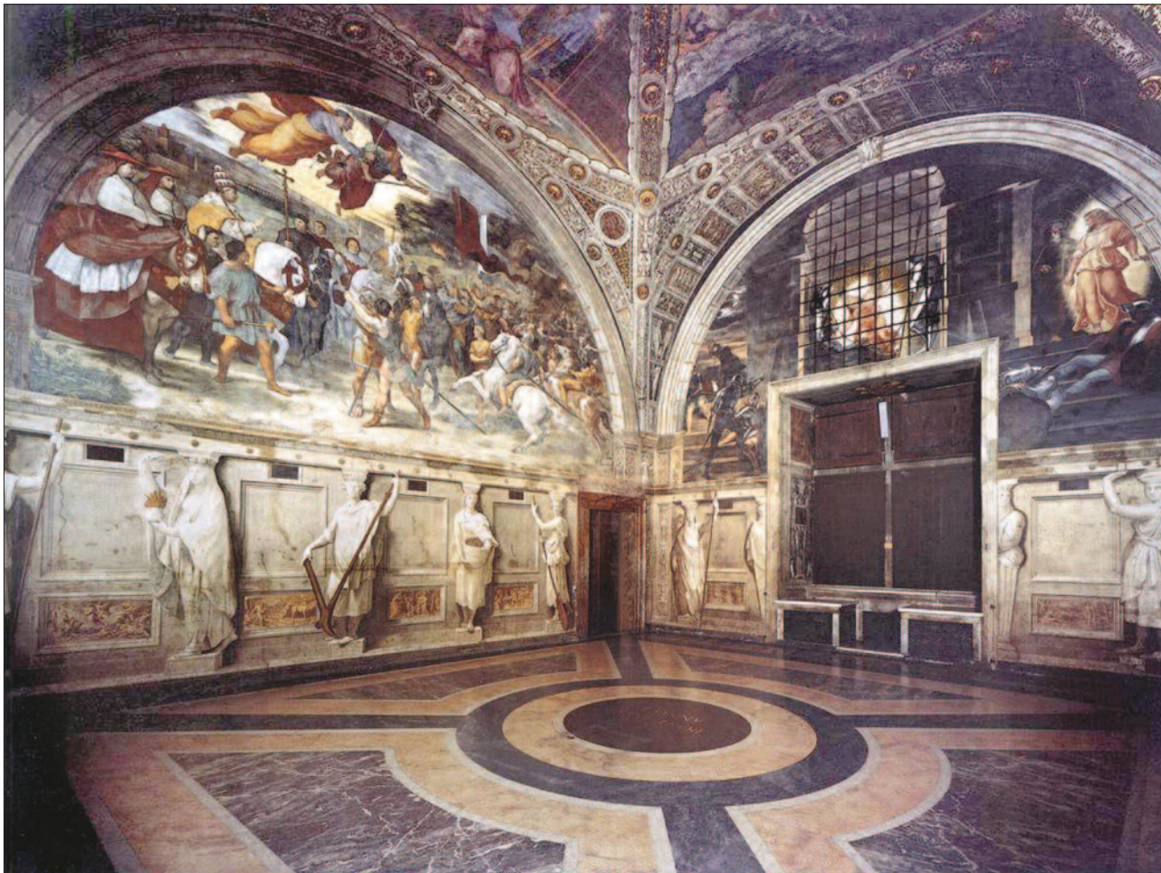
6. ábra. Héliodorosz kiűzése

Napoleon idejében a francia megszállók, miután a mozdítható, értékesebb műtárgyakat elrabolták, le akarták választani a falról a freskókat, hogy azokat a Louvre-ba szállítsák, de – szerencsére – ez technikailag megoldhatatlannak bizonyult. Ma is eredeti helyén csodálhatjuk meg Raffaello stanzáit.