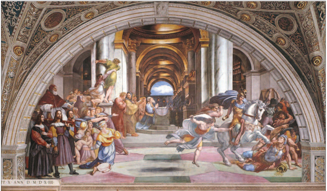
7. ábra. Héliodorosz terme