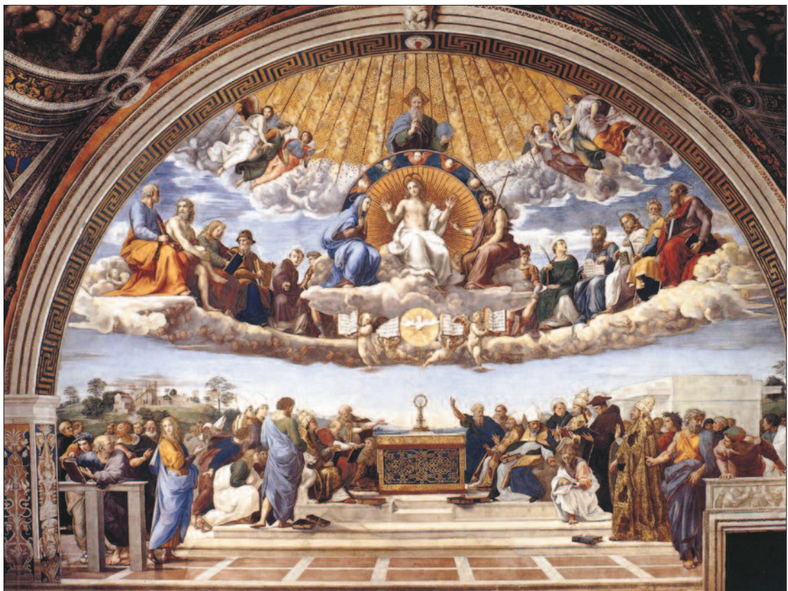
3. ábra. A Disputa