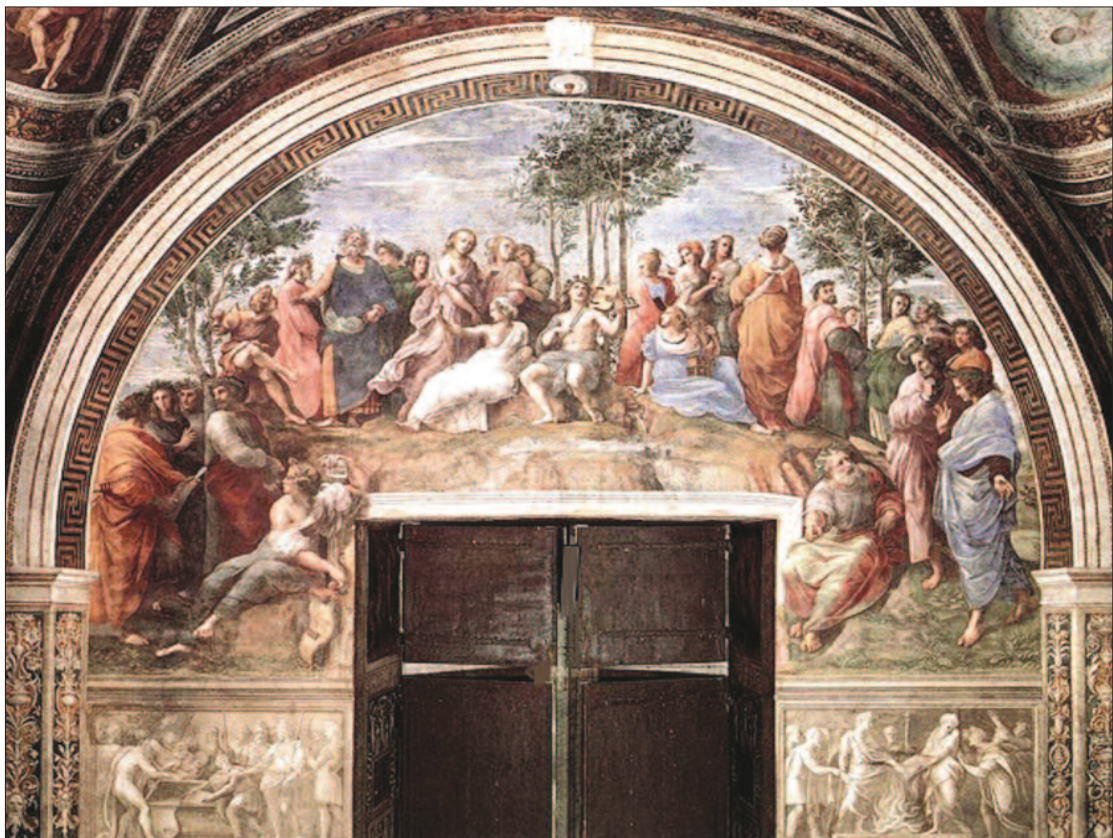
5. ábra. A Parnasszus