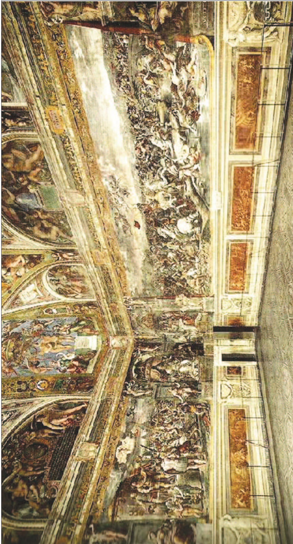
9. ábra. Csata a Milvius-hídnál