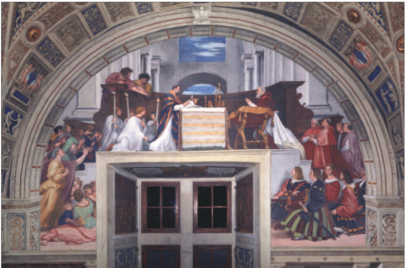
8. ábra. A bolsenai mise