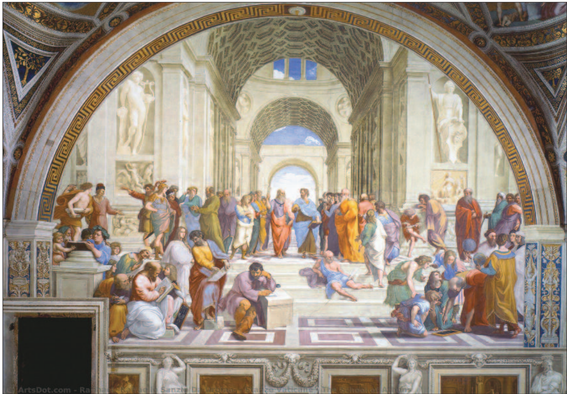
4. ábra. Az Athéni iskola