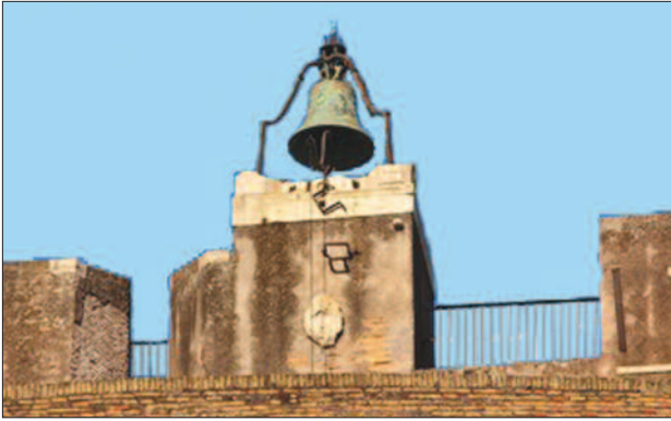
4. ábra. A Campana della Misericordia

X. János pápa, Marozia patríciusnő, Stefano Porcaro patrícius, Alessandro Farnese (a későbbi III. Pál pápa), Giordano Bruno filozófus, Lorenzo Ricci jezsuita rendfőnök, Cagliostro gróf (Giuseppe Balsamo), Beatrice Cenci és több bíboros (G. M. Vitelleschi, G. B. Orsini, G. Morone, Carlo Carafa és Alfonso Carafa). A vár terasza a helyszíne G. Puccini: Tosca című, 1800-ban játszódó operája III. felvonásának.