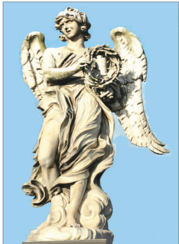
7. ábra. A töviskoszorút tartó angyalszobor

Krutsay M: A Sant'Andrea delle Fratte. Immunol Szle 2021; 13: (1) 53-55.