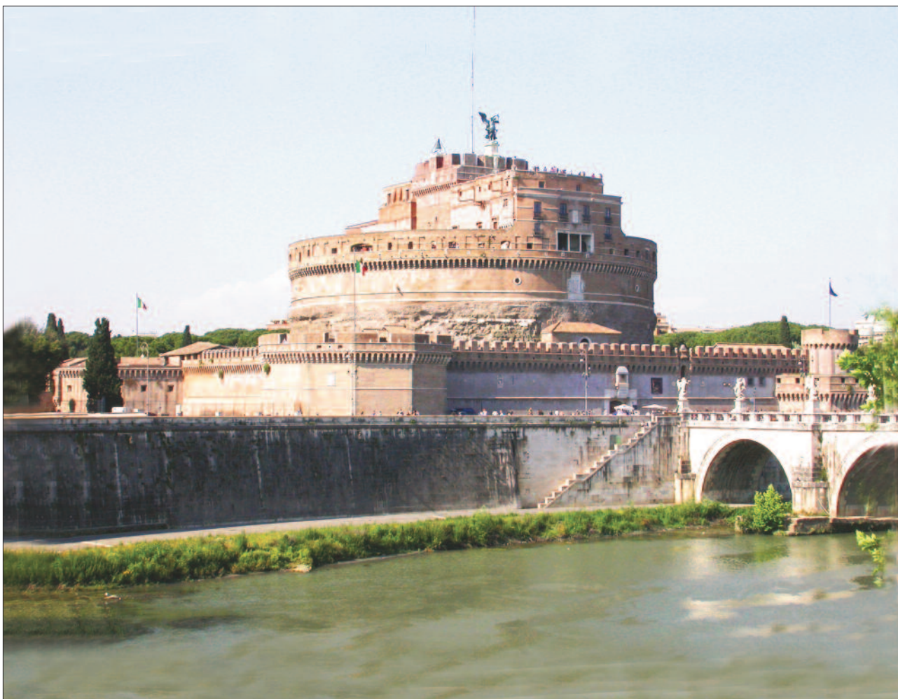
1. ábra. Az Angyalvár és az Angyalhíd

A várat 89 m oldalhosszúságú, négyzet alakú, középkori fal veszi körül, négy sarkán egy-egy, VI. Sándor pápa idejében épült sokszögletű bástyával, amelyeket a négy evangelistáról neveztek el. Valaha ötszögű, külső fal is övezte, sarkain „új-olasz” fülesbástyákkal. Ma a külső védővonalat utak rajzolják ki a környező parkban ( 2. ábra ). A szűk várudvar közepén emelkedik a hajdani mauzóleum téglából rakott, 64 m átmérőjű, hengeres tömbje, amely egykor márvánnyal volt borítva és szobrok, oszlopok díszítették. A folyóra né-