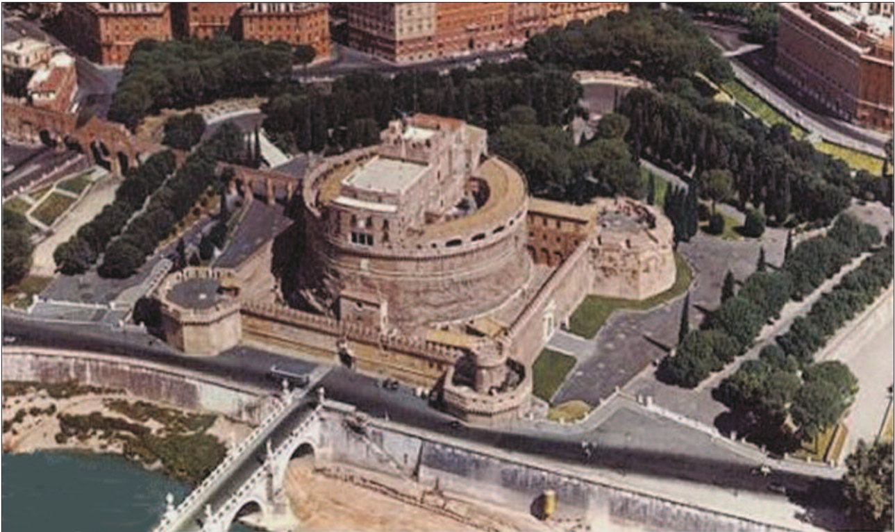
2. ábra. Az Angyalvár és környéke (légi felvétel). Balról a Passetto, alul az Angyalhíd részlete

ző bejárattól csigavonalas rámpa vezet a falban a tömb közepében lévő, négyzet alaprajzú terembe. Ebben őrizték a császárok hamvait tartalmazó urnákat Hadriánustól Caracalláig. A szomszédos helyiségekben tárolták a későbbiekben az élelmiszertartalékként szolgáló gabonát és olajat (mintegy 220 hl-t). A mauzóleum tetejét eredetileg – Augustus mauzóleumához hasonlóan – földdel borították és fákkal ültették be. Ezen mesterséges domb helyén alakították ki később a felső várudvart, közepén ÉD-irányban, átlósan húzódó, háromszintes épülettel. Ennek legalsó szintjén, a középső, négyszögű teremben valaha bíróság ülésezett, az e feletti kerek teremben pedig a pápai kincstárat és titkos levéltárat őrizték. Még ma is láthatók itt a hatalmas kincsesládák. Ezen a két szinten helyezkedik el az V. Miklós és III. Pál idejében készült, freskókkal díszített pápai lakosztály is. A legfelső szint középső, kör alakú helyisége börtön volt. Felette a teraszról szép kilátás nyílik a városra. Itt áll 33 m magasan Szt. Mihály bronzszobra, P. van Verschaffelt műve, amely 1753-ban került kőből faragott elődje helyére (3. ábra). A közelében függő lélekharangot (Campana della Misericordia, 4. ábra) kivégzések esetén szólaltatták meg. Börtöncellák mindegyik szinten található, többnyire a kör alakú, külső fal mentén sorakozva. A várudvar alatti sötét, nyirkos, bűzös börtönök gyötrelmeiről Benvenuto Cellini adott leírást önéletrajzában. A várban – az