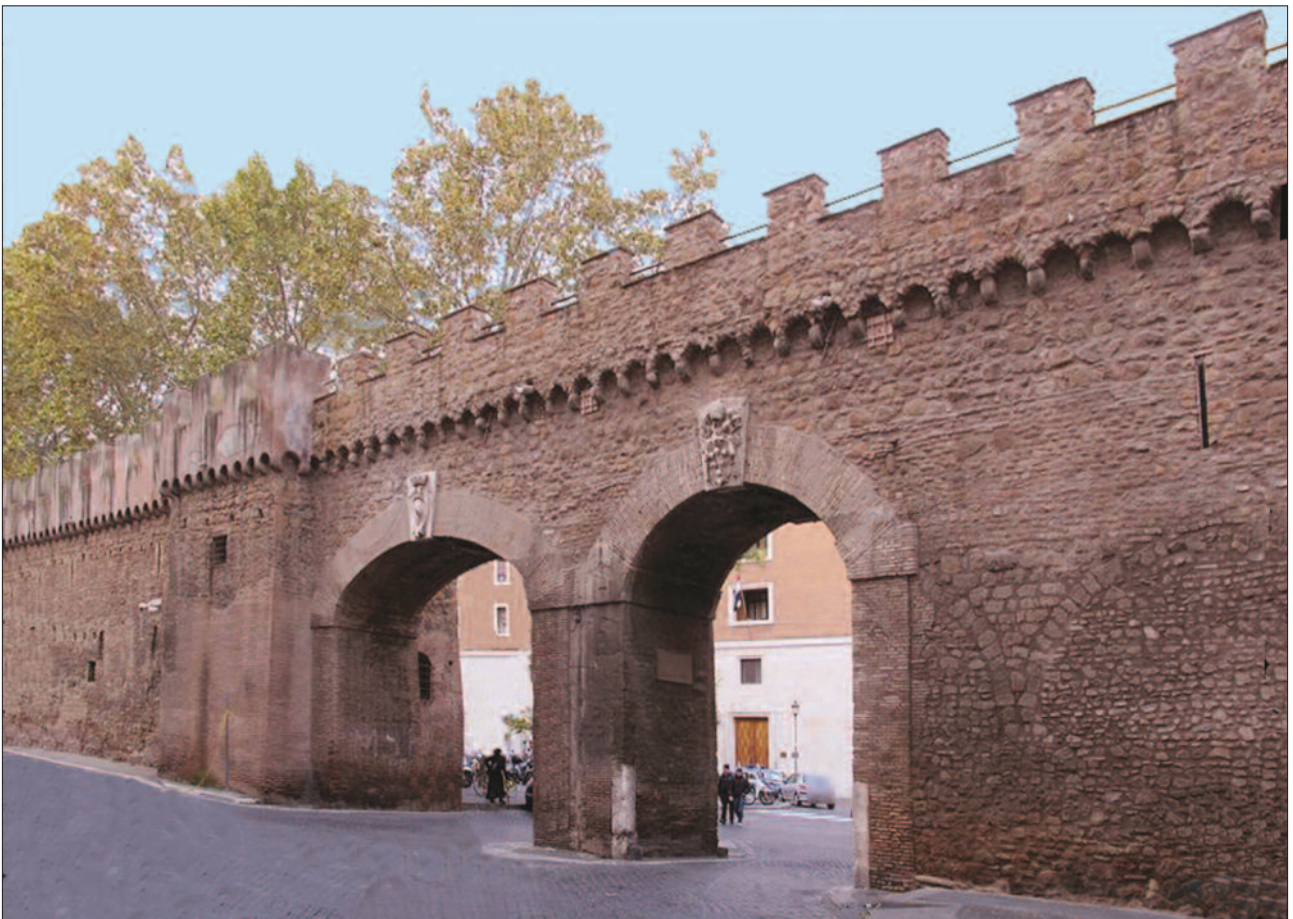
5. ábra. A Passetto di Borgo

A vár kapujával szemben a Teverét átszelő Pons Aeliust, amelyet 590 óta Angyalhídnak (Ponte Sant'Angelo) neveznek, szintén Hadrianus császár építtette 133–134-ben (6. ábra). Belül szürke tufából készült, kívül sárgás travertin burkolja. Ez lett a zarándokok útvonala a városból a Szt. Péter bazilika felé. Az 1450-es szentév alkalmával egy megvadult öszvér miatt a tömegben riadalom támadt, a híd korlátja leszakadt, és