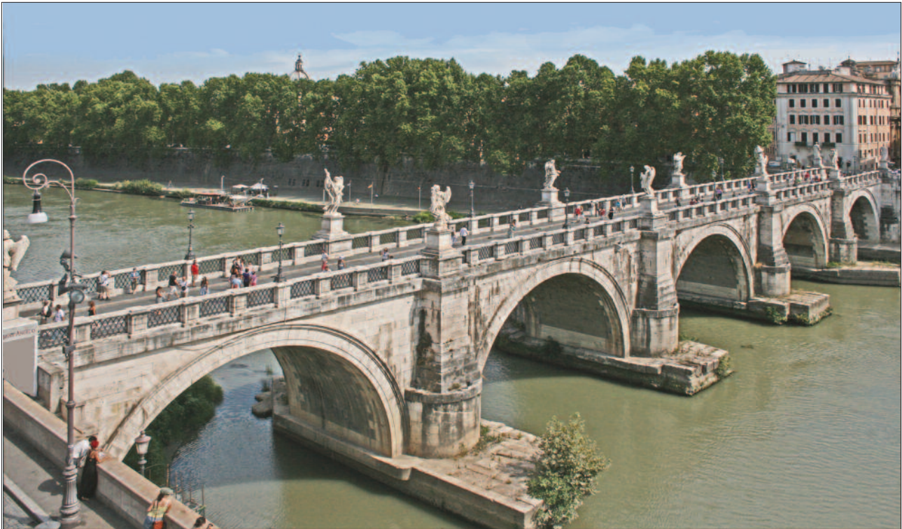
6. ábra. Az Angyalhíd

172 ember halt meg, részint agyontiporva, részint a vízbe fulladva. A tragédia után V. Miklós újjáépítette a hidat. 1535-ben VII. Kelemen a balparti hídfőhöz Szt. Péter és Szt. Pál szobrát állíttatta. Az ezek előtti kis téren (Piazza di Sant'Angelo) voltak a nyilvános kivégzések. A levágott fejeket a hídra tűzték. IX. Kelemen a híd kőkorlátjának díszítésére G. L. Berninivel és munkatársaival tíz fehér márvány angyalszobrot készíttetett (1667–1671). Az angyalok Jézus kereszthalálával kapcsolatos tárgyakat tartanak kezükben. Ezek nyugati oldalon (Szt. Péter szobra mögött): a megkorbácsolás oszlopa, töviskoszorú, köntös és játékkockák, kereszt, pálcán szivacs. A keleti oldalon (Szt. Pál szobra mögött): korbács, Veronika kendője, szegek, a kereszt felirata, lándzsa. A töviskoszorút és a kereszt feliratát tartó angyal eredeti szobrát maga Bernini faragta (7. ábra). Ezeket a pápa nem engedte a hídra állítani, most a Sant'Andrea delle Fratte templomban láthatók. Helyettük másolatuk áll a hídon, ahol ma már csak gyalogosforgalom van.