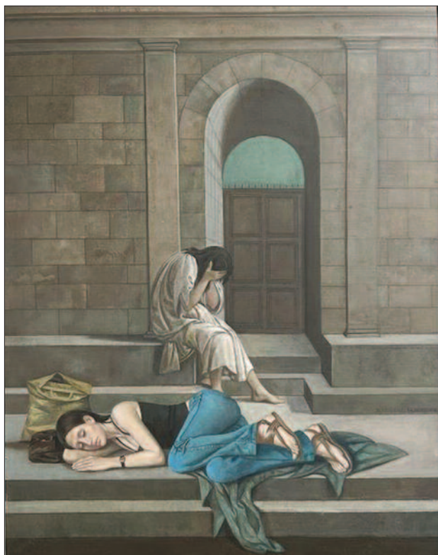
30. kép. Kívül, 1981. – Rippl-Rónai Múzeum, Kaposvár

zető néhány lépcsőfok tetején, fejénél sárga szatyor és egy barna táska. A mű, amelyet Mácsai áttemelt a saját festészetébe, a Botticellinek tulajdonított, La Derelitta címen emlegetett táblakép.