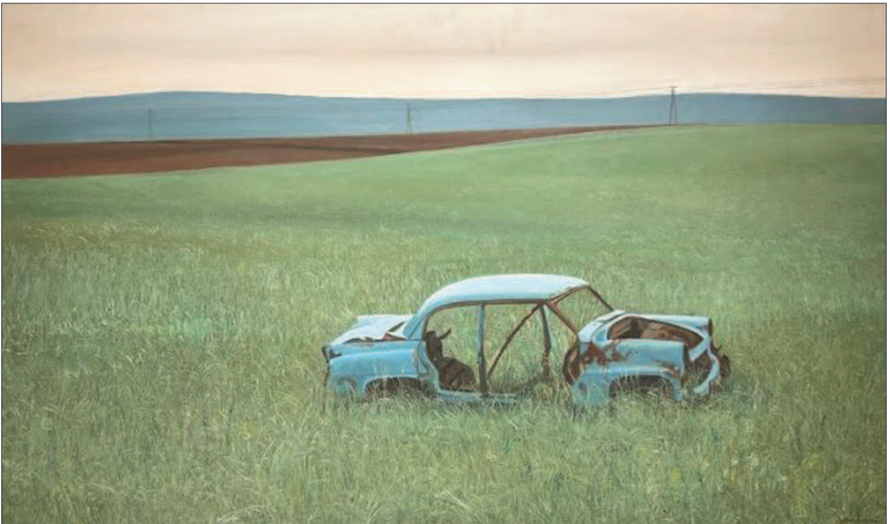
32. kép. A roncs, 1977. - Szépművészeti Múzeum, Budapest