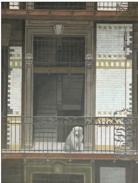
16. kép. Pesti gang, 1963. – Magántulajdon