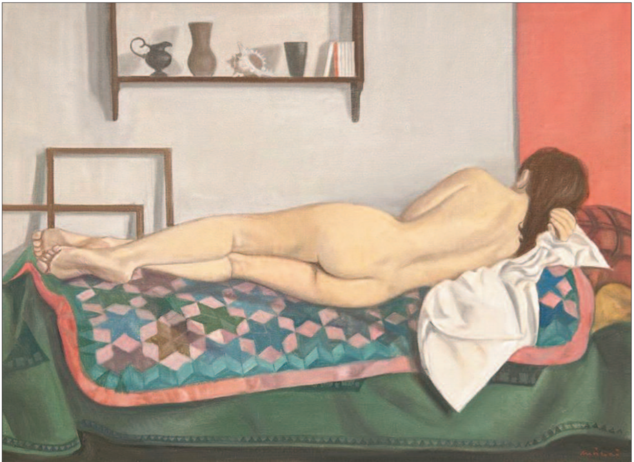
5. kép. Hát akt, 2003. – Dr. Forgács Sándor gyűjteménye