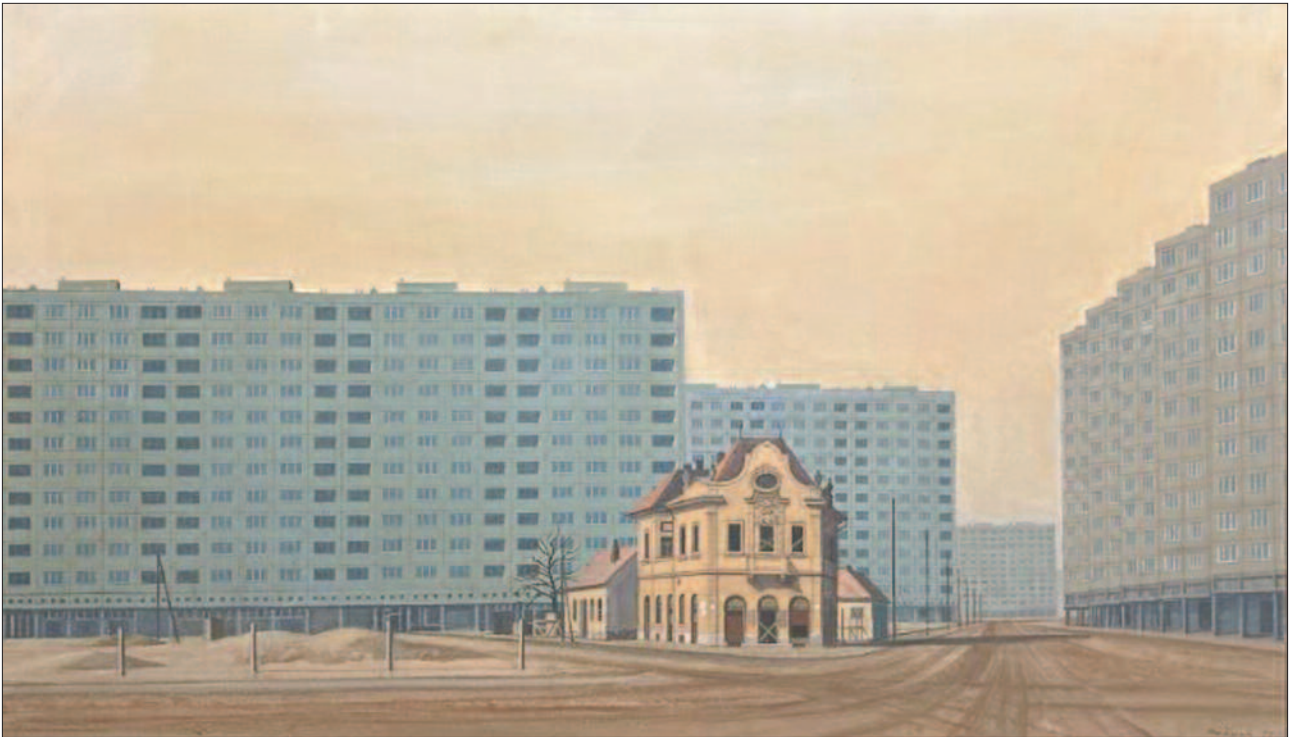
33. kép. Óbuda, 1977.

hogy mi történik az építészetben Óbudán, és persze máshol is.