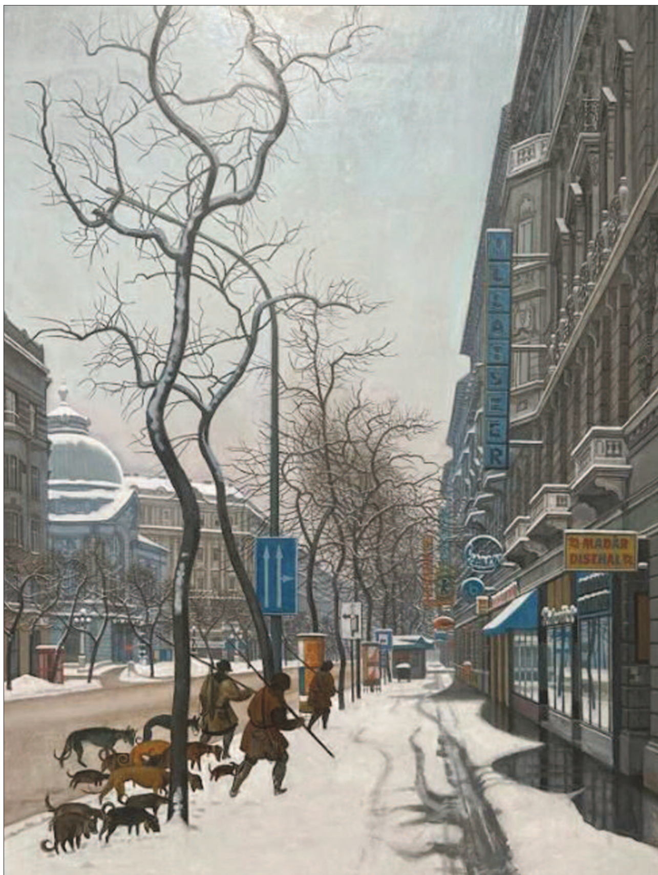
26. kép. Téli vadászat, 1989. – Magántulajdon