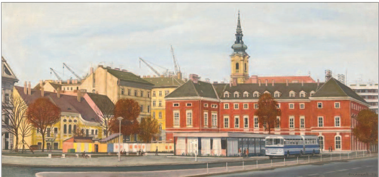
19. kép. A budai Battyányi tér, 1973. – Magyar Műszaki és Közlekedési Múzeum, Budapest