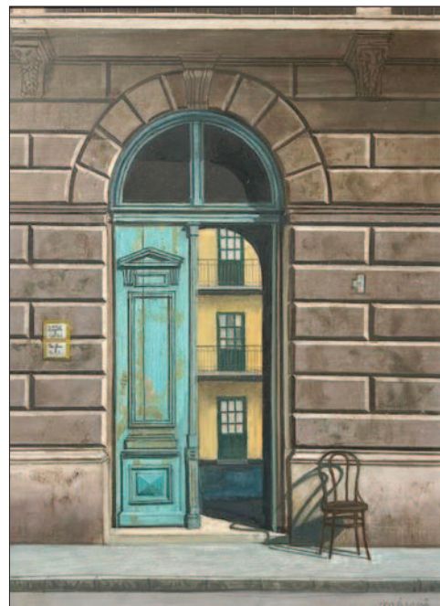
7. kép. Pesti kapu, 1986. – Magántulajdon