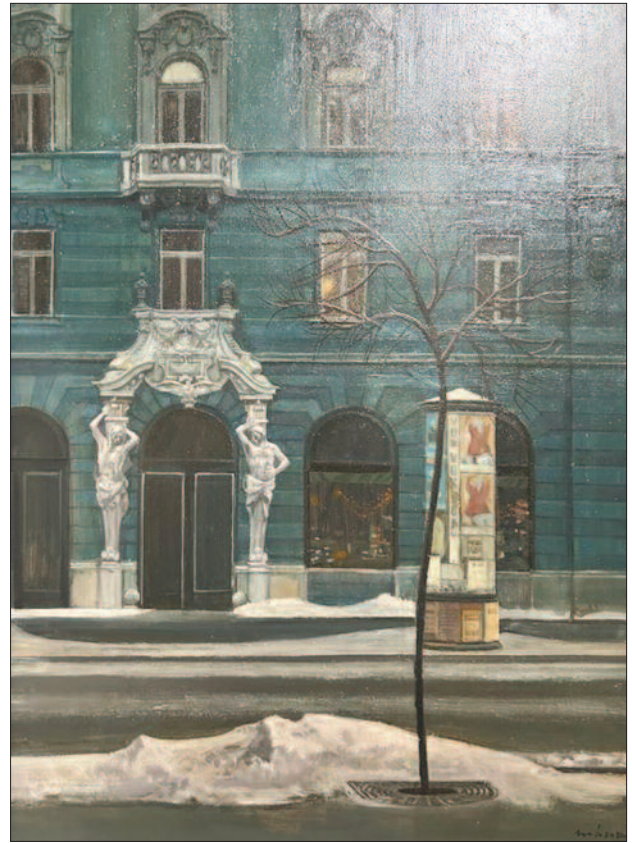
21. kép. Szent István körút 17. 1982.