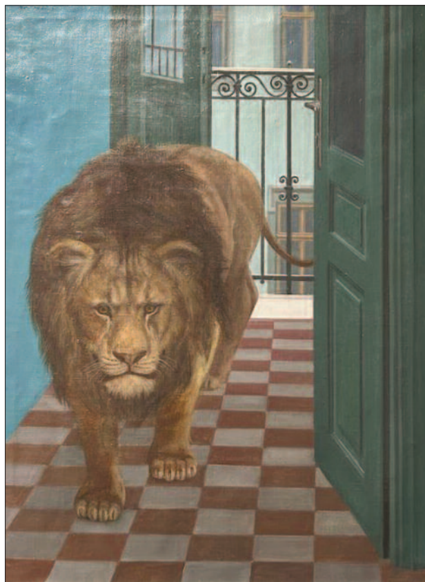
1. kép. Oroszlán a gangon, 1961. – Magántulajdon

1960 körül Mácsai alkotói válságba került, és némi keresés után rátalált arra az útra, amelyen járva aztán szabadon kiteljesedhetett. Letérhetett végre a kényszerpályáról. Portréit, csendéleteit, aktképeit aprólékos rajzossággal, visszafogott kolorittal a quattrocento mestereit megidéző klasszikus arányossággal kiegyensúlyozottsággal formálja (2., 3., 4., 5. képek). Műveinek kezdettől fogva kedvenc témája Budapest városrészeinek megfestése, a belvárosi utcaképek, bérházak, hátsó udvarok, a városrészek napszakai (6., 7., 8., 9. ké-