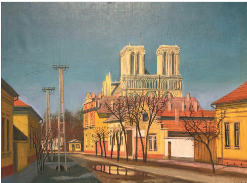
29. kép. A Notre Dame Kiskunfélegyházán, 1981. – Magántulajdon