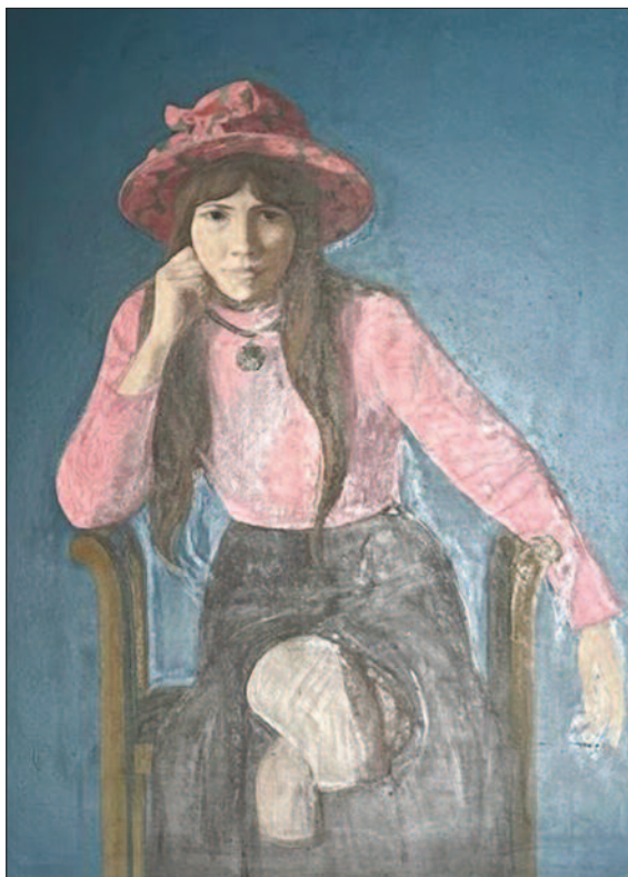
10. kép. Rózsaszín kalapos lány, 1971. – Magyar Nemzeti Múzeum Báthory István múzeuma, Nyírbátor

Bár a határok korántsem nyíltak meg teljesen, a hetvenes évektől már időnként nyugatra is utazhatott, ahol a művészeti irányzatok messze jártak a vasfüggöny mögötti országok látásmódjától. Mácsai végre felkereshette a külföldi múzeumokat, láthatta a németalföldi mesterek műveit, a bécsi, a londoni, a firenzei gyűjtemények klasszikus alkotásait.