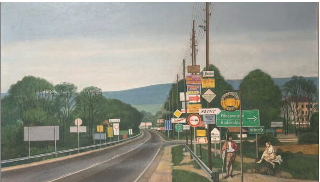
28. kép. Elágazás Ürömnél, 1993. – Magántulajdon