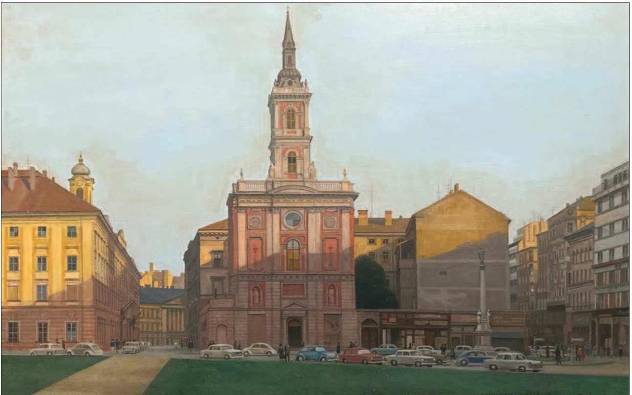
9.. kép. A pesti Martinelli tér 1968-ban – Magyar Nemzeti Múzeum, Báthory István múzeuma Nyírbátor