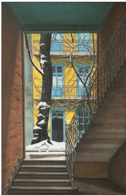
6. kép. Pannónia utca 36. 2003.