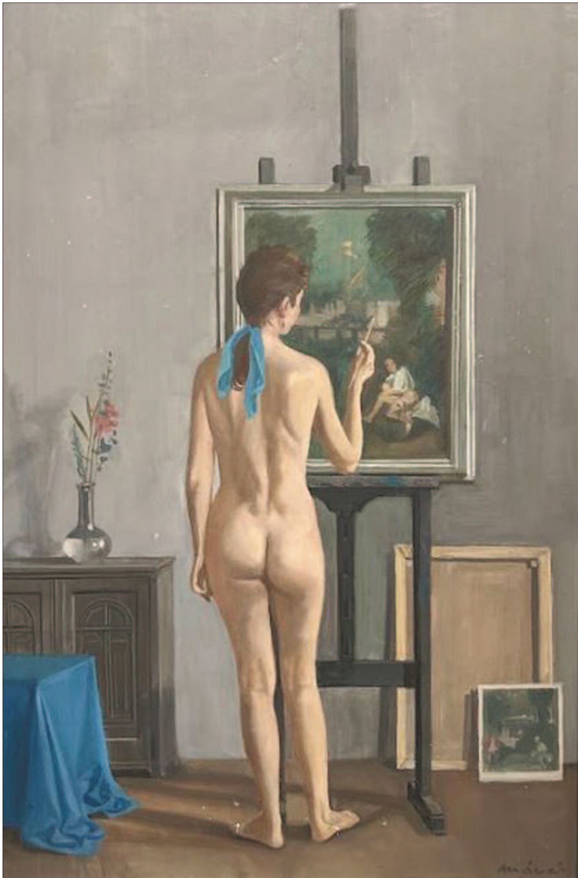
11. kép. Akt ecsettel 2003. - Magántulajdon