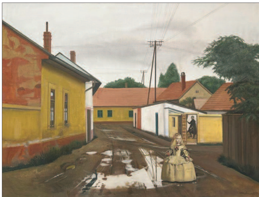
24. kép. Látomás – Infáns nő Kiskunfélegyházán, 1979. – Magántulajdon