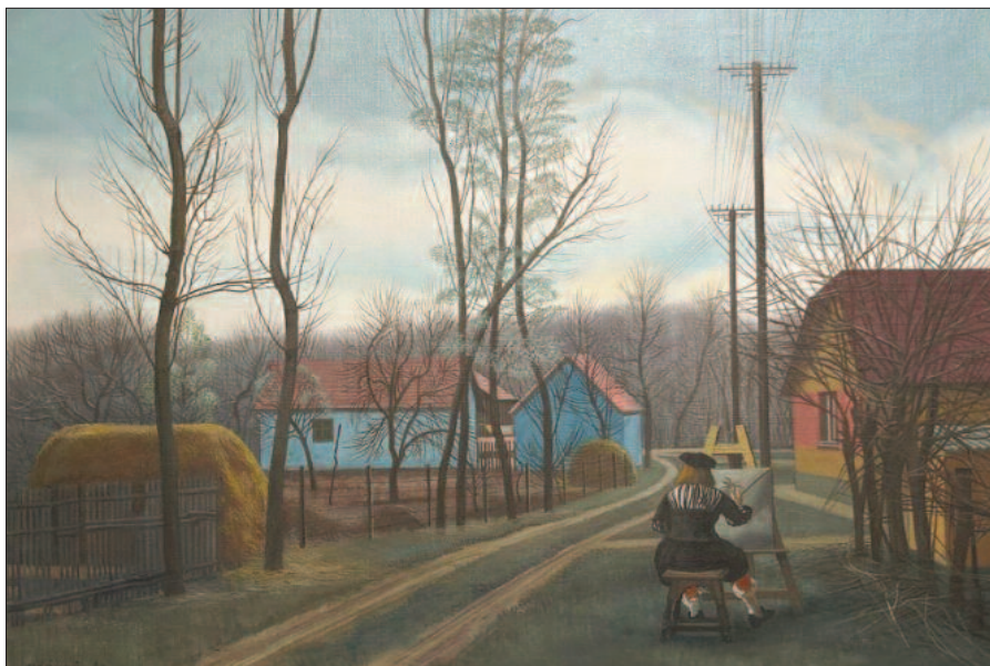
23. kép. Különös tavasz, 1980. – Rómer Flóris Művészeti és Történelmi Múzeum, Győr