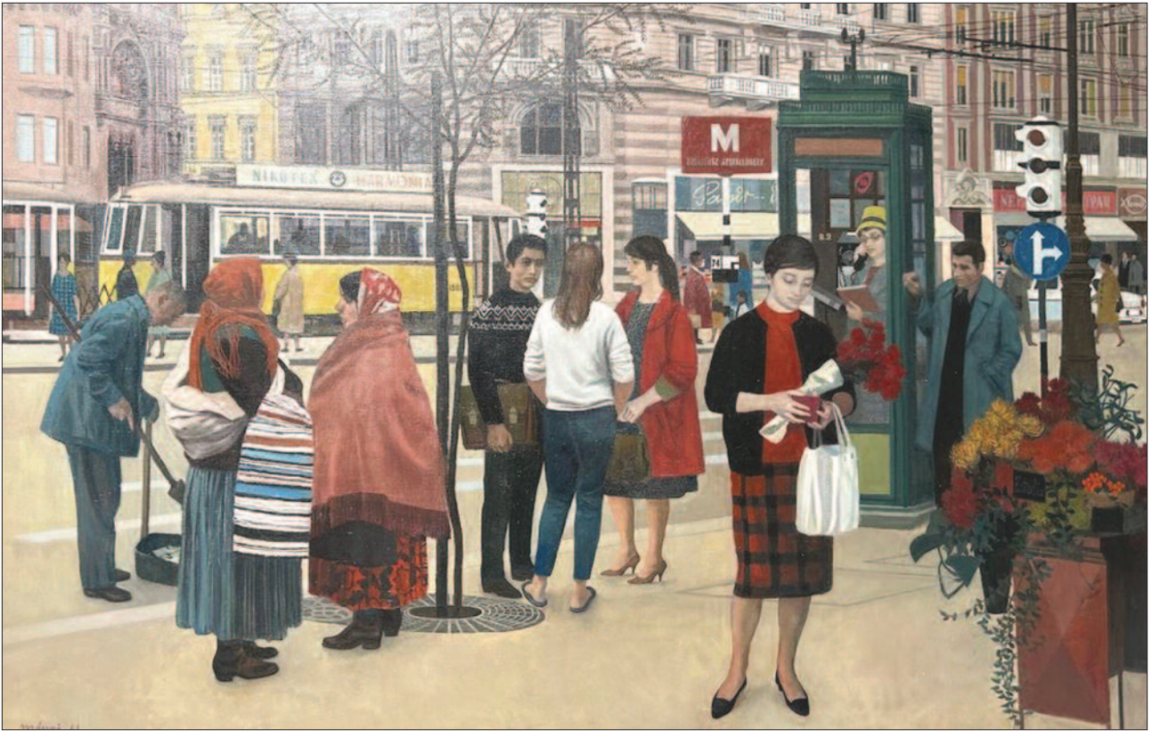
8. kép. Pesti utca, 1961. – Szépművészeti Múzeum Budapest