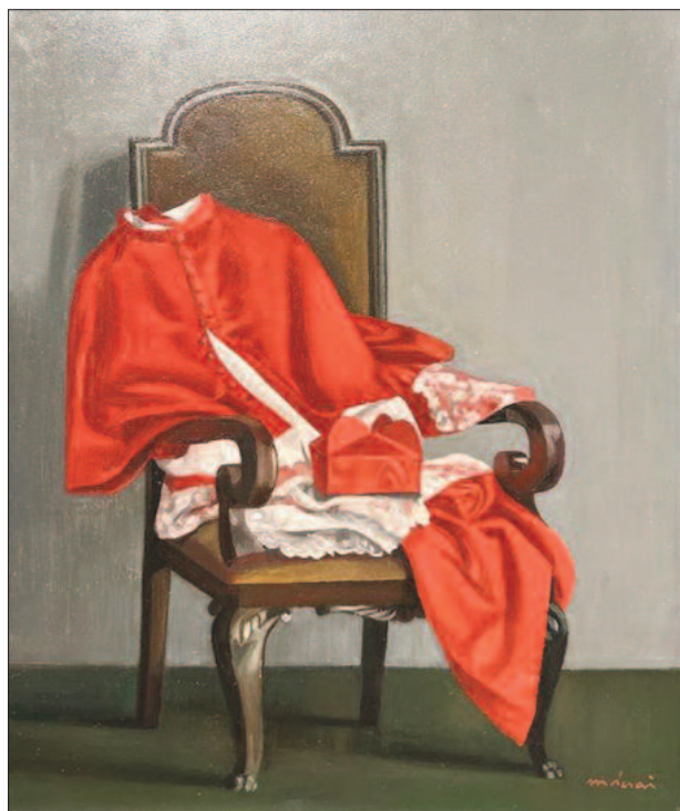
14. kép. A bíboros széke, 1983. – Magántulajdon