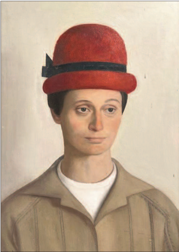
2. kép. Piros kalapos női portré, 1960. – Magántulajdon