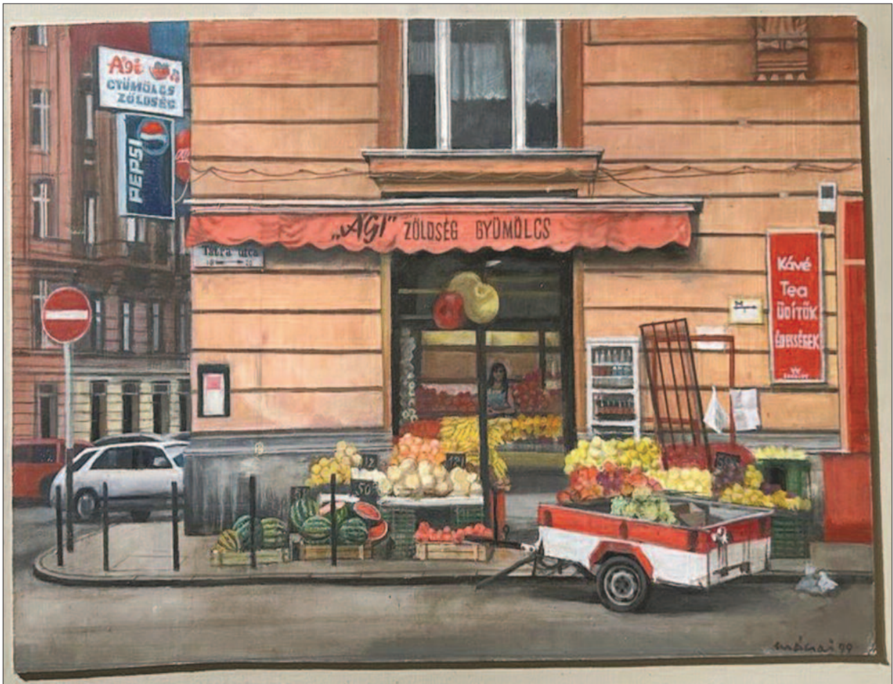
18. kép. Ági gyümölcs-zöldség, 1997. – Magángyűjtemény