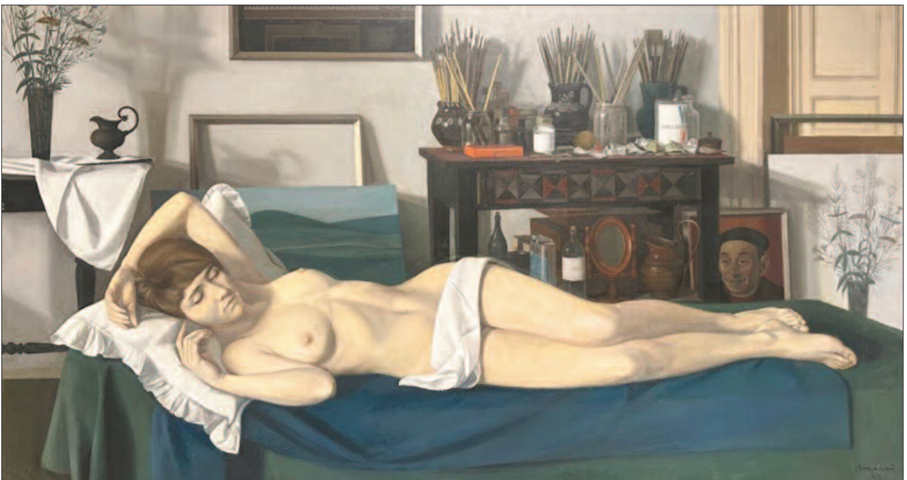
4. kép. Műteremben, 1969. – Szépművészeti Múzeum Budapest