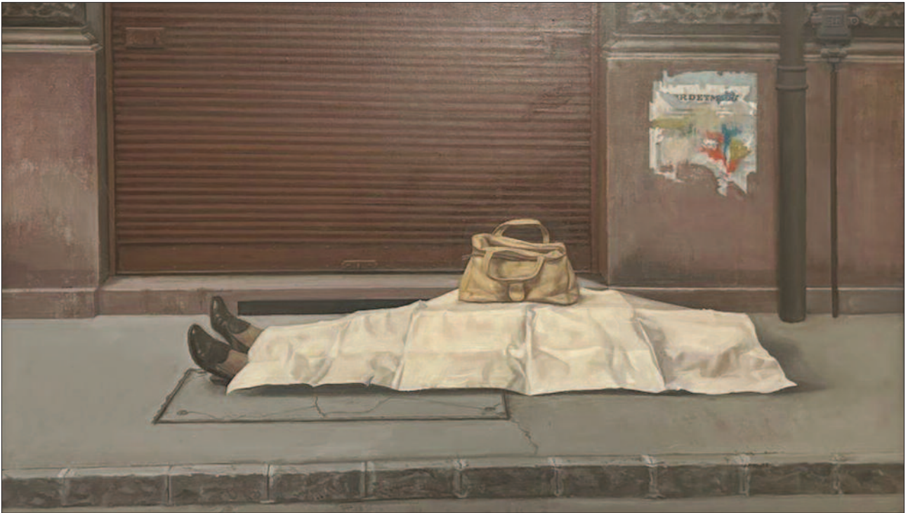
15. kép. Pesti halál, 1978. – BTM Kiscelli Múzeum Fővárosi Képtár

1978-ban egy szeptemberi napon Mácsai István a Pannónia utcából átkeveredett a körút túloldalára, amikor a járdán megpillantott egy középkorú, csomagolópapírral letakart halott nőt, a felső testére helyezett retiküljével. Az élmény nyomán festette meg egyik csöndes, a maga idejében kevés figyelemre méltított főművét, a tudatosan tragikum és komikum határmezsgyéjére pozicionált, a ravatali portrék ikonográfiai hagyományain is átszűrt képét.