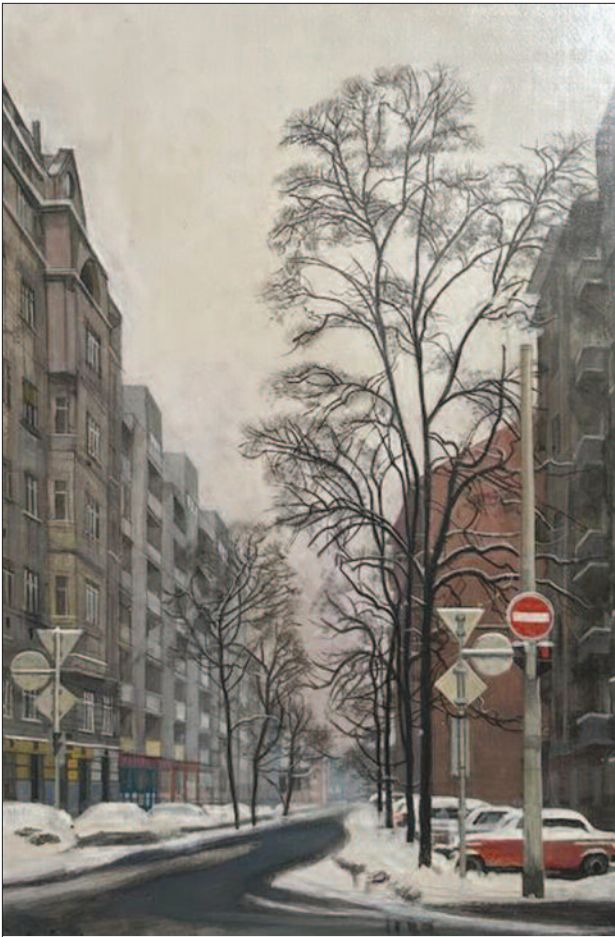
20. kép. A Pannónia utca télen, 1995.