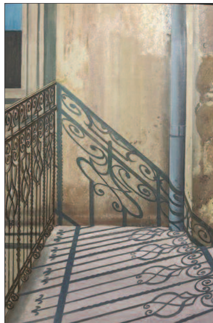
17. kép. A gang délutánja, 1987. – Magántulajdon