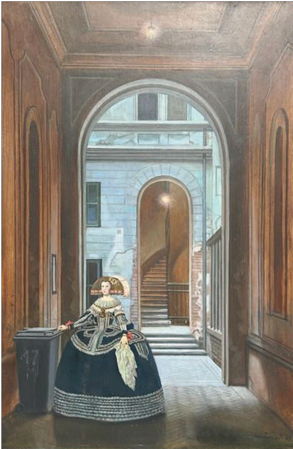
25. kép. Batthyány utca 17., 1987. – Magántulajdon