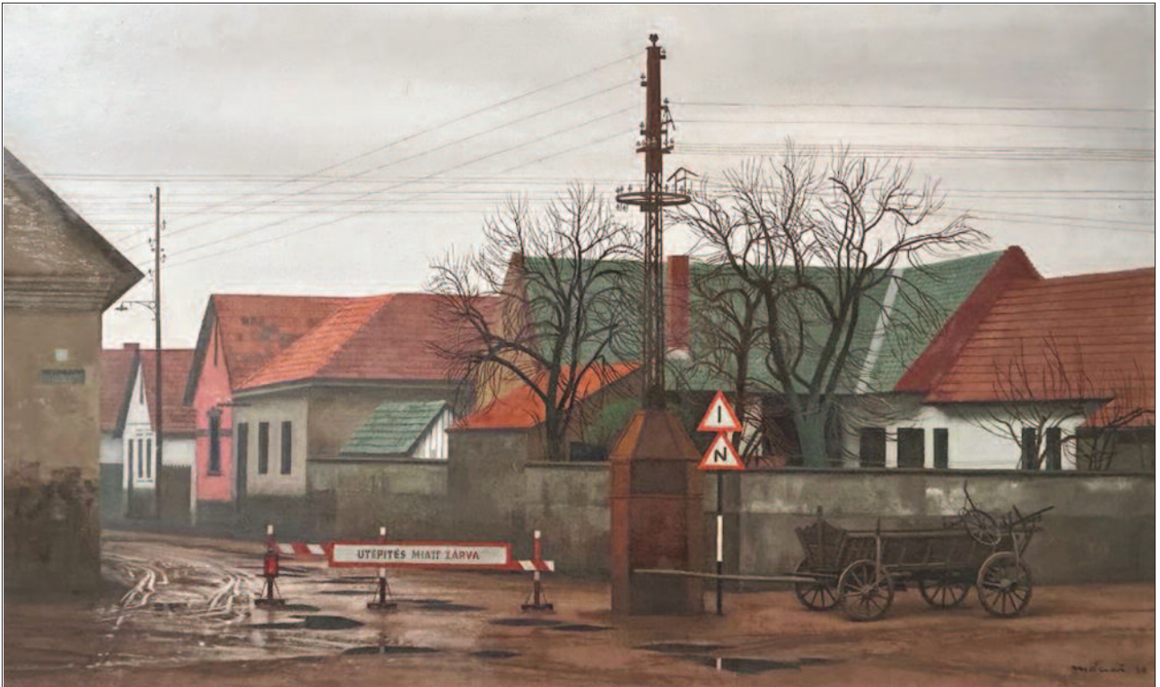
27. kép. Nagymarosi utca, 1966.