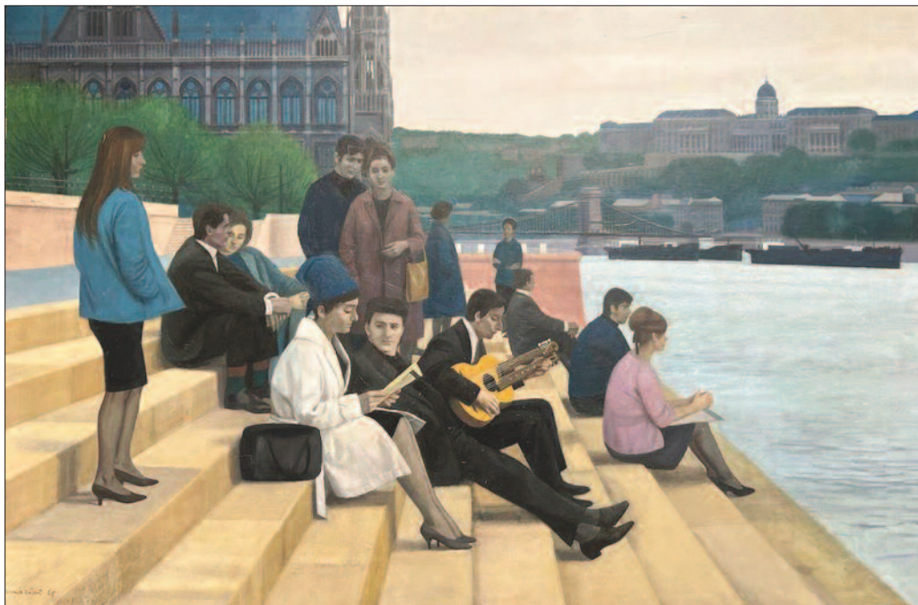
22. kép. Pesti fiatalok, 1965. – BTM Kiscelli Múzeum, Fővárosi Képtár