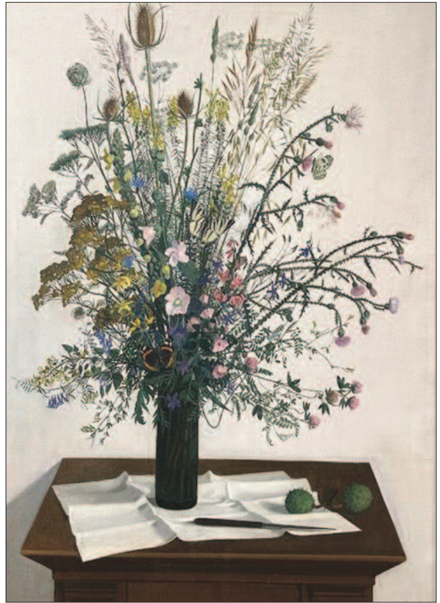
3. kép. Vadvirágos csendélet, 1963. – Magántulajdon