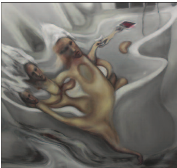
Lidércnyomás a kádban