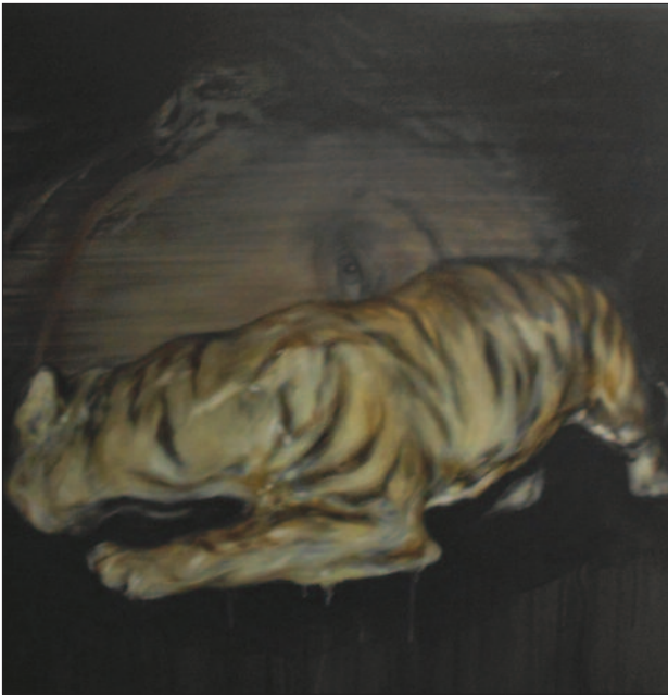
Őnarc, lopakodó tigrissel