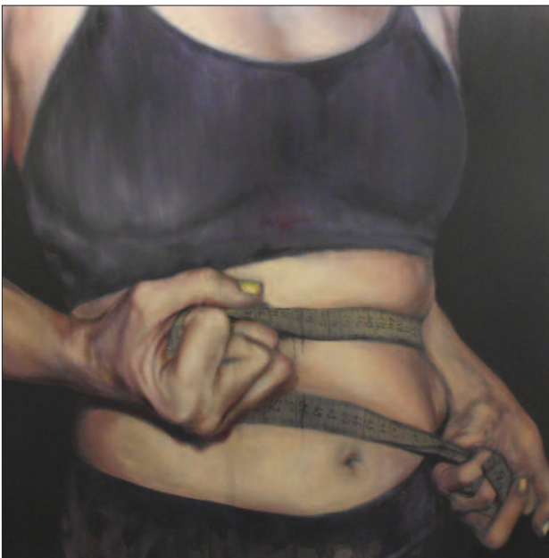
A fiatalság elvesztése