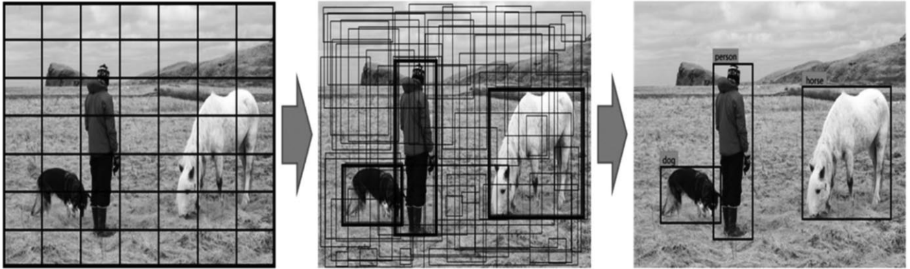
2. ábra YOLO objektumfelismerés folyamata [20]