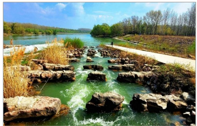
Az ásványrárói hallépcső