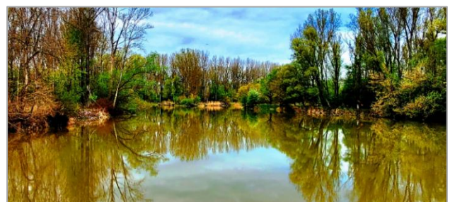
Szigetköz, Cikola-szigeti mellékágak