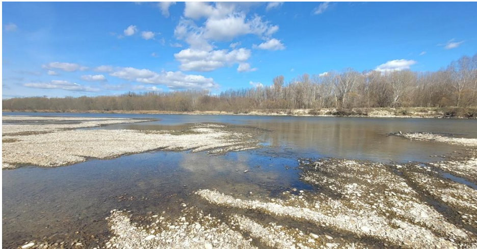
Szigetközben a tartósan nagyon alacsony a Duna folyam Lipót és Dunaremete község külterületén jól láthatóan megcsapolja a közelben lévő Hullámtéri vízpótló-rendszer által megemelt térségi talajvizet