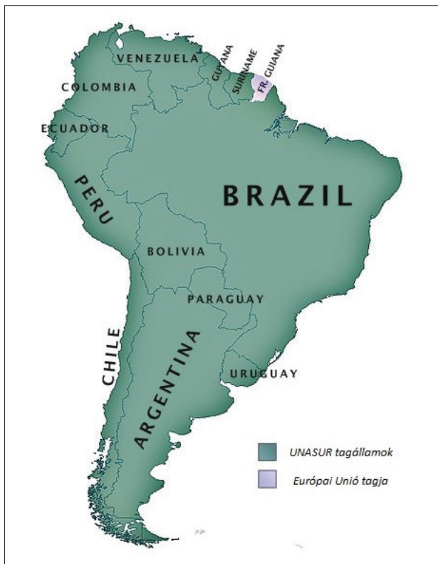
1. ábra. UNASUR tagállamok

(Forrás: Union of South American Nations [USAN])