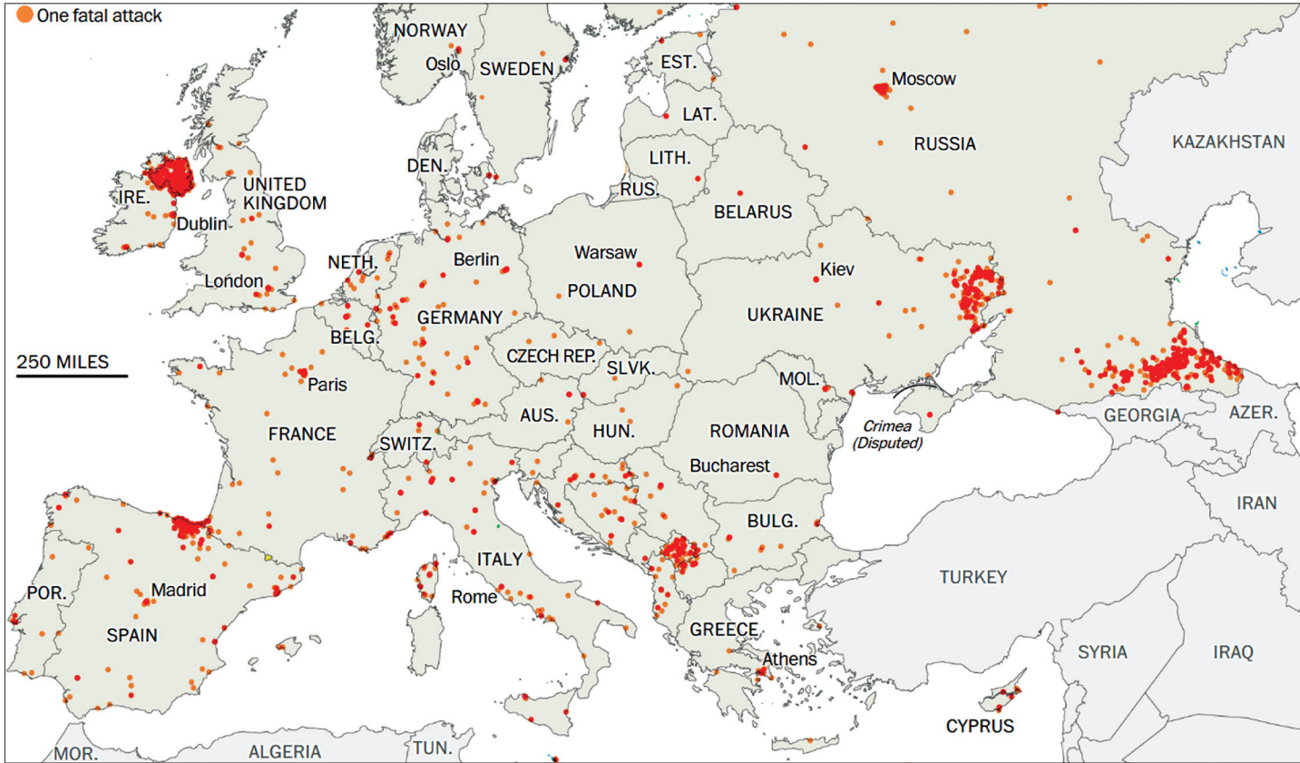
4. ábra. Az európai terrortámadások az elmúlt közel öt évtizedben