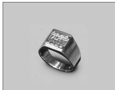
Az Életmű-díjasok emlékgyűrűje