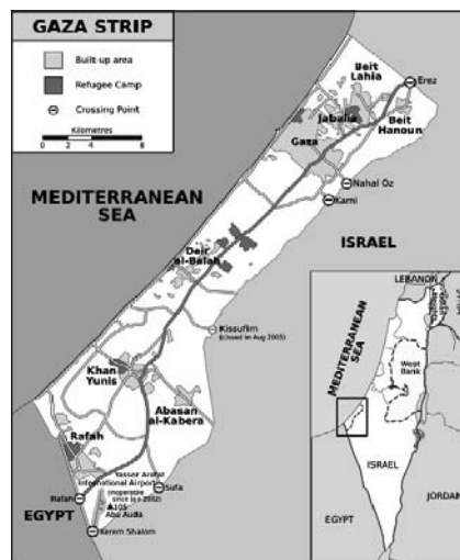
1. ábra. A Gázai övezet térképe

A modern értelemben vett szalafizmus az iszlám szunnita szárnyából indult el a 20. század első harmadában. Maga az irányzat válaszként volt értelmezhető a muzulmán világot ért nyugati behatásra, modernizációs kísérletekre, szembehelyezkedvén az uralkodó vallási és világi elittel. Követőik szerint az iszlám hanyatlásnak indult, mert a hívők letértek a helyes útról, és az iszlám közösség csak akkor nyerheti vissza régi erejét, ha ismét