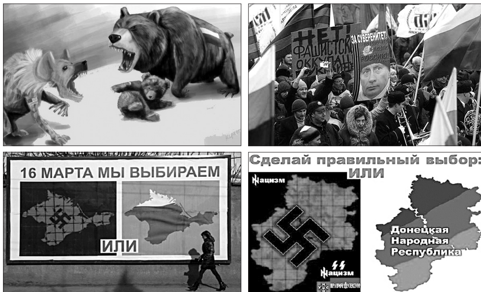
5. ábra. Orosz és szeparatista plakátok 54

Oroszország az információs hadviselés során gyakorlatilag a civilizált világ fő fegyverét, a szólásszabadságot használta fel. Határozottan és tömegesen aknázták ki az internet és a szociális média nyújtotta lehetőségeket, ahol büntetlenül és szabadon terjeszthették anyagaikat. Az információs hadviselés céljaira felhasználták az Orosz Ortodox Egyház mellett a külföldi ún. Orosz Kulturális Központokat is, melyekből mintegy 90 található a világ különböző országaiban.