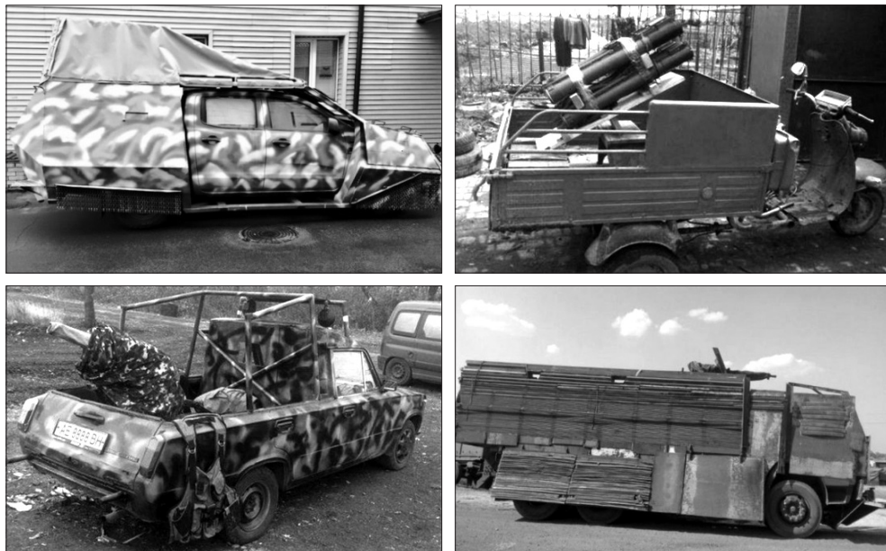
4. ábra. Improvizált ukrán katonai eszközök 39

végez. 2008-ban Ukrajna fegyverszállítással segítette Grúziát az Oroszország elleni háborúban, viszonzásképpen grúz kiképzők segítik az ukrán speciális egységek felkészítését. Ugyanakkor 2014 óta az ukrainai grúz diaszpórából és a Grúziából érkező önkéntes zászlóalj, az ún. „Grúz Légión” a harcokban is részt vesz.