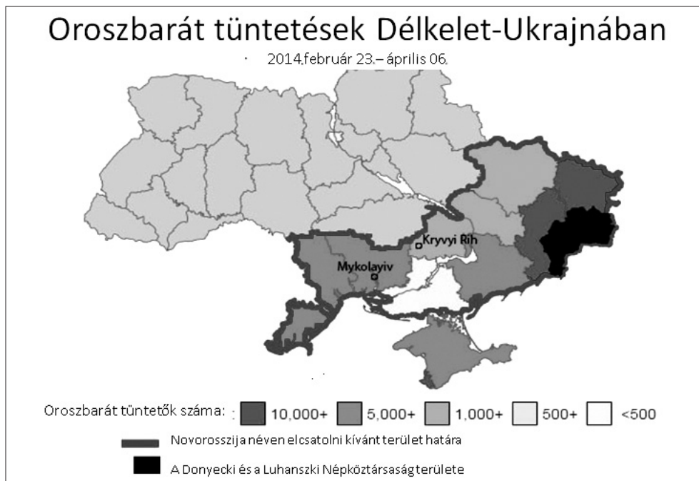
1. ábra. Oroszbarát tüntetések Délkelet-Ukrajnában 10

nyelvi törvény ellen is tüntettek, szerették volna, hogy az orosz is hivatalos nyelv legyen. Az oroszországi támogatással szervezett és végrehajtott tüntetések erőszakossá váltak. A megmozdulások az ország délkeleti térségeire terjedtek ki (l. 1. ábra).