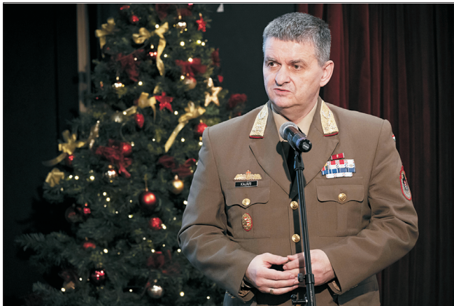
Kajári Ferenc altábornagy, VKF-helyettes