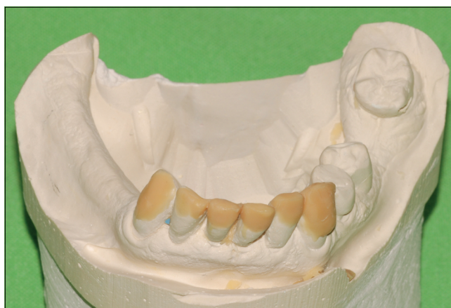
11. kép: Diagnosztikus felviaszolás (waxup) – alsó állcsont