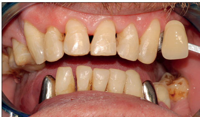
17. kép: Fémvázak ellenőrzése a szájbán, fogszínválasztás. A fémvázakat megfelelőnek találtuk.