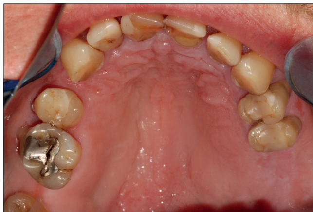
2. kép: Kiindulási állapot, felső állcsont