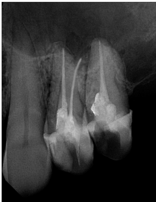
6. kép: Kontroll intraorális röntgenfelvétel a 24., 25. fogak endodontiai ellátását követően

A második klinikai vizsgálat során a következőket észleltük: a 24., 25. fogak kopogtatási érzékenysége csökkent. A molárisok területén palatinálisan a fogatlan gerinc életől mintegy 1 cm-re kb 1 × 2 cm nagyságú fibrotikusnak tűnő terület volt megfigyelhető. Az elsődleges klinikai vizsgálat során a terület fibrotikusan megvastagodott tuber maxillae-nek imponált. A kiindulási periapikális röntgenfelvételen radix relictta nem ábrázolódtott. A nevezett területet alaposan megvizsgálva azt találtuk, hogy az palatinálisan gumiszerű tapintatú volt, enyhén nyomásra érzékeny. Orthopantomogramot kértünk (7. kép), melyen a bal felső moláris területen rendellenes morfológiát észleltünk. A panaszok figyelembevételével, illetve a klinikai és radiológiai vizsgálat alapján felmerült ameloblastoma, cemento-osseus dysplasia [2, 12], esetleges tumor gyanú, mely a bal oldali arcüreget érinti. Ennek tudatában sürgősséggel hisztológiai mintavétel céljából a területileg illetékes fekvő-