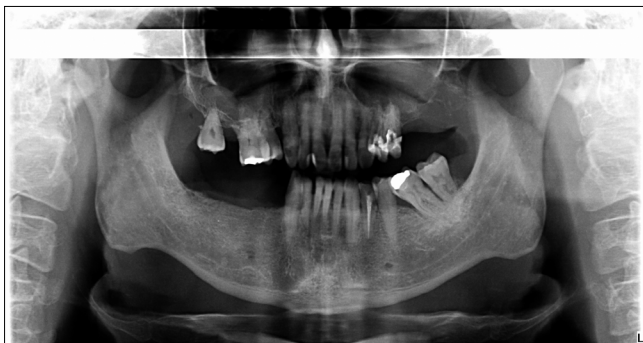
7. kép: Differenciáldiagnosztikai céllal készült orthopantomogram. A bal felső molárisok területén rendellenes morfológiát észleltünk, mely esetleges tumorgyanút vetett fel, ezért hisztológiai mintavétel és MR-felvétel készült.

osztályos szájsebészetre utaltuk a páciens, illetve arckoponya MR-vizsgálatot kértünk. Az elkészült szövettani és MR-vizsgálat eredménye: bal oldali sinus maxillaris kitöltő diffúz nagy B-sejtes lymphoma.