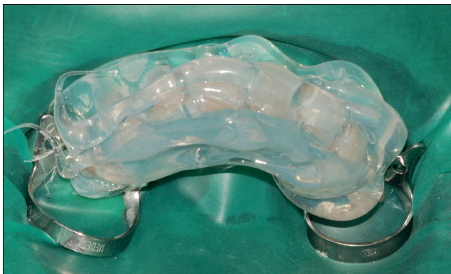
13. kép: Átlátszó szilikon átvívó sablon használata