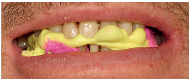
16. kép: IKP rögzítése harapásrögzítő szilikon segítségével, 2 fázisban

zítettük az IKP-t, (ábrán zöld, Colorbite D, Zhermack GmbH, Marl, Németország), majd azokat eltávolítva az ideiglenes koronáknak megfelelő teret ismét feltöltöttük harapásrögzítő szilikonral (ábrán magenta színű