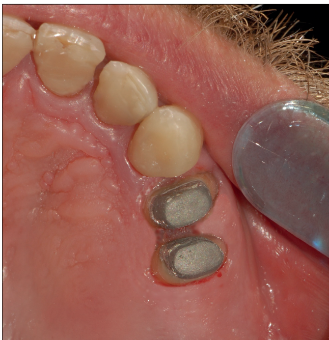
15. kép: Becementezett öntött csapos múcsokok 24., 25. fogakban

zítettük az IKP-t, (ábrán zöld, Colorbite D, Zhermack GmbH, Marl, Németország), majd azokat eltávolítva az ideiglenes koronáknak megfelelő teret ismét feltöltöttük harapásrögzítő szilikonral (ábrán magenta színű