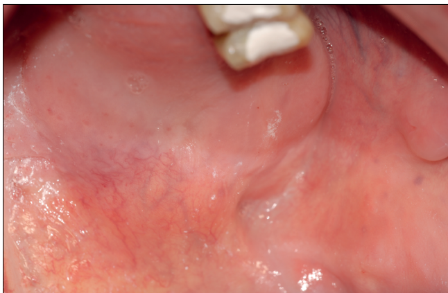
4. kép: Bal felső molárisok helyén lévő palatinális duzzanat