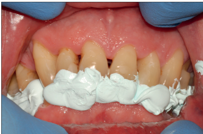
9. kép: Támasztócsapos regisztráló sablon segítségével beállított harapás rögzítése szilikon segítségével

tettük [8] (9. kép). Ennek megfelelően a mintákat részlegesen egyéni értékű artikulátorba (Kavo Protar 5B) gipszelték [9], majd a beállított harapási magasságnak megfelelően diagnosztikus felviaszolás (waxup) történt (10., 11., 12. kép). Ezáltal a beállított kívánatos harapási magasságot a frontfogak tartották. A felviaszolt mintáról átlátszó szilikon lenyomatanyaggal (Kristall A70 Perfect, Müller-Omicron GmbH, Lindlar, Németország) sablont készítettünk, melynek segítségével direkt eljárással, kofferdam izolálásban, kompozit restauráció segítségével állítottuk helyre az attríciós frontfogakat (13. kép). Ezáltal elértük az előzetesen beállított, 4 mm-rel megemelt kívánatos harapási magasságot (14. kép).