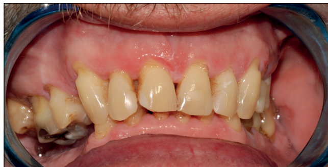
1. kép: Kiindulási állapot, IKP

A páciens elmondása szerint egy-két hete a bal felső kvadráns területén időnként nyilalló, erőteljes fájdalmat érzett, mely a napokban tompa, feszítő fájdalommal alakult. A klinikai vizsgálat során 24., 25. fogakban nagy kiterjedésű, MOD kompozit tömések voltak, secunder caries-szel. A nevezett fogak szenzibilitást nem mutat-