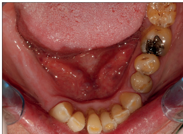
3. kép: Kiindulási állapot, alsó állcsont

tak, vertikális irányú kopogtatásra érzékenyek voltak, bal oldali arcduzzanat volt látható.