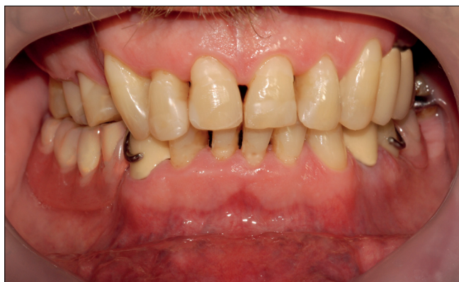
19. kép: Elkészült fogpótlások átadása.

Az esztétikai és funkcionális szempontokat megfelelően találtuk.