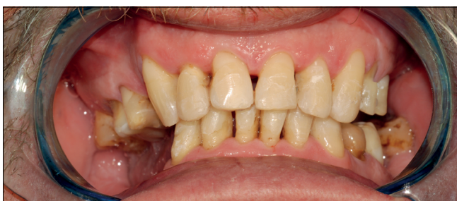
14. kép: Direkt eljárás segítségével kialakított, előzetesen meghatározott harapási magasságnak megfelelő IKP