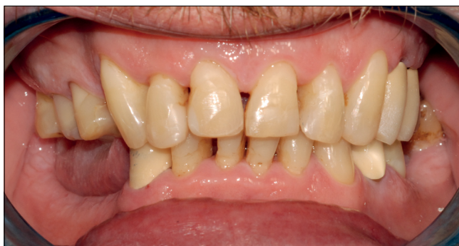
18. kép: Nyerspróba. Artikulációt, okklúziót ellenőriztük, az esztétikát megfelelőnek találtuk.

Futar D, Kettenbach GmbH & Co. KG, Eschenburg, Németország) (16. kép).