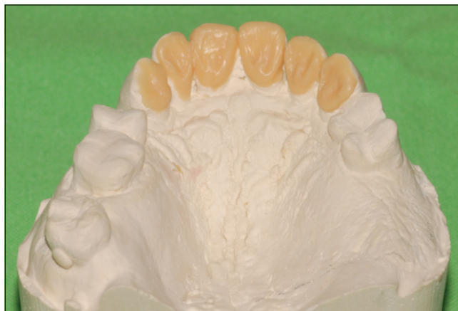
10. kép: Diagnosztikus felviaszolás (waxup) – felső állcsont

gítást alkalmazva, fém gyári lenyomatkanállal kétfázisú, külön idejű precíziós-szituációs lenyomatot vettünk A szilikon segítségével (Virtual Refill Putty és Virtual Refill Light Body, Ivoclar Vivadent AG, Schaan, Liechtenstein). Az interkuspidációs pozíciót (IKP) harapásrögzítő szilikon segítségével rögzítettük két fázisban. Először az ideiglenes koronákat szájban hagyva rö-