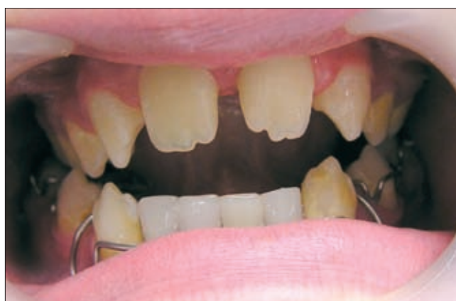
7. ábra. Kivehető aktív lemez tágitócsavarral és az alsó metszők hiányát pótló akrilát fogakkal

a rögzített készülék alkalmazását és később implantációs beavatkozás kívánatos, de a körülmények nem teszik lehetővé, vagy nem kedvezőek a rögzített készülékkel történő kezelés azonnali elkezdésének. Ilyen fordulhat elő például a foghiány következtében kialakult súlyos mélyharapás esetében, ahol előkezelésként kivehető készülékkel próbáljuk enyhíteni a nagyfokú harapási eltérést.