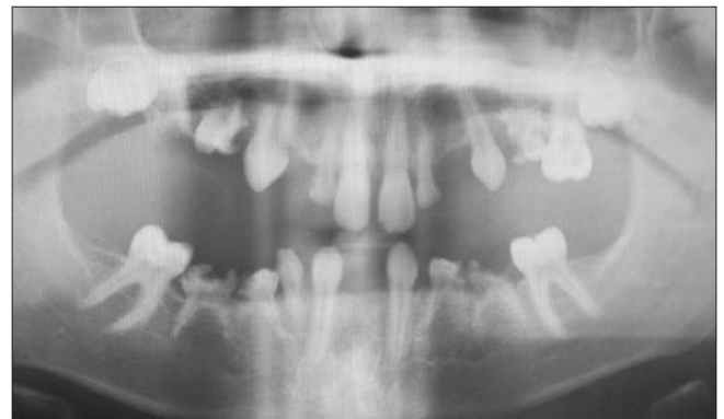
3. ábra. 14 éves páciens panorámafelvételén látható a maradó fogak nagyfokú csírahiánya

14 éves fiú páciens súlyos, 21 maradó fogat érintő csírahiánnyal érkezett klinikánkra. A panorámafelvételen látható meglévő maradó fogak [16, 13, 11, 21, 23, 26, 27, 36, 33, 43, 46] a helyükről elmozdultak (3. ábra). A nagymértékű foghiány a rágófunkció csökkenését,