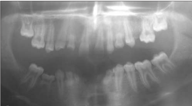
8. ábra. Minden fogcsoportot érintő csírahiány 16 éves páciensnél, mind a négy kvadrántra kiterjedő szemfog csírahiánnyal

41, 42, 43, 45, 46, 48. A mind a négy kvadránst érintő szemfoghiány még oligodontiában is ritkán fordul elő (8. ábra). A páciensnél az oldalzónában lévő foghiány és az alsó frontfogak teljes hiánya miatt mélyharapás