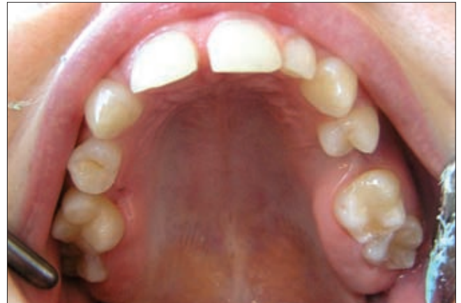
10. ábra. A felső fogívben a második premolarisok és jobb felső kettes csírahiánya valamint csap alakú bal felső kettes 18 éves páciensnél

18 éves lány páciens többszörös, a 18, 15, 12, 25, 28, 38, 35, 45, 48-as fogakat érintő csírahiánnyal érkezett fogszabályozó kezelésre (10. ábra). A rögzített készülé-