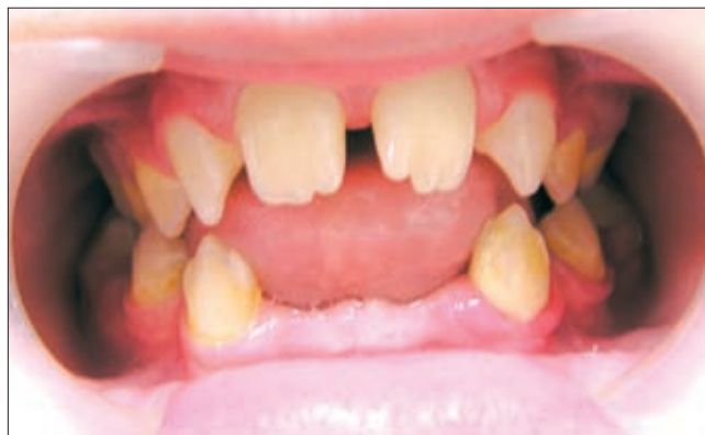
6. ábra. 12 éves páciens oligodontiával, impaktált jobb alsó premolarissal

Olyan esetekben is kezdetjük a kezelést kivehető készülékkel, ahol a páciens életkora ugyan megengedi