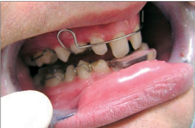
9. ábra. Felső metszők intrudálása kivehető készülékkel

alakult ki, valamint a felső nagymetszők nagymértékben elongálódtak. Ezen fogak intrudálását és a harapás emelését kivehető készülékkel végezzük (9. ábra). A továbbiakban rögzített készülékes kezelés valamint implantációs és protetikai rehabilitáció tervezett.