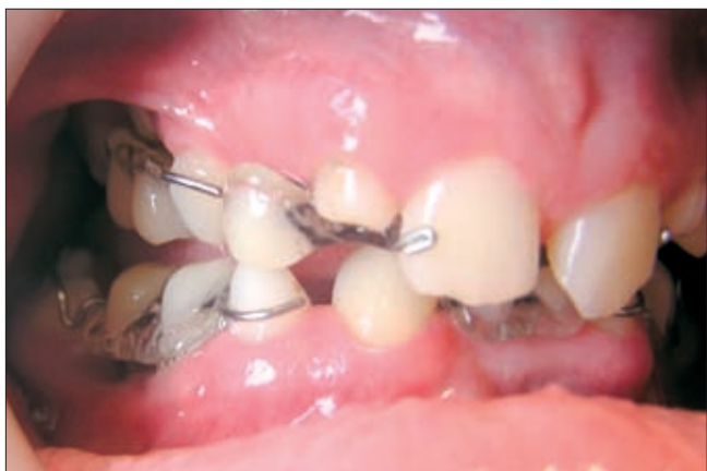
5. ábra. A készülék a szájban

nánk (4, 5. ábra). A 17–19 éves korban sorra kerülő implantációig célunk a helyfenntartás és a későbbiekben készülő fogpótlás pillérfogainak tengelykorrekciója (preprotetikai orthodoncia).