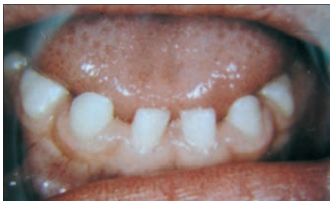
1. ábra. Maradófogazati oligodontia mellett csírahiány a tejfogazatban

A fejlődési rendellenességek érinthetnek egyes fogakat, fogcsoportokat vagy az egész fogazatot [6, 17]. Valódi oligodontiáról 6-nál több fog veleszületett csírahiánya esetén beszélünk (1. ábra). Az egész fogazatot érintő veleszületett foghiány, az anodontia totalis rendkívül ritka, többnyire nem önálló kórkép [13].