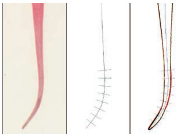
2. ábra. Pre- és posztoperatív képek valamint a mérések során használt sablon

A csatorna tengelyének vonalát a megszerkesztett segédvonalakkal együtt egy sablonként elmentettük,