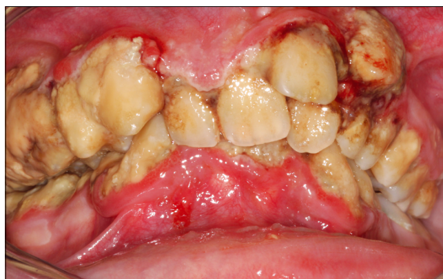
10. ábra: c) necrotizáló stomatitis (NS)

Az új klasszifikációs rendszerben fontos lépés volt az egészséges parodontium pontos definíciója és a különböző gyulladástól mentes parodontális állapotoknak diagnosztika rendszerbe történő integrálása. Elsősorban epidemiológiai és klinikai kutatások szempontjából fontos ennek definíciója. Nagyon nagy eltérések vannak még ma is abban, hogy egy klinikai vizsgálat mit tekint eredményes kezelésnek, és mikor minősíti az állapotot gyógyultnak.