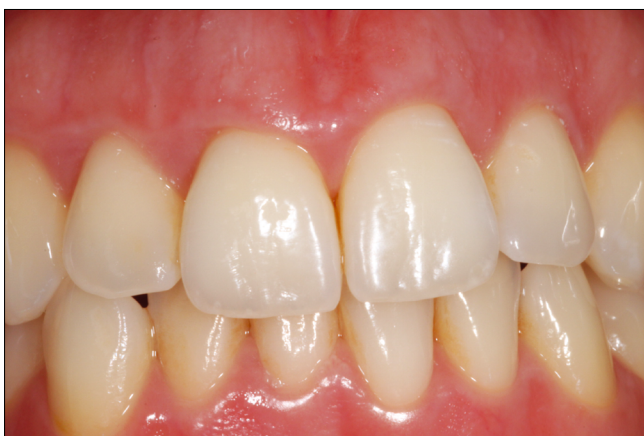
2. ábra: 26 éves nő klinikailag egészséges parodontiuma

A szuper egészséges gingiva (amelyre jellemző a BoP 0, és a PPD < 3 érték) nagyon ritka, de bizonyos extrém jó supragingivális plakk-kontroll mellett fenntartható. Ezt az állapotot is hisztológiailag igazolható normál fiziológiás gyulladással infiltrátum, elsősorban PMN leukociták felügyelik [20]. Ez nem patológiás gyulladással infiltrátum, hanem normál szervezeti reakció, hasonlóan a vas-tagból Peyer-plakk rendszeréhez (1. ábra).