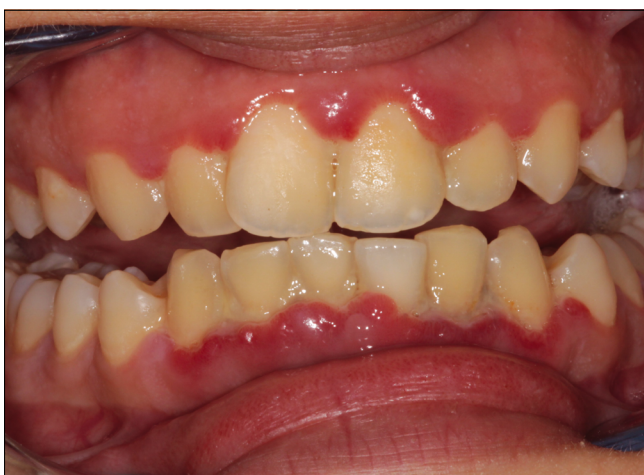
10. ábra: A necrotizáló parodontális betegség klinikai stádiumai: a) necrotizáló gingivitis (NG)

necrotizáló periodontitis (NP) és necrotizáló stomatitis (NS) ugyanannak a súlyos gyulladáshoz vezető immunfolyamatnak a különböző stádiumai. Az új terminológia „Necrotizáló fogágybetegség” („necrotizing periodontal disease”) (NPD) néven foglalja össze a triászt. A háttérben közös specifikus bakteriális infectio ( Treponema