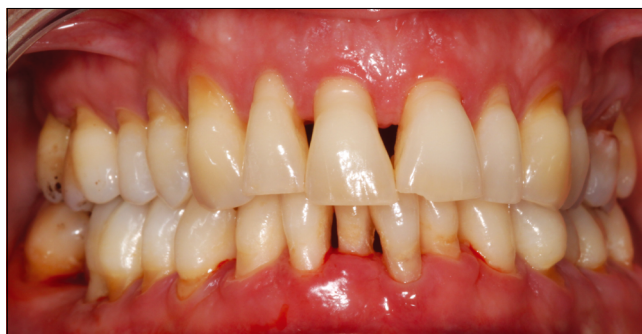
6. ábra: Parodontális műtéteken átesett, szupportív kezelés alatt álló beteg recidiváló ínygyulladás

A pubertáskori gingivitis átmeneti jelenség, a vizsgálatok szerint csak nagyon kevés nő mutat a menstruációs ciklusa során változást a gingiva állapotában, és a legújabb fogamzásgátló szerek hormontartalma olyan alacsony, hogy annak már nincs, vagy alig van hatása a gingiva gyulladással szembeni válaszreakciójára.