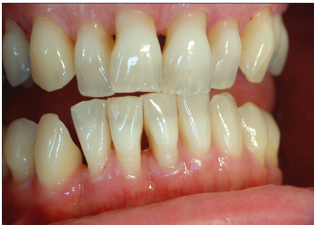
3. ábra a: Parodontális kezelés után teljesen gyulladásmentes redukált parodontium