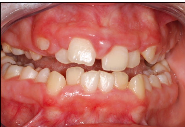
8. ábra: Ínymegnagyobbodás: a) lokális – b) generalizált

nifest lokalizált ínygyulladás lehet az eredmény. A gingivitis intenzitásának, súlyosságának leírásában még a mai napig is a klasszikus Loe–Silness gingivális index négy fokozatú beosztása érvényes (0-1-2-3) [31].