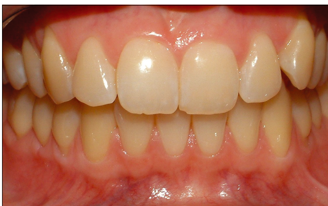
1. ábra: 18 éves nő szuper egészséges parodontiuma

ladás súlyosbodása során alig változik. Egy másik vizsgálatban dán önkéntes dentál-higiénikusan végzett vizsgálatban azt tanulmányozták, hogy hosszú távon az extrém jó supragingivális szájhigiéniával és rendszeres professzionális szájhigiéniás kezeléssel hat hónap alatt milyen mértékben lehet tovább csökkenteni az egyébként klinikailag egészséges gingiva gyulladással infiltrátum mennyiségét. A klinikailag egészséges-től a „szuper egészséges” állapotba négy hónap múlva jelentősen emelkedett a kötőszövet kollagéntartalma 57,7%-ról 71,0%-ra, a limfociták mennyisége 18,4%-ról 5,6%-ra csökkent, viszont a PMN leukociták mennyisége csupán 20,6%-ról 17%-ra csökkent. Ez azt igazolja, hogy még a klinikailag „szuper egészséges” ínyben is jelentős kb. 17–20% PMN leukocita infiltráció van jelen, és ez az arány még manifeszt gyulladásban sem nagyon változik [23, 24]. Tehát a PMN leukocita jelenléte nem a gyulladás fokmérője, hanem az ínyben az orális baktériumokkal szembeni normál védekezés sejtjele, amely nem patológiás, hanem sokkal inkább fiziológiás jelenség. A teljesen ép ínyben kis számban memória B sejtek is jelen vannak, ez szintén a fiziológiás homeosztázis fenntartását biztosítja az orális baktériumok és a szervezet között [21].