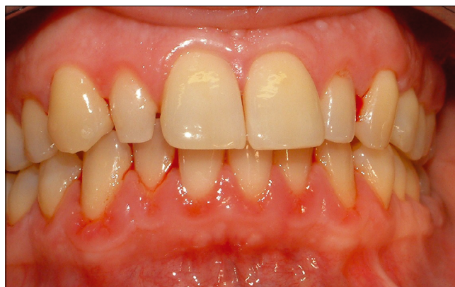
5. ábra a: Plakk okozta gingivitis

A plakk okozta gingivitist súlyosbíthatják a fogak anatómiai adottságai, a gyökéranatómia, a restaurátumok minősége, valamint sok szisztémás tényező. A PPD értékek és a radiológiai vizsgálat nem mutat tapadásvesztést, legalábbis a primer gingivitisben. A hisztológiai lelet akantotikus sulcus epitéliomot, a fibroblast és a kollagén csökkenését, kapilláris burjánzást és progresszív celluláris gyulladásmegvédő infiltráció képét mutatja.