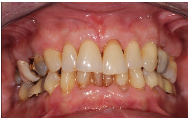
4. ábra: Kontrollált krónikus parodontitis – (szupportív kezelés alatt)

a) ínnyészélre lokalizálódó gyulladás; b) a dentális biofilm eltávolítása után restitutio ad integrum gyógyul (reverzibilis); c) az egyéni küszöbértéket meghaladó bakteriális terhelés váltja ki a gyulladást; d) szisztémás módosító tényezők súlyosbítják a lefolyását (gyógyszerek, hormonális hatás, immunológiai és egyéb sziszté-