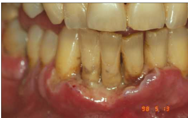
10. ábra: b) necrotizáló parodontitis (NP)

spp., Selenomonas spp., Fusobacterium spp., és Prevotella intermedia ) és több jól ismert szisztémás rizikó-tényező (dohányzás, stressz, fehérjehiányos táplálkozás, immunhiányos állapot /HIV/) húzódik meg [36, 37]. Amennyiben a nekrosis a papilla csúcsára és a marginális gingiva egy milliméteres szakaszára korlátozódik, a diagnózis NG (10. ábra a), amennyiben ez tapadás-vesztéssel párosul, a diagnózis NP (10. ábra b) és ha a nekrosis túlmeleg a mucogingivális junctio vonalán és érinti a laza nyálkahártyát is, a diagnózis NS (10. ábra c).