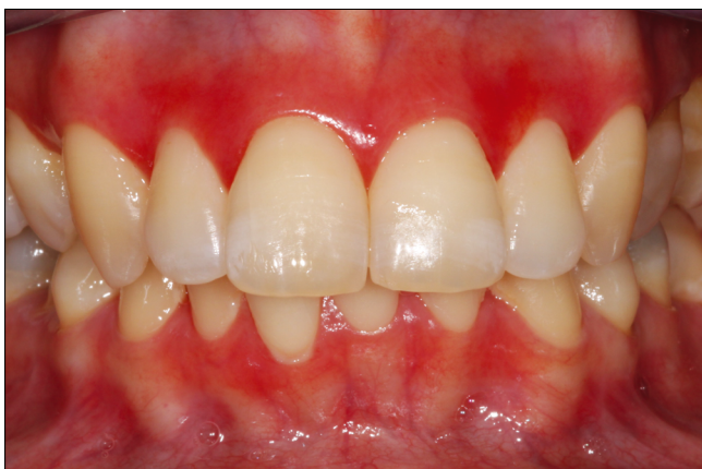
9. ábra: A nem plakk okozta ínylezió leggyakrabban desquamativ gingivitis formájában manifesztálódik

necrotizáló periodontitis (NP) és necrotizáló stomatitis (NS) ugyanannak a súlyos gyulladáshoz vezető immunfolyamatnak a különböző stádiumai. Az új terminológia „Necrotizáló fogágybetegség” („necrotizing periodontal disease”) (NPD) néven foglalja össze a triászt. A háttérben közös specifikus bakteriális infectio ( Treponema