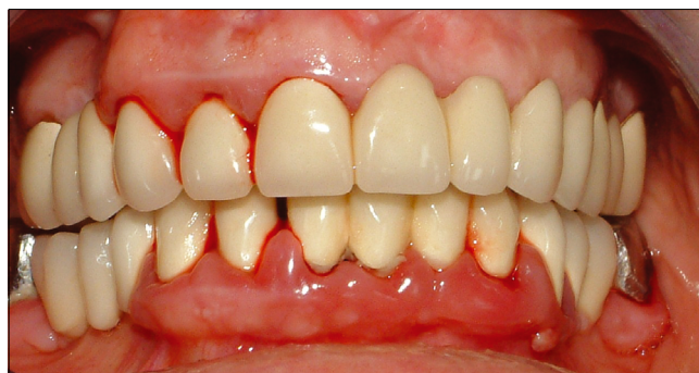
5. ábra b: Lokális plakk retenció okozta gingivitis klinikai képe