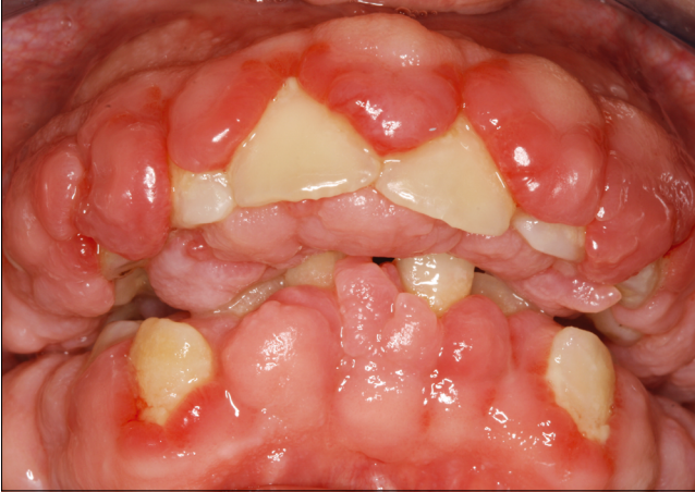
7. ábra: Gyógyszer okozta (cyclosporin) súlyos ínhyperplasia

írása. Hasonlóan a krónikus parodontitishez, beszélhetünk lokalizált és generalizált gingivitisről. Lokalizált, amennyiben 30%-nál kevesebb fog érintett és generalizált, ha 30%-nál több fog körül gyulladt az íny. Javasolt bevezetni az incipiens gingivitis diagnózisát, amely alig különbözik a klinikailag egészséges ínytől, csak nagyon kevés fognál észlelhetők az ínygyulladás legkorábbi jelei (enyhe színváltozás és érintésre lassan kialakuló minimális vérzés). Azonban ha ezt nem kezeljük, ma-