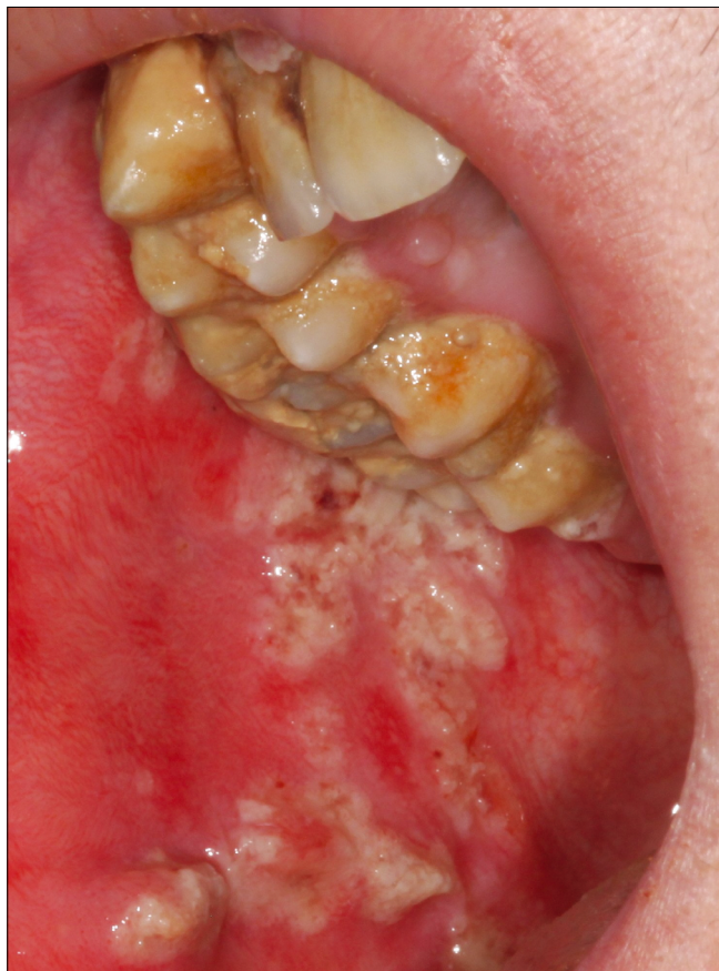
10. ábra: d) Necrotizáló stomatitis (NS) az előző páciens buccalis nyálkahártyáján

A korábbi klasszifikációs rendszerrel szemben az új rendszer a nem plakk okozta csoportba, a speciális bakteriális fertőzések közé sorolta be a necrotizáló paradontális betegségeket is. Korábban ez csak a foggybetegségek kategóriájában szerepelt. Bár mint látni fogjuk, a rögzítő apparátus betegségei csoportban is felsorolja a rendszer a necrotizáló paradontitist. Tény, hogy a NP-nak specifikus bakteriális flórája van és etiológiájában jól körülhatárolható mikroorganizmusok szerepelnek. Ezek egy része tagja a paradontopatogén baktériumok nagy családjának ( Fusobacterium spp. ,