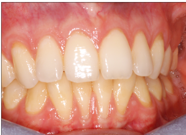
3. ábra b: Gyulladásmentes ínnyecessio klinikai képe

a) ínnyészélre lokalizálódó gyulladás; b) a dentális biofilm eltávolítása után restitutio ad integrum gyógyul (reverzibilis); c) az egyéni küszöbértéket meghaladó bakteriális terhelés váltja ki a gyulladást; d) szisztémás módosító tényezők súlyosbítják a lefolyását (gyógyszerek, hormonális hatás, immunológiai és egyéb sziszté-