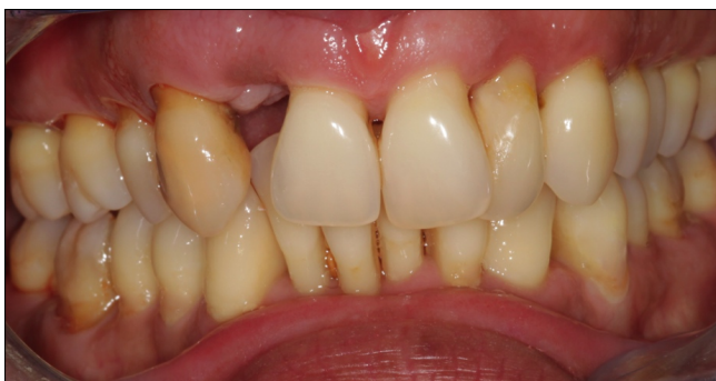
1.1. ábra: Kiindulási státusz a 12-es fog eltávolítása után

A cirkóniumváz próbája után (1.3. ábra), Vita Easyshade (Vita Zahnfabrik, Bad Säckingen, 79704 Germany) készülék segítségével kiválasztottuk a megfelelő fogszínt, majd a váz leplezése után a híd beragasztásra került (1.4., 1.5. ábra)