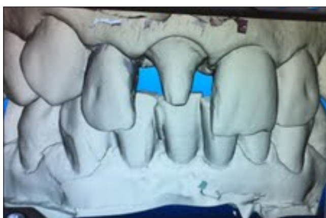
2.4. ábra: Digitális lenyomat készítése