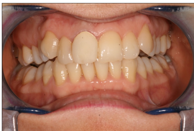
2.3. ábra: Ideiglenes korona

matot vettünk. Ennek alapján már Scutan módszerrel el lehetett készíteni az ideális méretű ideiglenes koronát (2.3. ábra).