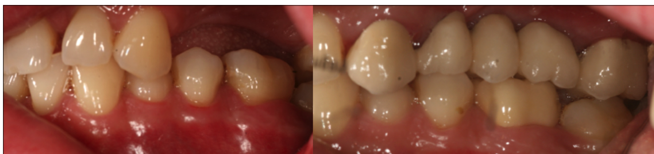
3.5. ábra: Előtte–utána