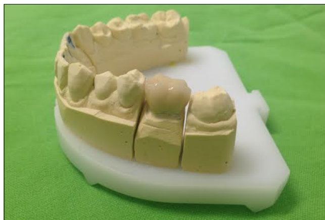
3.2. ábra: Elkészült cirkónium-dioxid vázas korona mintán