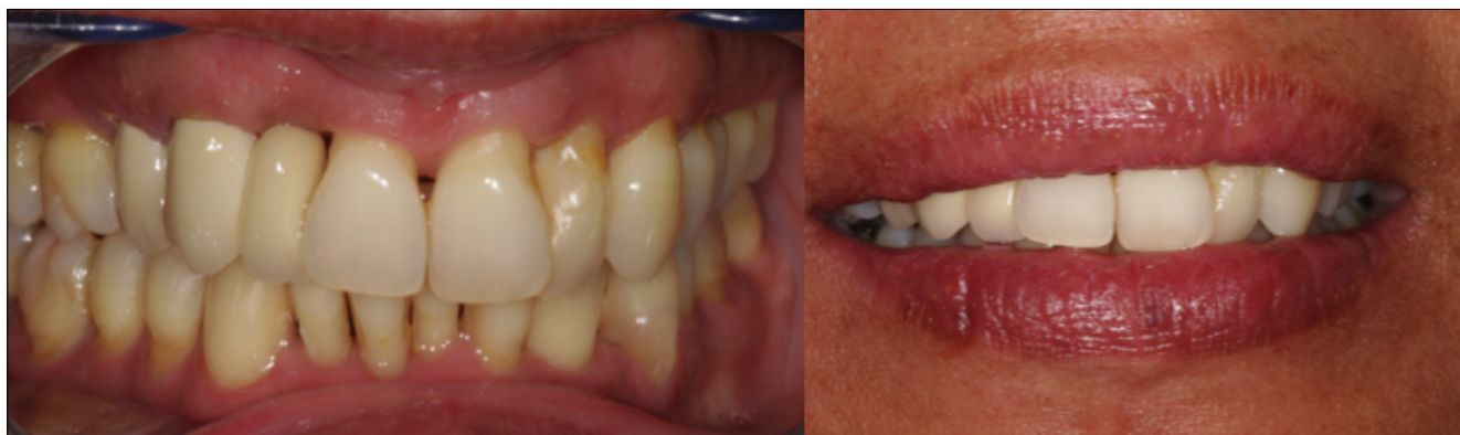
1.5. ábra: Kész fogpótlás