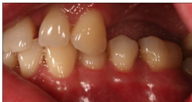
3.1. ábra: Kiindulási állapot

Míg az irodalom más telikerámia anyagokból csak front-restaurációk, illetve kisebb kiterjedésű, maximum háromtagú hidak készítését javasolja, addig a cirkónium-dioxid vázas restaurációk indikációs területe sokkal szélesebb. Viszonylag magas nyomási és torziós ellenállása miatt a moláris régióban is alkalmazható [14], illetve háromtagúnál hosszabb, vagy akár szabad végű hidak is biztonságosan készíthetők belőle [15]. A cirkónium-