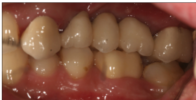
3.4. ábra: Becementezett alsó és felső fogművek

dioxid váz több színben elérhető, így igazítható a csonk színéhez, ez nagyban hozzájárul a magasabb esztétikai eredmény eléréséhez. Opacitásuk miatt elszíneződött, gyökérkezelt fogakra vagy akár fémcsapokra is esztétikus restauráció készíthető. Fémektől eltérő feldolgozási technológiája, a hideg frézelés nagyfokú precizításra ad módot. Napjainkban tehát a mindennapi klinikai gyakorlatban a cirkónium-dioxid vázás fix restaurációk a részleges foghiányok pótlásában komoly alternatíváját képzik a klasszikus fémkerámia munkáknak. Alkalmazásuknál egyszerre használhatjuk ki a fémekhez hasonló kiváló mechanikai és előnyös optikai tulajdonságaikat.