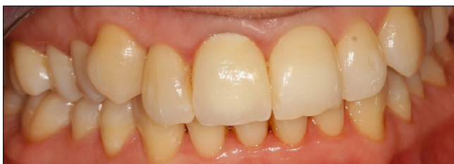
2.6. ábra: Kész korona átadása

A korona elkészültéig, a mechanikai irritációt megszüntetve, a parodontium gyulladásnak indult. A cirkóniumváz próbája után (2.5. ábra), Vita Easyshade készülék segítségével kiválasztottuk a megfelelő fogszínt, majd a váz leplezése után a korona becementezésre került (2.6. ábra).