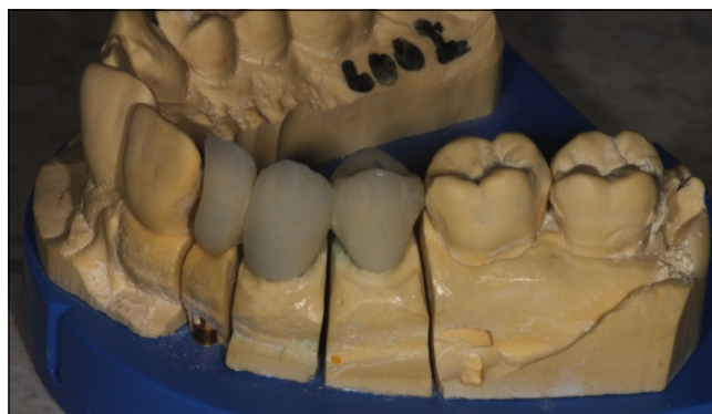
1.4. ábra: Nyerspróba mintán