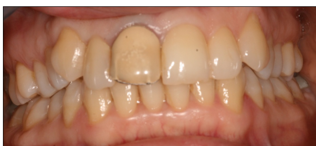
2.1. ábra: Kiindulási állapot