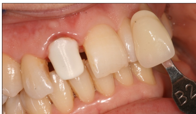
2.5. ábra: Cirkónium-dioxid váz próbája és fogszínválasztás