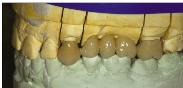
3.3. ábra: Az elkészült lateralhíd artikulátorban