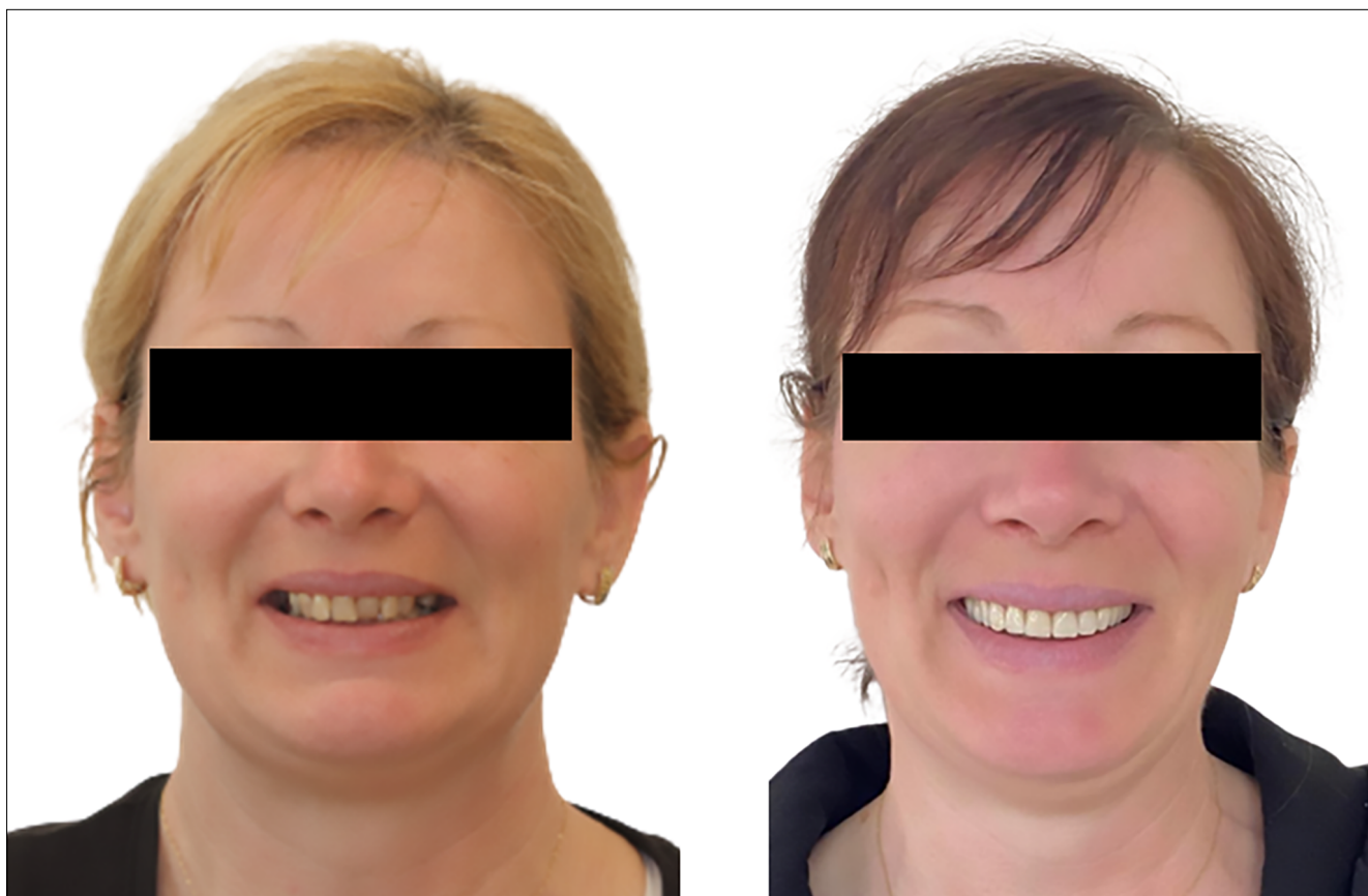
7. kép: Arcfotó a kezelés előtt és után