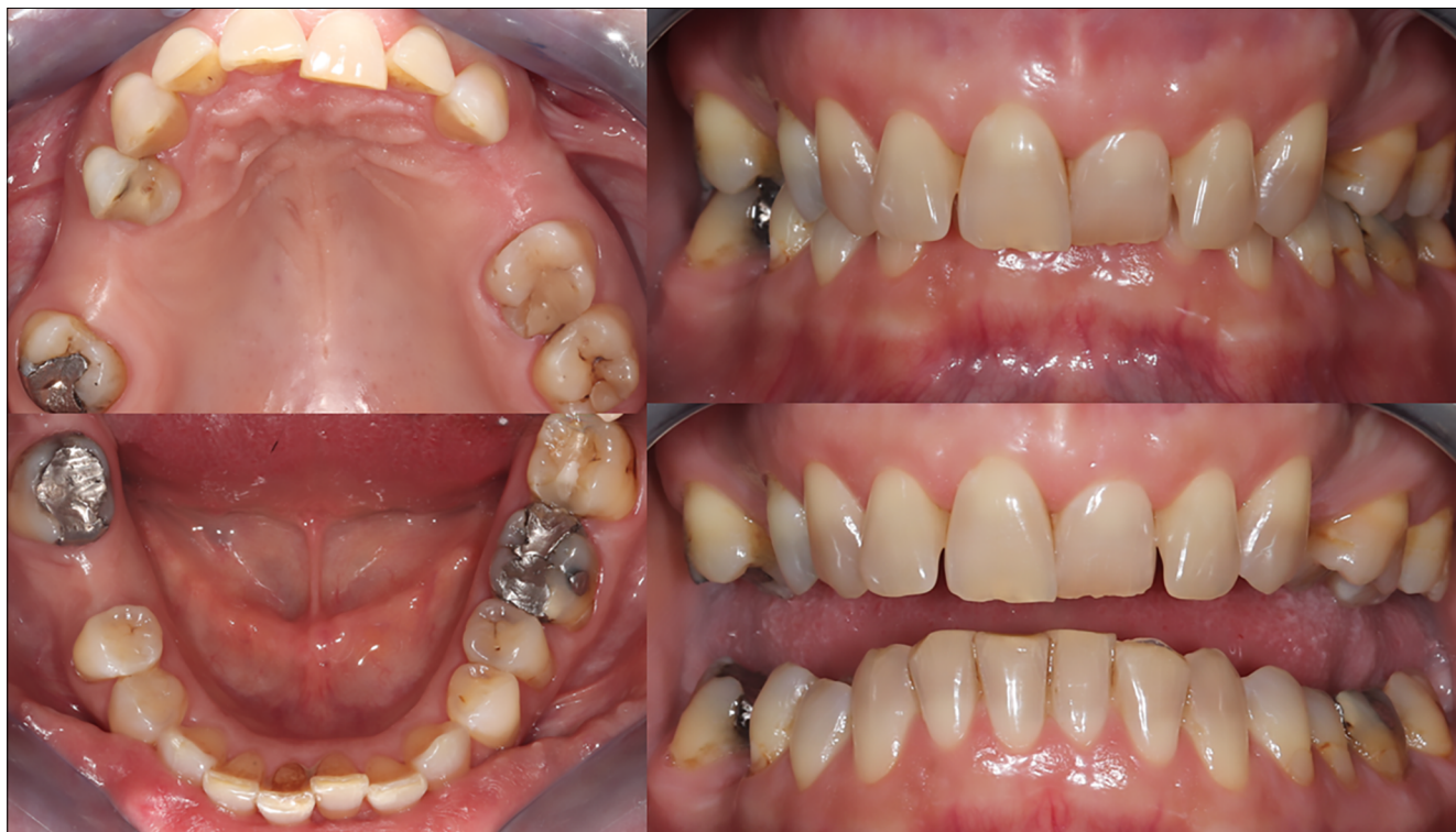
1. kép: Kiindulási státusz az alsó és felső állcsonton, IKP és enyhén nyitott pozíció

A kezelést befolyásoló tényezők között fontos megemlíteni az SPA-páciensek gyógyszerelését. Manapság gyakran alkalmaznak biológiai terápiát, leggyakrabban TNF-gátló vagy IL-17 citokin gátló terápiában részesülnek az SPA-s betegek. Az ilyen páciensek a kezelés során immunszupresszált állapotúnak tekintendők. Jelen páciens esetében a kezelőorvosával egyeztetve a vérzéssel járó beavatkozások előtt két héttel abba hagyta a páciens a biológiai terápiát, és két héttel a beavatkozások után kezdhette el újra. Így az extractiót, gyökérkezelést és a parodontológiai beavatkozást úgy alakítottuk időben, hogy csak egyszer kelljen megszakítani a gyógyszeres kezelést.