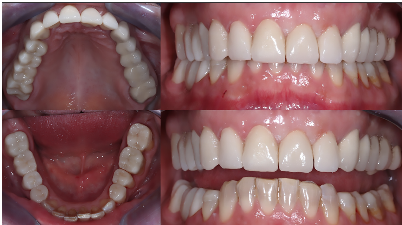
6. kép: Végleges fogpótlások a szájban