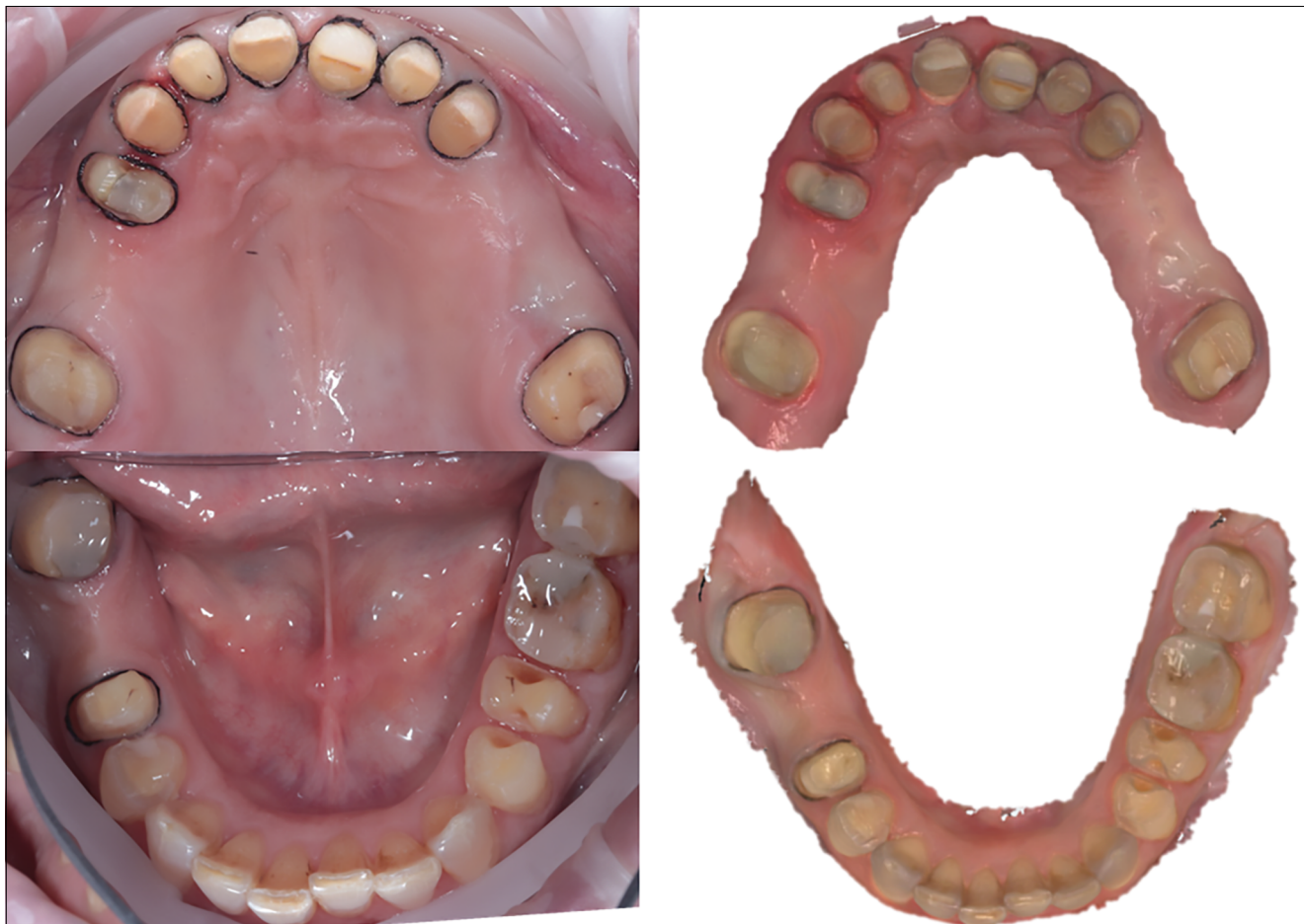
4. kép: Preparált csontok és digitális precíziós-szituációs lenyomatok