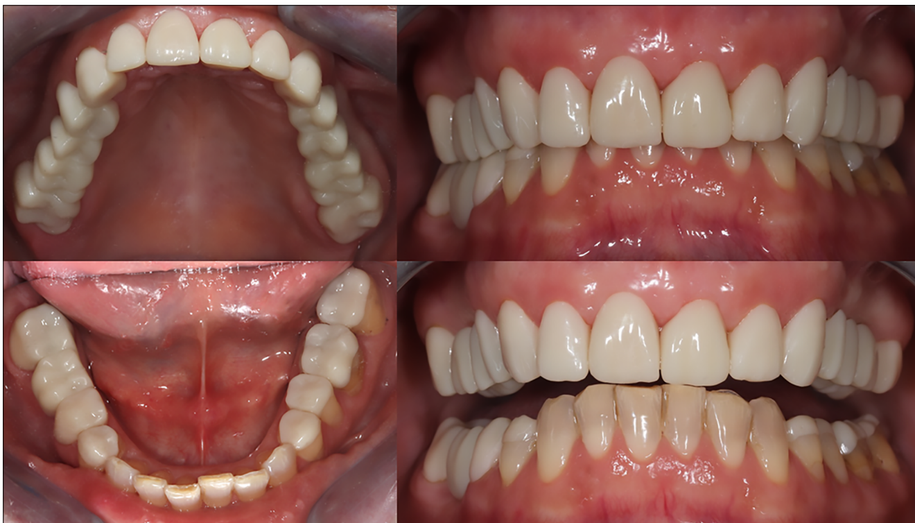
5. kép: Hosszú távú ideiglenes fogpótlások a szájban