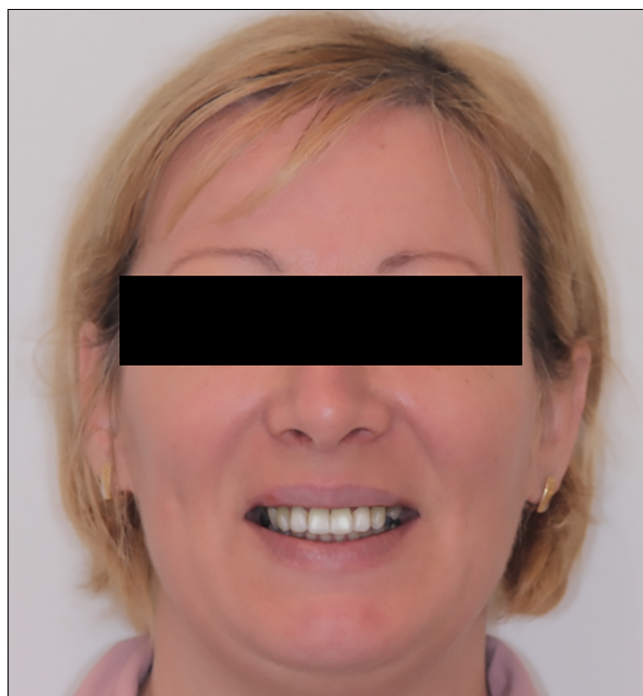
3. kép: Smile design

meghatározása (2. kép). A harapásemelés mértéke 2 mm volt. A megemelt harapási magasságban, az intraorális rajzolókészülékkel együtt újabb digitális lenyomatvétel történt. A fájlok és az előzetes fotódokumentáció alapján a 3Shape Unite szoftver segítségével megtörtént a smile-design (3. kép). A szoftverben készült mosolyterv alapján digitális wax-up készült mind az alsó, mind pedig a felső állcsontra. Ezt a diagnosztikus digitálisan „felviaszolt” állapotot a laboratórium kinyomtatta számkra, és a modellek alapján direkt módon mock-upot készítettünk a páciens számára. Mivel a diagnosztikus mock-up alapján a páciens elégedett volt a fogak formájával és kényelmesnek találta a megemelt harapási magasságot, készítettünk egy pre-preparációs szkennet, a fogak preparálása után pedig egy precíziós-szituációs digitális lenyomat készült duplafonális sulcustágítási technika alkalmazása mellett (4. kép). A digitális harapásrögzítés során szekvenciális harapásvételt alkalmaztunk a mock-upok segítségével. Ahogy az a fog tengelyállását figyelembe véve várható volt, a preparálás során a bal felső középső metsző pulpakamrája megnyílt, így annak gyökérkezelését elvégeztük. A páciens számára a mock-up-nak megfelelő szék melletti ideiglenes fog-