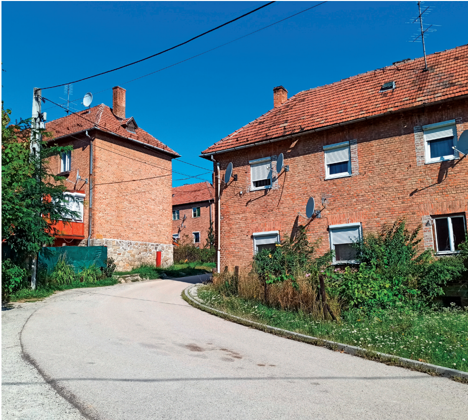
3. kép Újhermes egységes tervek és kivitelezés alapján készült bányász-lakótelepe. Picture 3 Mining colony built by unified plans at Újhermes.

A Soproni-hegység egykor virágzó szénbányászatához kapcsolódóan a térségben több helyen bányászkolóniák jöttek létre, így többek között Brennbergbánya, Görbehalom mellett Óhermesen és Újhermesen is. Morfológiájukban mind a mai napig tükröződik egykori funkciójuk. Mindkettő tisztán lakófunkciójú egykori bányásztelep. Óhermesen a házak egy része ún. „hosszúház”, amelyekben két-két család lakik. Újhermesen pedig Füredi Oszkár soproni építész tervei alapján készült 1943-ban egységes kivitelezésű bányász lakótelep. A házak téglalapítesűek, egyemeletesek, mindegyik 4 családnak ad otthont (3. kép). Mindkét településen kevésbé tehetősek laknak, ám egyik sem nevezhető igazán szegénynek, különösen nem szegregátumnak.