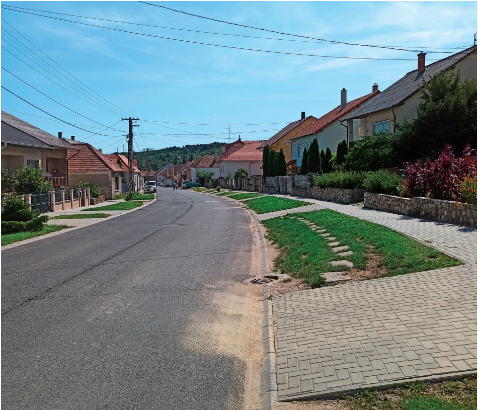
4. kép Rurális utcakép Balfon. Picture 4 Rural street view at Balf.

A Sopron központi belterületétől 7,9 km-re fekvő Balf egykor önálló község volt. 1985-ben csatolták Sopronhoz. Mind a Fertő-táj, mind a Soproni borvidék jelentős települése, így egyik fő funkciója a turizmus. Több jó minőségű úttal, utcával rendelkező, rurális településrész, sűrű beépítéssel (4. kép). Maga a gyógyfürdő ettől elüt, de a környezete falusias jellegű. Az ingatlanok többnyire jó állapotúak, sok a felújított ház. A településrész déli, Sopronhoz közelebb fekvő része szuburbanizálódik. A lakosság összetétele ennek megfelelően vegyes, de inkább átlagosabb jövedelmi helyzetűek vagy tehetősebbek lakják.