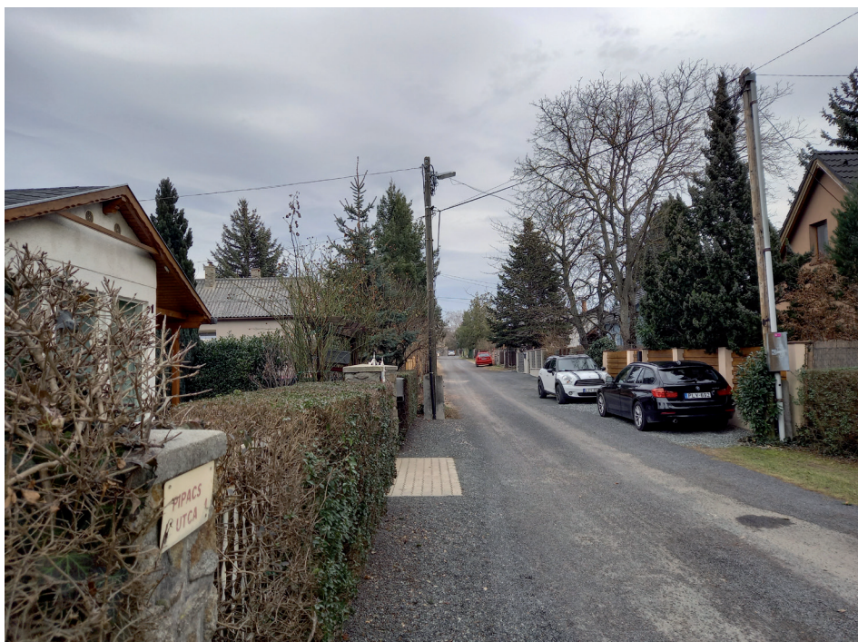
5. kép Utcakép rekreációs és lakófunkciójú hasznosítással Tómalmon. Picture 5 Street view with recreational and residential functions at Tómalom.

A Sopron központi belterületétől 6 km-re fekvő Tómalom 706 fős népességével az egyik legnépesebb egyéb belterület a Soproni járásban. A területén lévő tavak mellé már a középkorban malmok települtek, majd a 19. század közepén fürdőhely is létesült. A malmok mára elpusztultak, a tóparti fürdő viszont jelentősen kibővült. A 20. század második felében a tófürdő közelében kezdtek el kialakítani azt a zártkerti területet, amelyet ma Tómalomként ismerünk. A zártkert alapvetően rekreációs célokat szolgált, a lakófunkció hivatalosan csak az 1990-es évektől jelent meg (1990-ben még nem lakták). Az elmúlt évtizedekben a terület átalakult, a főúthoz és Sopronhoz közeli déli és nyugati részén a kiskerteket felváltja a lakófunkció, az északkeleti, a fürdőhöz közeli részeken ma is a rekreációs funkció a domináns (5. kép). Szolgáltatásokkal alig rendelkezik (a fürdő közelében büfé, ajándékbolt, játszótér), a buszközlekedés ugyanakkor kiváló Sopron felé: mind a helyi, mind a helyközi járatok megállnak itt. Tómalom utcahálózata és