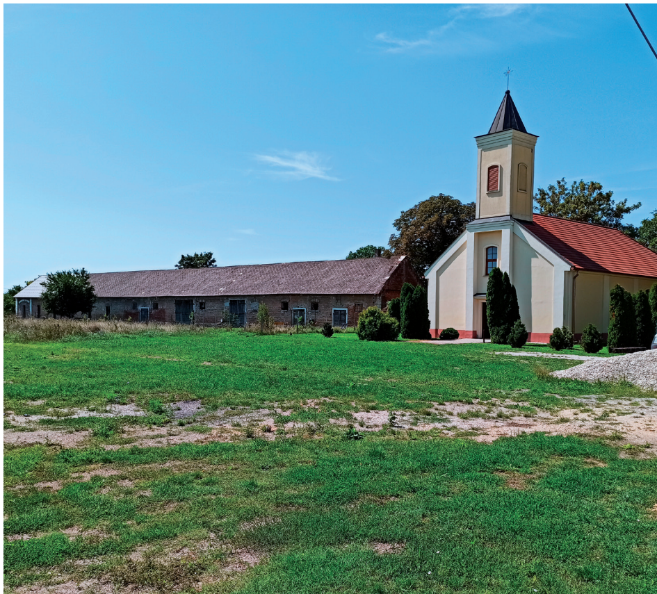
1. kép A fertőújlaki Világok Királynője Templom, mellette az egykori majorsági istállóval. Picture 1 The Queen of Flowers Church at Ferőújlak.

1976 óta viseli a Fertőújlak nevet, korábban Mekszikópuszta néven volt ismert (BALOGH A. – BAJMÓCY P. 2011). Északról, keletről és nyugatról is az osztrák–magyar államhatárral határos. Területe a Fertő-Hanság Nemzeti Park része. A településrész maga rurális jellegű, az egykori Esterházy-uradalom épületeiből ma már alig áll néhány (istálló, cselédház). Egykori vasútállomása a Fertővidéki Helyiérdekű Vasúté volt, az épület még ma is áll. Három főbb, egymással párhuzamos utcája van, a legészakabbi Fertőújlak ütőere: kiváló minőségű, aszfaltozott út, amely egyben a Fertő-tóval kapcsolatot biztosító kerékpárút is. Turizmusa a határközelségre és a természetvédelemre épít. „Főutcájához” kapcsolódik a legtöbb szolgáltatás (kocsma/kerékpáros pihenő, kerékpárparkoló, játszótér, templom (1. kép), madármegfigyelő, második otthonok, falusi szállásadás). Ebben az utcában látható a legtöbb gyönyörű, magas fallal elkerített, rezidenciális jellegű lakóház, amelyek közül sok új építésű. Az ezzel párhuzamos másik két utca rosszabb minőségű, de ez a lakóépületek fizikai állapotában alig köszön vissza. Rossz állapotú ház szinte nincs is. Átalakuló jellegének következménye, hogy társadalmilag igen vegyes csoportok lakóhelye.