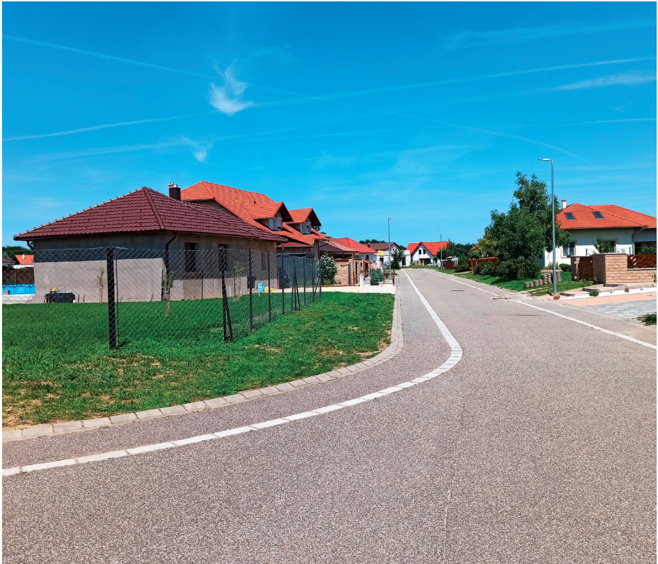
2. kép Csitkés új építésű szuburbán lakóépületei. Picture 2 New suburban buildings at Csitkés.

Eredendően is lakófunkciójú egyéb belterület, amely napjainkra modern, új építésű szuburbán lakónegyeddé fejlődött. A hivatalos neve Csitkés, de mindenki Széchenyi-Lakópark vagy Széchenyi-Village néven emlegeti. Nagycenk központi belterületétől mintegy 2 km távolságra, a Széchenyi-kastély közelében fekszik. Lakónépessége a 2011-es népszámlálási adatok alapján mindössze 45 fő, napjainkban viszont már több száz főre tehető. Rendkívül látványosan növekszik nem csak az ott élők, de a lakóépületek számát illetően is. Növekedésével a funkciók megtelepedése egyelőre nem tudott lépést tartani, egy fodrászatot, illetve játszótéren kívül egyértelműen a lakófunkció a domináns. Sopron szuburbán zónájába esik, ingatlanjai eltérő stílusúak, nagy alapterületűek, láthatóan zömében magyar tulajdonosokkal (2. kép). Érdekes, hogy Csitkésen nincs buszmegálló, a településrész peremén elhaladó úton is csak napi egy buszjárat közlekedik, de az sem