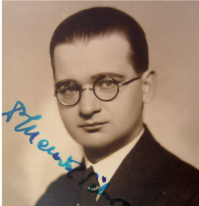
1. kép MENDÖL TIBOR az 1930-as években Picture 1 TIBOR MENDÖL in the 1930s

tották. A gyorsan emelkedő pályáiv azonban még az igazi kiteljesedés előtt, a második világháborút követő években megtört. Nem egyedi ez a történet Magyarországon és az egykori szocialista országokban sem, ahol egy egész tudósnemzedék osztozott MENDÖL sorsában. MENDÖL életútjának végigkövetése a magyar földrajztudomány történetének két korszakát is bemutatja: először azt az időszakot, amikor a földrajz intézményeiben erős, a korszak magyar közgondolkodásban kulcsfontosságú, a tudománypolitikában kiemelt diszciplína volt, majd pedig a berendezkedő kommunista rendszerben gyökeresen átalakítva a tudományos élet periferiájára szorult. Ez az átalakulás nem csak a tudományfilozófia és a tudomány alapvető feladatainak megváltozását jelentette, hanem a kutatók, egyetemi oktatók kicserélődését is. Bár MENDÖL katedráját nyugdíjazásáig megtarthatta, de tanítványai nem maradhattak az egyetemen, műveinek kiadását akadályozták, tudományos eredményeit nyíltan bírálták. Aki MENDÖL halála után néhány évvel hallgatott földrajzot Budapesten, nagy valószínűséggel már a nevével sem találkozott, munkái kikerültek az egyetemi tananyagokból. Életművének, munkásságának újraértékelése csak évtizedekkel a halála után kezdődött meg.