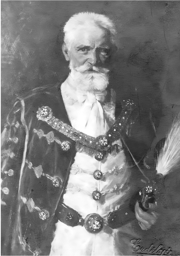
6. ábra Cholnoky Jenő (Edvi Illés Aladárné Karády Etel festménye egy képeslapon)