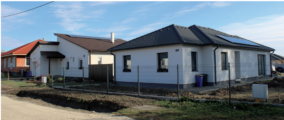
1. kép Szuburbán lakóingatlanok – Katonatelep (Kecskemét) Picture 1 Suburban residential property – Katonatelep (Kecskemét)

tének közelében elhelyezkedő, a szuburbanizáció által érintett csoportos település (pl. Katonatelep, Hetényegyháza, Halasi úti kiskertek), valamint az idegenforgalmi települések üdülőfunkciójú településrészei (pl. a Dávodi Püspökpuszta, vagy a kunfehértói Üdülőtelep). Ezek a településeken általános látványt jelentenek a beépítés alatt álló háztelkek, a magas komfortfokozatú modern kertes családi házak. Ugyanakkor a gyors népességnövekedés kedvező hatásai mellett annak negatív következményei is jelen vannak. Jó példa erre Katonatelep északkeleti településrésze (1. kép), ahol egyrészt a közlekedési infrastruktúra fejlődése nem képes lépést tartani a pozitív vándorlási egyenleg miatt gyorsan növekvő népességgel, másrészt a megnövekedett kereslet miatt egyre kisebb házhelyek kerülnek parcellázásra és beépítésre, amely zsúfolt településképet, valamint zöldfelületi degradációt eredményezett. Mindez hosszútávon együttélési nehézségekhez, valamint a településrészt idilli hangulatának, vagyis fő vonzerejének elvesztéséhez vezethet (KOK H. 1999; BROWN, L.D–SCHAFFT, K.A 2002; TÓZSA I. 2002; JANKÓ F.–KOMORNOKI M. 2008; GANT, et al. 2010; CSURGÓ B. 2013; GYENIZSE P. et al. 2016; ŽRÓBEK-RÓŽAŇSKA, A.–ZADWORNÝ, D. 2016a).