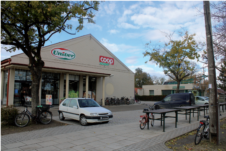
9. kép Élelmiszer áruház és gyógyszertár Hetényegyháza központjában Picture 9 Food store and pharmacy in the centre of Hetényegyháza

Habár azóta elvesztette önállóságát, ellátás tekintetében nem marad el a hasonló népességgel rendelkező falvaktól (9. kép): központjában az alapvető piaci szolgáltatások mellett (pl. élelmiszerbolt, kocsmá, étterem) közszolgáltatások (általános iskola, művelődési ház, orvosi rendelő, gyógyszertár), valamint néhány speciális igényeket kielégítő, jellemzően városi szolgáltatás is megtalálható (szépségszalon, kutyaiskola stb.). A Kecskemét központjától északra elhelyezkedő Katonatelep szintén számos piaci szolgáltatást biztosít a helyi lakosoknak (pl. panzió, büfé, dohánybolt stb.) de azok minősége és mennyisége már messze elmarad Hetényegyházához vagy Kecskemét központi belterületéhez képest, a Kecskemét központjától délre kb. 5 kilométer távolságra elhelyezkedő Halasi úti kiskertek esetében pedig már a szolgáltatások teljes hiányát tapasztaltuk. Mindez azt bizonyítja, hogy a lakóhelyi szuburbanizáció nem minden esetben jár együtt a gazdasági szuburbanizációs folyamatokkal. Az ellátás tekintetében a turisztikai és üdülő funkciójú települések felemás képet mutatnak. Habár a települési alapszolgáltatások bizonyos szegmensei megfigyelhetők (pl. élelmiszerüzletek, vendéglátóhelyek) azok a legtöbb esetben csak a turisztikai főszezonban funkcionálnak, települési közszolgáltatások pedig egyáltalán nem jellemzőek ezeken a településeken, mindez pedig erősíti a lakófunkció ideiglenes jellegét is.