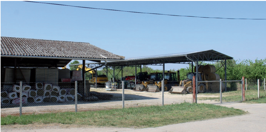
5. kép Mezőgazdasági üzem – Hild (Érsekhalma) Picture 5 Agricultural holding – Hild (Érsekhalma)

enged következtetni, hogy az informális gazdasági tevékenységek még a mai napig jelentős szerepet játszhatnak a háztartásoknak a mindennapi életében. Ugyanakkor a mezőgazdasági funkció megléte szempontjából az egykori majorságok továbbra is jelentős kategóriát jelentenek a csoportos településeken belül, mindannak ellenére, hogy a második világháborút követően a nagybirtokrendszer felszámolása, később pedig a mezőgazdaság szocialista átszervezése megszüntette eredeti létalapjukat. Például Hóduna és Hild esetében egy napjainkban is működő gazdasági üzemből beszélhetünk, ahol megfigyelésünk szerint mezőgazdasági tevékenységet folytató vállalatok telephelyei működnek részben új (5. kép) részben a régi majorsági épületeket is felhasználva (6. kép). Kiscsala és Öregmajor esetében viszont jelentősebb gazdasági funkcióról már nem beszélhetünk, legfeljebb az egykor központként szolgáló kúria idegenforgalmi (szálláshelyként történő) felhasználása kerül szóba időszakos jelleggel.