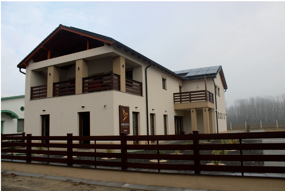
7. kép Modern szálláshely – Üdülőtelep (Kunfehértó) Picture 7 Modern accommodation – Üdülőtelep (Kunfehértó)

A szolgáltató funkciójú települések egy másik markáns, ám jóval kisebb számú szegmensét jelentik azok, amely népességüket, és ezáltal létüket különféle megtelepedett szociális, egészségügyi vagy egyéb, pl. oktatási vagy büntetés-végrehajtási intézménynek