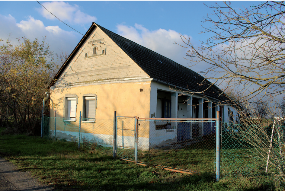
4. kép Romos lakóingatlan – Öregtény (Szakmár) Picture 4 Ruined residential property – Öregtény (Szakmár)

népességgel és kedvezőtlen közlekedésföldrajzi helyzettel rendelkeznek. Ilyen például a szakmári Öregtény, amely, habár a legfrissebb népszámlálási adatok alapján 2 fő lakossal rendelkezik, vizsgálatunk idején egyértelműen egy elnéptelenedett település benyomását keltette. Az egyetlen utcából álló egykori szállás valamennyi épülete romosnak és/vagy lakatlannak bizonyult (4. kép). A Kalocsától 7,5 km-re déli irányban fekvő Drágszélpusztá pedig a már fizikailag is csaknem teljesen elpusztult településre ad szemléletes példát. Összességében megállapítható, hogy a szocializmus előtti időszakban kiépült csoportos települések lakófunkció tekintetében degradálódnak: lakásállományuk nagyrésze súlyosan károsodott vagy lakhatatlan népességük, pedig csökkenő és öregedő.