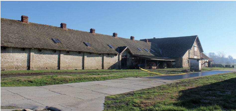
6. kép Mezőgazdasági üzem – Hóduna (Császártöltés) Picture 6 Agricultural holding – Hóduna (Császártöltés)