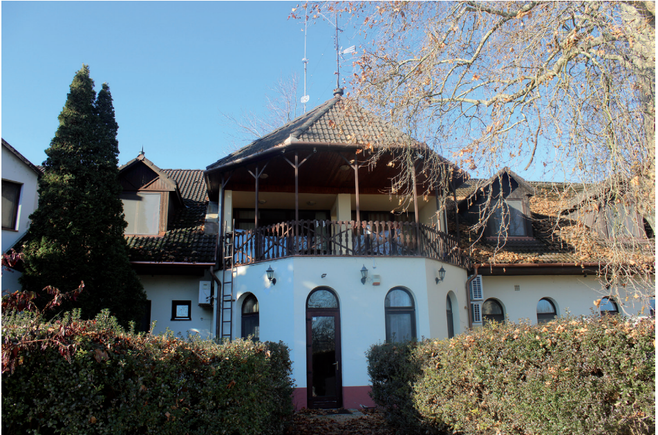
8. kép Üzemen kívüli szálláshely – Püspökpuszta (Dávod) Picture 8 Off-site accommodation – Püspökpuszta (Dávod)

köszönhetik (pl. a solti Nagymajor, a hartai Állampuszta, valamint a kunszentmiklósi Felsőszenttamás). Ez a fajta szolgáltató funkció leginkább az egykor majorként funkcionáló csoportos településeken figyelhető meg, azon belül is leginkább azoknál, amelyek kedvező közlekedéscsoporthelyi helyzettel, vagy hasznosítható épületállománnyal rendelkeznek (pl. kastély, kúria) ezzel állítva azokat új fejlődési pályára. (BALOGH A.–BAJMÓCY P. 2011, 2012; BALOGH A. 2015; MASINKA K. 2018; BAJMÓCY P. et al. 2018; BALOGH A.–BAJMÓCY P. 2022).