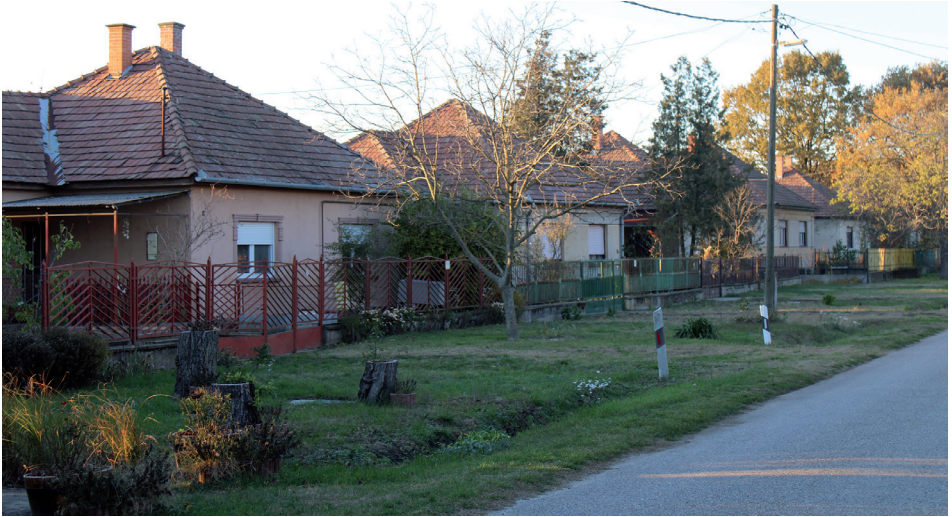
2. kép „Kádárkockák” a település központjában – Balázs (Szabadszállás) Picture 2 „Kádár Cubes” in the centre of the settlement – Balázs (Szabadszállás) Forrás/Source: Saját fotó, 2023; Own photo, 2023.

a közepes és a súlyosan leromlott állapot között mozog, a lakáskomfort alacsony, valamennyi településen számos romos és lakatlan ingatlant is felfedeztünk. A legtöbb település közlekedési infrastruktúrája hiányos: az utcák nagy részét aszfaltozott út helyett lerakott betonlapok alkotják, a falu végi utcák pedig sok esetben semmilyen szilárd burkolattal nem rendelkeznek. Habár az említett csoportba tartozó települések lakófunkció tekintetében rendkívül kedvezőtlen képet mutatnak, kis mértékű differenciálódás mégis megállapítható: azok a települések, melyek viszonylag kedvező közlekedésképzési helyzettel és népességszámmal rendelkeznek, lakófunkciójukat képesek voltak jobban megőrizni, ám arculatuk és lakásállományuk jelentősen átalakult, korabeli épületeik jelentős részét elvesztették, az egykori szállások, majorok esetében pedig a cselédházak helyén ma már jellemzően a 20. század második felében épült lakóházak (kádárkockák) dominálnak (kivételet képez ez alól az érsekhalmai Hild (3. kép) valamint a hercegszántói Hóduna). Legsúlyosabb helyzetben azok a települések vannak, amelyek alacsony