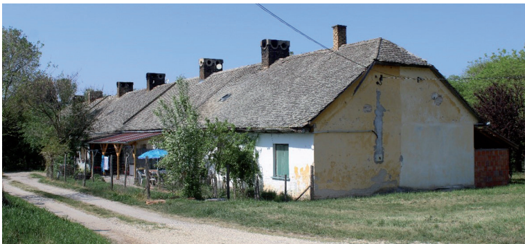
3. kép Lakóingatlanként használt egykori cselédházak – Hild (Érsekhalma) Picture 3 Former servants' houses used as dwellings – Hild (Érsekhalma) Forrás/Source: Saját fotó, 2023; Own photo, 2023.

a közepes és a súlyosan leromlott állapot között mozog, a lakáskomfort alacsony, valamennyi településen számos romos és lakatlan ingatlant is felfedeztünk. A legtöbb település közlekedési infrastruktúrája hiányos: az utcák nagy részét aszfaltozott út helyett lerakott betonlapok alkotják, a falu végi utcák pedig sok esetben semmilyen szilárd burkolattal nem rendelkeznek. Habár az említett csoportba tartozó települések lakófunkció tekintetében rendkívül kedvezőtlen képet mutatnak, kis mértékű differenciálódás mégis megállapítható: azok a települések, melyek viszonylag kedvező közlekedésképzési helyzettel és népességszámmal rendelkeznek, lakófunkciójukat képesek voltak jobban megőrizni, ám arculatuk és lakásállományuk jelentősen átalakult, korabeli épületeik jelentős részét elvesztették, az egykori szállások, majorok esetében pedig a cselédházak helyén ma már jellemzően a 20. század második felében épült lakóházak (kádárkockák) dominálnak (kivételet képez ez alól az érsekhalmai Hild (3. kép) valamint a hercegszántói Hóduna). Legsúlyosabb helyzetben azok a települések vannak, amelyek alacsony