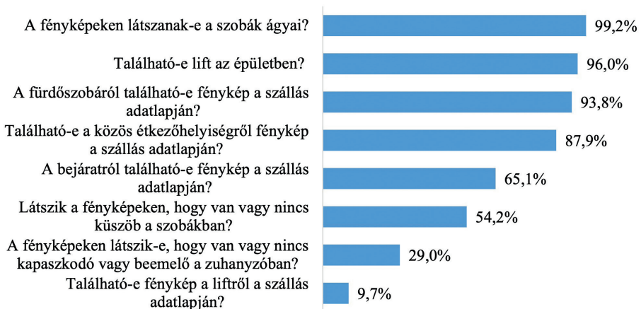
3. ábra A vendégek általi ellenőrizhetőséghez felhasznált kérdésekre adott igen válaszok előfordulásának gyakorisága (n=885)

A 3. ábra alapján szinte az összes mintában szereplő szálláshely (99,2%) megjelenít fényképeket a szálláshelyek ágyairól, 96%-uk épületében található lift, 93,8%-ban a fürdőszobáról és 87,9%-ban a közös étkezőhelyiségről található fénykép az adatlapjukon, amely magas arányok mind igen pozitív jellemzőnek tekinthetők. A bejáratról (65,1%) már ennél kisebb arányban jelenítenek meg fényképeket, és a fényképekről csak a szálláshelyek 54,2%-a esetén lehet megállapítani, hogy a szobákban van-e küszöb. A fürdőszobai képeken a szálláshelyek 29%-a esetén látható, hogy van-e kapaszkodó vagy beemelők