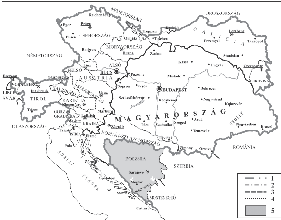
1. ábra Az Osztrák Császárság és a Magyar Királyság belső közigazgatási területei, 1918

A világháború alatt sajátos módon kiéleződött a két fél versenye Boszniáért (KÓSZEGI M. 2018). Ennek az lett az egyik lényegi következménye, hogy mind az osztrák, mind pedig a magyar kormány, illetve törvényhozás kedvezni kívánt az iszlám vallásnak, illetve híveinek. Mind Ausztriában, mind pedig Magyarországon hivatalosan elismert vallássá vált az iszlám (HAJDÚ Z. 2017).