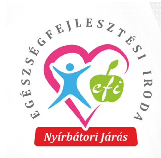
3. ábra: Az Egészségfejlesztési Iroda logója