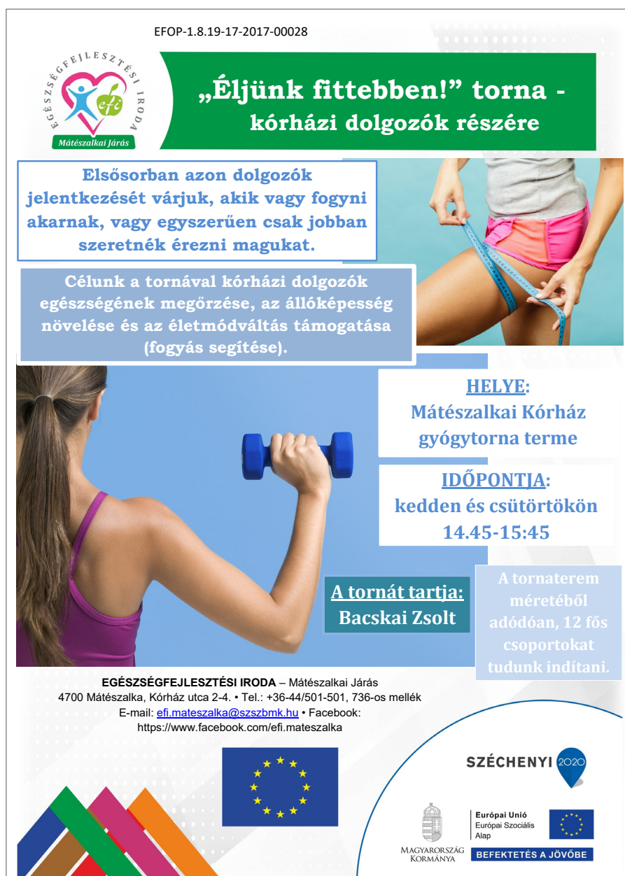
1. ábra: „Éljünk fittebben” tornaprogram plakátja