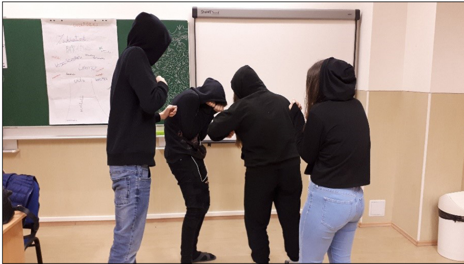
2. ábra: Bántalmazás és konfliktushelyzet alkalom, csoportfoglalkozási pillanatkép