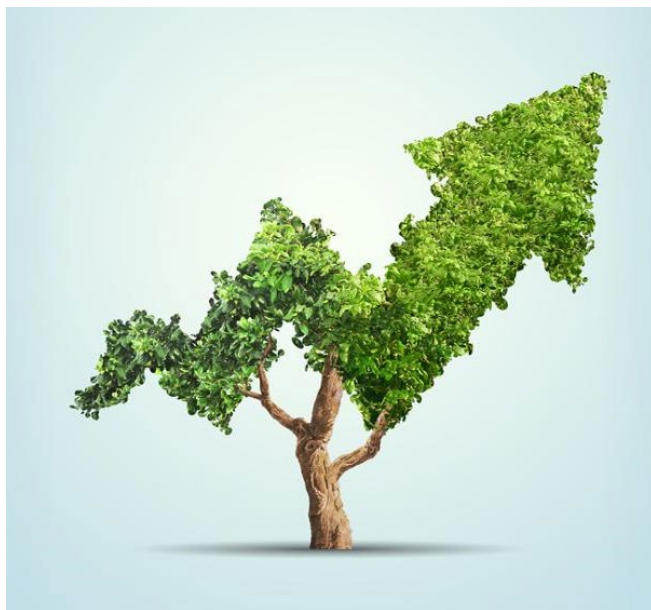
4. ábra: Növekvő jólléti gazdaság