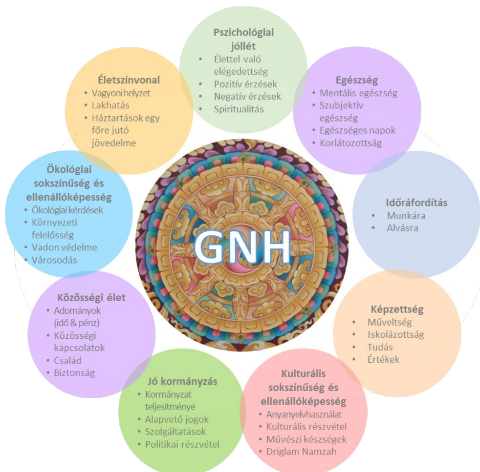
1. ábra: Bruttó nemzeti boldogság (GNH) 9 területe és 33 mutatója

Forrás: saját szerkesztés Sangha et al., 2019 alapján