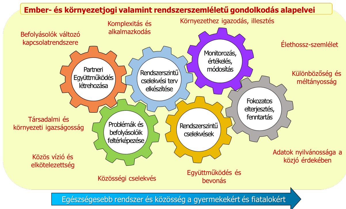
1. ábra: A gyermekkori elhízás rendszerszintű visszaszorítását célzó gyakorlatorientált keretrendszer