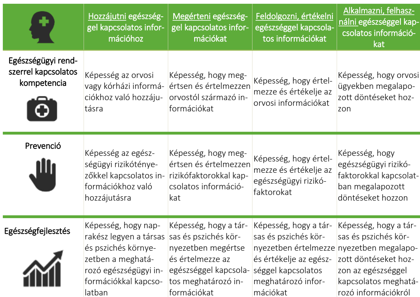
1. táblázat: Az egészségértés integrált konceptuális modelljének összefoglalása