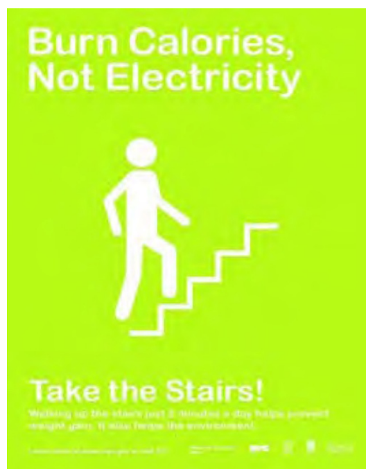
4. ábra: A lifteknél és mozgólépcsőknél elhelyezett, lépcsőhasználatot ösztönző kép (School Construction Authority, New York)