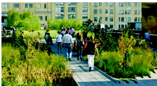
5. ábra: High Line Park, New York

Forrás: Active design guidelines, 2010, City of New York