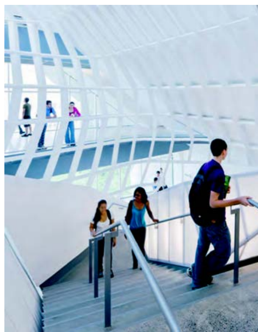
2. ábra: A New York-i Cooper Union főiskola egyik épületének központi lépcsője