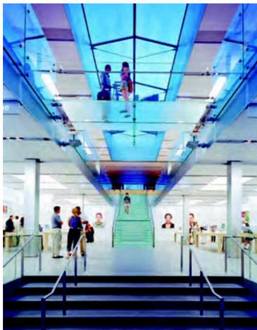
3. ábra: A lépcsők elhelyezése a bejáráshoz közel ösztönzi a mindennapos használatot (Apple üzlet, Manhattan, építészek: Bohlin Cywinski Jackson és Ronette)