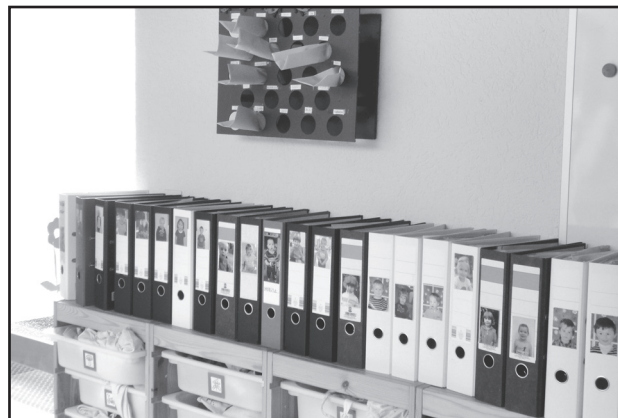
A gyermekek fejlődési naplója, felettük a szülőknek szóló levelek

beszélnek, hogy ki mivel szeretne aznap foglalkozni, kinek mihez van kedve, majd együtt döntenek a továbbiakról is – megtervezik, átgondolják a célt, a folyamatokat, az eszközigényt, megbeszélnek a kereteket, a szabályokat, a veszélyes szituációkat és azok megelőzését, valamint a munka utáni rendrakást. A szabályok betartása mellett fontos a spontán kísérletezés is. Az eredményeket, az elkészült alkotásokat megőrkítik, dokumentálják.