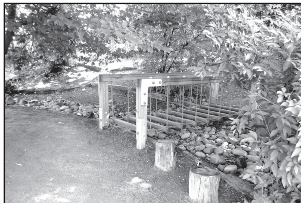
Udvar a „kavicsfolyóval” és a fahíddal

A szülőknek fenntartott két külön információs tábla (az intézménytől a szülőknek, valamint a szülőktől az intéz-