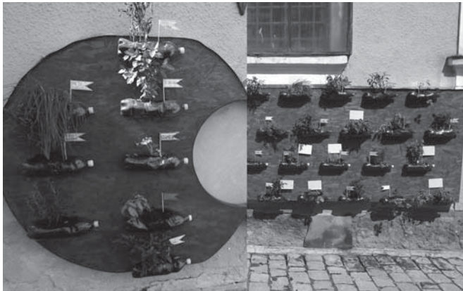
Az egyik díjnyertes alkotás

Aki kertészkedik, az élet körforgásával, a természet teremtő erejével szembeesül. A konkrét termelési igény nélküli elfoglaltságok felébresztik a személyiség alkotó erőit, teret engedve a – zárt intézeti körülmények között gyakran törvényszerűen legátolt – kreatív önmegvalósításnak. A monoton, kiszámítható mindennapok egymásutániségában az odafigyelést, erőfeszítést, rendszerességet megkívánó feladatok kedvező fiziológiai és pszichológiai változásokat indítanak el. Emellett, a kertészkedés bár lehetőséget teremt egy önmagunk felé forduló és szemlélődőbb elmélyülésnek, a megszokott környezetben minőségi kollektív élményeket adhat előéletől, érdeklődéstől, életkortól, intellektustól függetlenül. Pótolhatja a hiányzó érzelmi és esztétikai élményeket, de mindenekelőtt mutat egy alternatívát a kényszer szülte, vagy – szerencsés esetben – spontán rendelkezésre álló szabadidő hasznos kitöltésére.