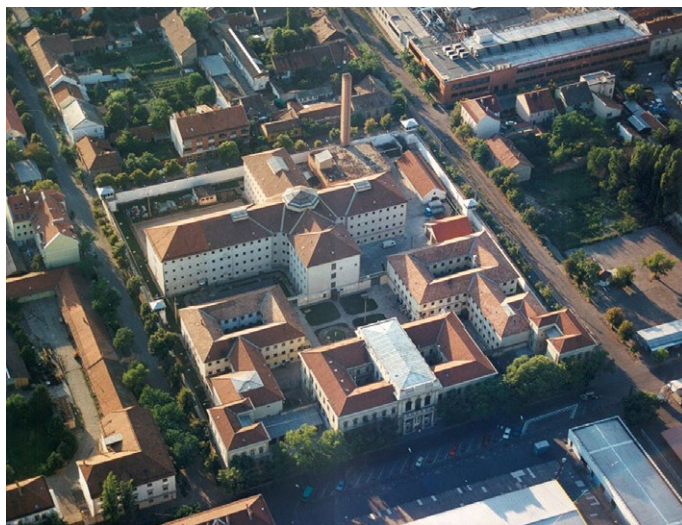
3. kép: A Szegedi Fegyház és Börtön madártávlatból 41

Erre az időszakra tehető a szegedi intézet személyi állományának szakmai és büntetés-végrehajtási szakirodalmi munkásságának kezdete. Egy 10 évvel ezelőtti kutatás során volt lehetőségünk utánajárni, hogy a Szegedi Fegyház és Börtön személyi állománya milyen válaszokat adott azokra a szakmai kihívásokra, amik a 80-as évek kezdetétől jellemezték a magyar büntetés-végrehajtást. A kutatás során kiderült, hogy az intézet munkatársai a 80-as évek elejétől folyamatosan részt vettek a szakmai munkákban, folyamatosan publikáltak a Módszertani Füzetekben, majd később a Börtönügyi Szemlében. A publikációk száma kiemelkedően magas volt, tematikájuk pedig lefedte a büntetés-végrehajtási szakterületek teljes spektrumát, a biztonságtól az egészségügyig, beleértve a munkáltatást is, mint önálló szakterületet. Elmondható, hogy több tanulmány tudományos igényvel készült, amit a téma történetének, szakmai előzményeinek bemutatásához bármikor fel lehet használni, és sok olyan írás született, amik hasznos információkat tartalmaznak a korszak végrehajtási problematikájáról, hiszen azok a hétköznapi gyakorlatát, a felmerülő problémákat járják körül, hol alaposabban kifejtve, hol tömören, a lényegét összegezve. 40