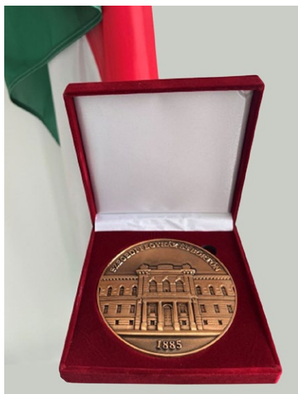
4. kép: Emléklakett 54

A prezentációkat követően a jutalmakat és emléklaketteket Kopcsik Károly bv. dandártábornok, parancsnok adta át az ünnepségen résztvevő vendégeknek és az intézet sok éves szolgálati múlttal rendelkező munkatársainak.