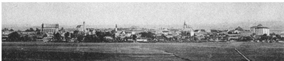
2. kép: Századfordulós látkép Balassagyarmatról, a börtönnel 2