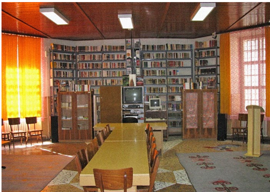
4. kép: Kápolna a felújítás előtt 4