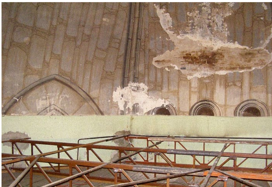
5. kép: A kápolna helyreállításának megkezdése 5