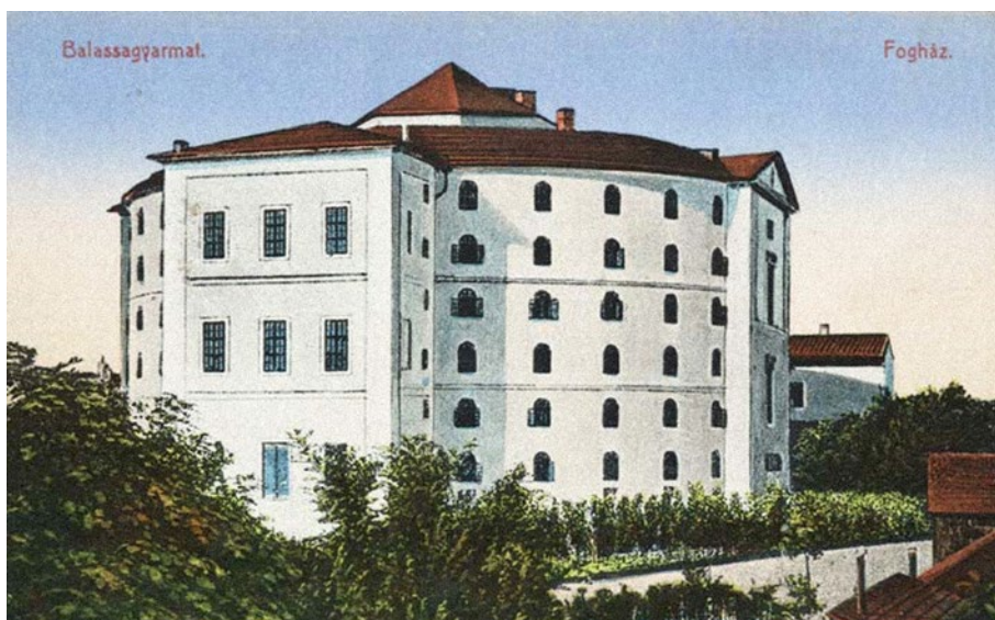
3. kép: Korabeli képeslap a börtönépületről 3

Kialakították a „Börtön Főfelügyelő szabályos utasítását”, mely ma is időtálló rendelkezéseket tartalmaz. (Az előírások leginkább a hatáskörökre és a kötelességekre vonatkoztak.)