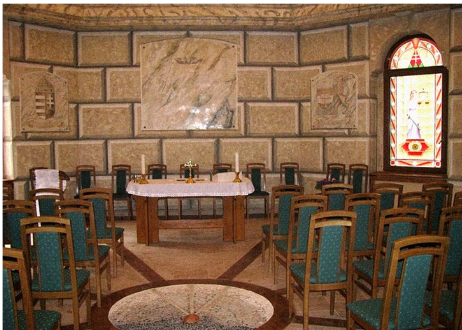
6. kép: Az elkészült kápolna 2009-ben 6

A freskófestés, mint tevékenység az intézetben belül azért bizonyult különleges kezdeményezésnek, mert így amellett, hogy a fogvatartottaknak lehetőségük nyílt egy művészeti ág kipróbálására, egy, a képzőművészetre épülő, egyedülálló közösségfejlesztő terápiában is részesülhettek. Az eljárás két fő részre volt bontható, egyrészt a témafeldolgozó és a falfestést előkészítő szakaszra, másrészt a folyamat kicsúcsosodását jelentő freskó-festmény, mint fő produktum elkészítésére. A freskófestés a művészi önkifejezés egyik nagyszerű eszköze, amely az elítélteket is gondolataik kifejezésére ösztönözte és lehetővé tette önismeretük, problémamegoldó készségük, kreativitásuk fejlesztését.