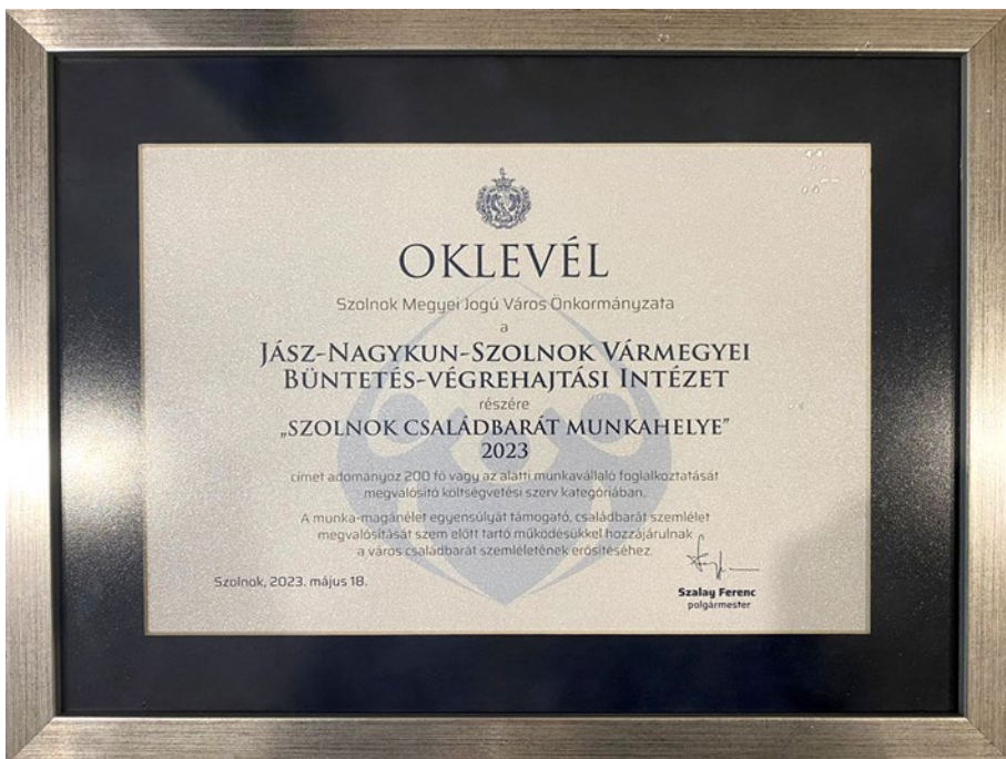
5. kép: A Jász-Nagykun-Szolnok Vármegyei Büntetés-végrehajtási Intézet „Szolnok Családbarát Munkahelye” 2023-as oklevele 13

Szolnok városa 2017-ben fogadta el a „Családbarát Szolnok” programot, melynek célja a munka-magánélet egyensúlyát támogató, családbarát munkahelyek elismerése. A díjat évente ítéli oda a helyi önkormányzat – egy szakmai munkacsoport értékelése után – a közgyűlés döntése alapján. A Jász-Nagykun-Szolnok Vármegyei Büntetés-végrehajtási Intézet 2021-ben, 2023-ban, és 2025-ben is kiérdemelte a „Szolnok Családbarát Munkahelye” címet. Ez a díj azt is elismeri, hogy az intézet aktív családbarát intézkedéseket vezetett be, mint például rugalmas munkarend, a gyermeket nevelők esetében az intézet esélyegyenlőségi tervben szereplő havi négy óra munkaidő kedvezménye és rendezvények szervezése a családok kollégák támogatására.