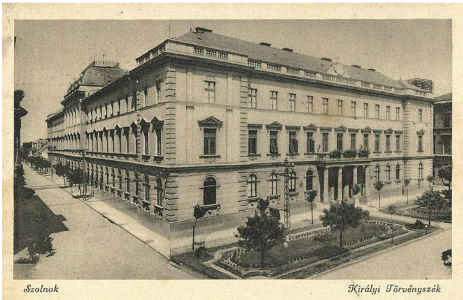
1. kép: Királyi Törvényszék 3

A város által biztosított telken – szemben a korábbi vármegyeháza épületével – 1892 tavaszán kezdődött meg az építkezés, Wagner Gyula építész tervei alapján 2 . Az épület falai már 1892 őszére álltak, és 1893 nyarára elkészült a reprezentatív Igazságügyi palota, homlokzatán „A Királyi Törvényház” felirattal. Ebben az egyemeletes palotában kapott helyet a Királyi Törvényszék és a hozzá tartozó fogház. Egyes források szerint az épület hivatalos alapítási éve 1902, mivel az intézet alapító okirata ekkorra datálódik. Egy korszerűnek számító, csillag alaprajzú épület került létrehozásra, amely a kor európai börtönépítészeti elveit követte. Ezen forma kialakításának oka a központi megfigyelhetőség és a fegyelem fenntartása volt. Az intézet elsősorban letartóztatottak, valamint rövidebb tartamú szabadságvesztés-büntetésre ítélt fogvatartottak elhelyezésére szolgált. A börtön a járásbíróssággal közös épületben kapott helyet, így az igazságszolgáltatás szintjei közvetlenül kapcsolódtak össze.