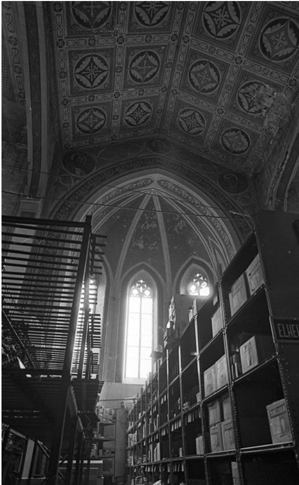
2. kép: A kápolna raktárnak berendezve 5

a börtönlelkészi szolgálat tevékenysége nem csupán a vallási, de az erkölcsi nevelés eszköze is volt. A kápolna egészen 1949-ig működött, és sokáig a civil lakosság számára is nyitva állt, hiszen a karzat jól elkülönült, valamint a mára már befalazott körlet felőli bejáratokon keresztül biztonságosan végre lehetett hajtani a fogvatartottak mozgását, így együtt hallgathatták az istentiszteleteket a fegyencek és a város lakossága. A börtönlelkészi szolgálatot azonban megszüntette az akkor regnáló hatalom, és a lelkészeket elbocsátották. A kápolnát fogvatartotti munkahelyként, majd raktárként hasznosították, nem becsülve a monumentális épület által képviselt szakrális, építészeti és kulturális értékeket.