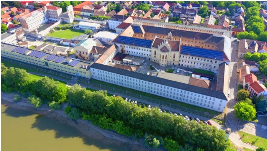
1. kép: A Váci Fegyház és Börtön madártávlatból 1

A Váci Fegyház és Börtön alapításának 170. évfordulója méltó alkalom arra, hogy ne csupán egy intézet múltjáról emlékezzünk meg, hanem a büntetés-végrehajtás egészének történelmi fejlődéséről és arról a hivatástudatról is, amely generációkon átívelve formálta a szervezet szellemiségét. A váci intézet mindig is meghatározó szereplője volt a magyar büntetés-végrehajtási rendszernek, története pedig – akár épületeiben, akár emberi sorsaiban – hű lenyomata a hazai börtönügy fejlődésének, kihívásainak és értékeinek. A jubileum lehetőséget teremt nemcsak a múlt tiszteletére, hanem arra is, hogy elismeréssel szóljunk mindazokról a szakemberekről, akik felkészültségükkel, elkötelezettségükkel hozzájárultak a szervezet fennmaradásához és fejlődéséhez.