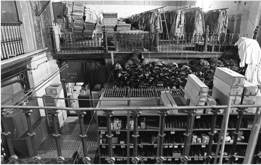
3. kép: 2001-ig működött raktárként 6

Eredeti funkciójában 2001 óta működik újra az épület, és bár szükséges lenne restaurálni, hanyattatott múltja ellenére is jelentős műemléki értéket képvisel, méltó helyszíne az istentiszteleteknek és – akusztikájának köszönhetően – a zenés előadásoknak egyaránt. A kápolna múltja és jelene tehát szoros kötelékben erősíti a büntetés-végrehajtási munka humánus és kulturális dimenzióit.