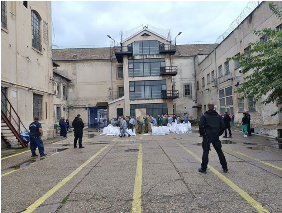
5. kép: A fogvatartottak is kivették a részüket az árvízi védekezésből 9

A Váci Fegyház és Börtön hosszú évtizedeken keresztül olyan szakembereket nevelt ki, akik nemcsak az intézet falai között álltak helyt, hanem a büntetés-végrehajtási szervezet magasabb szintjein is bizonyították rátermettségüket és elhivatottságukat. Ez a szakmai erő nemcsak egyéni teljesítményként értékelhető, a Váci Fegyház és Börtön sikere, a közösség eredménye: a parancsnokok, a vezetők, továbbá a végrehajtó állomány közös munkájának köszönhető, hogy az intézet úgy élt túl századokat és korszakokat, hogy nemcsak működött, hanem példát is mutatott.