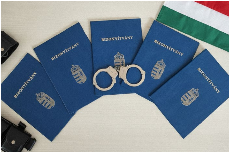
1. kép: A képzést sikeresen elvégző kollégák tanulmányi bizonyítványa